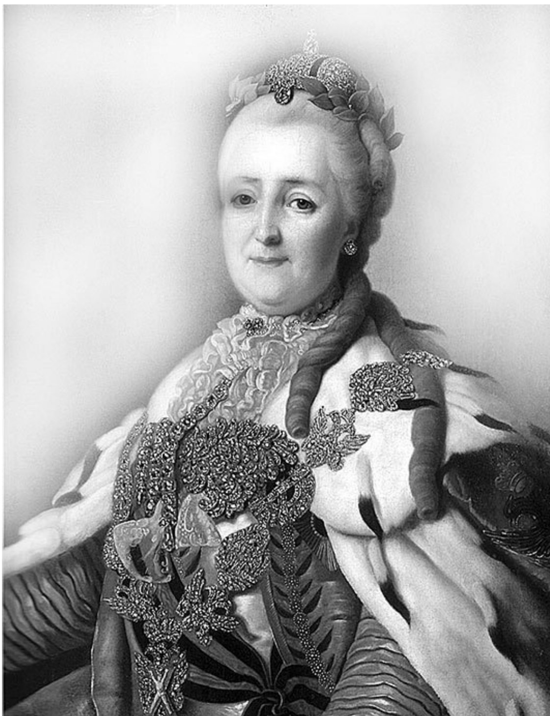
Екатерина II. Неизвестный художник. XVIII в.

Судя по всему, Екатерина II была классической кофеманкой. Ее спитой утренний кофе заваривался после нее несколько раз слугами, и им хватало. Сохранилась легенда, согласно которой «матушка-императрица» в знак особой милости дала испить своего утреннего «кофею» старику-сенатору, того после кофе царской крепости едва сумели откатать.