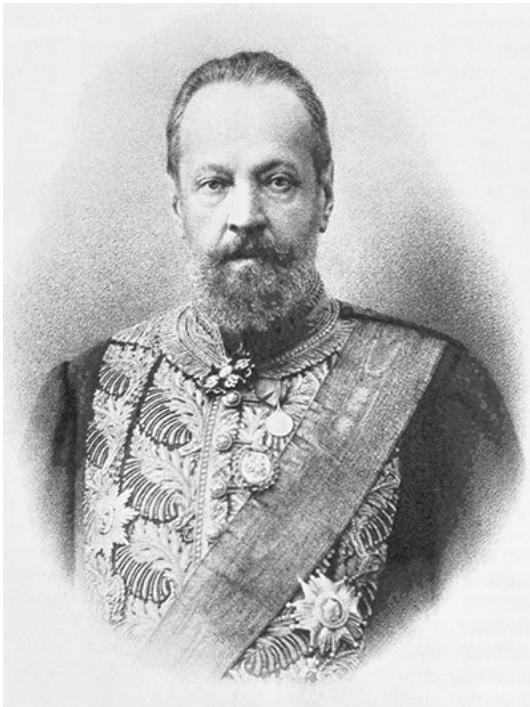
С. Ю. Витте

Нельзя не привести и мнение видного чиновника Министерства Императорского двора В. С. Кривенко, он в унисон с С. Ю. Витте писал, что «придворная кухня, кондитерская и булочная также не могли удовлетворять вкусам заправских гурманов» 17 . Это мнение, видимо из разряда «на вкус и цвет...». Возможно и то, что в лучших петербургских ресторанах, таких как «Донон», «Кюба», «Астория», готовили действительно очень хорошо. На качество кухни, безусловно, влияло и то, что в частных ресторанах повара-«шефы» были буквально «богами