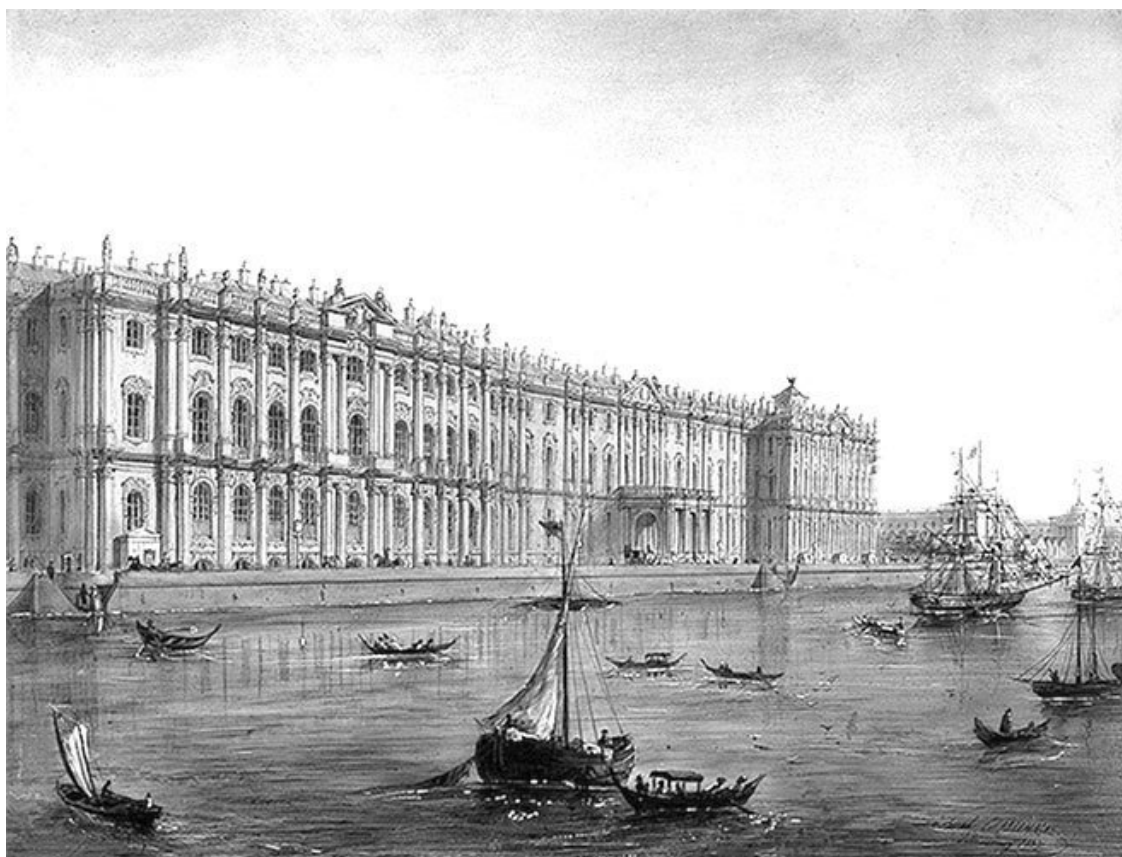
И. И. Шарлемань. Зимний дворец со стороны Невы. 1853 г.

Самый большой кухонный комплекс Зимнего дворца – Императорский – располагался в помещениях первого и полуподвального этажей, сгруппированных вокруг внутреннего двора северо-восточного ризалита. До сих пор бытует старое название этого дворика – Кухонный . В прежние времена его также нередко называли Черным. Сейчас это современное название проезда между Зимним дворцом и Малым Эрмитажем. В подвале кухни хранились продукты, вода, уголь, дрова, лед, а также находились жилые помещения.