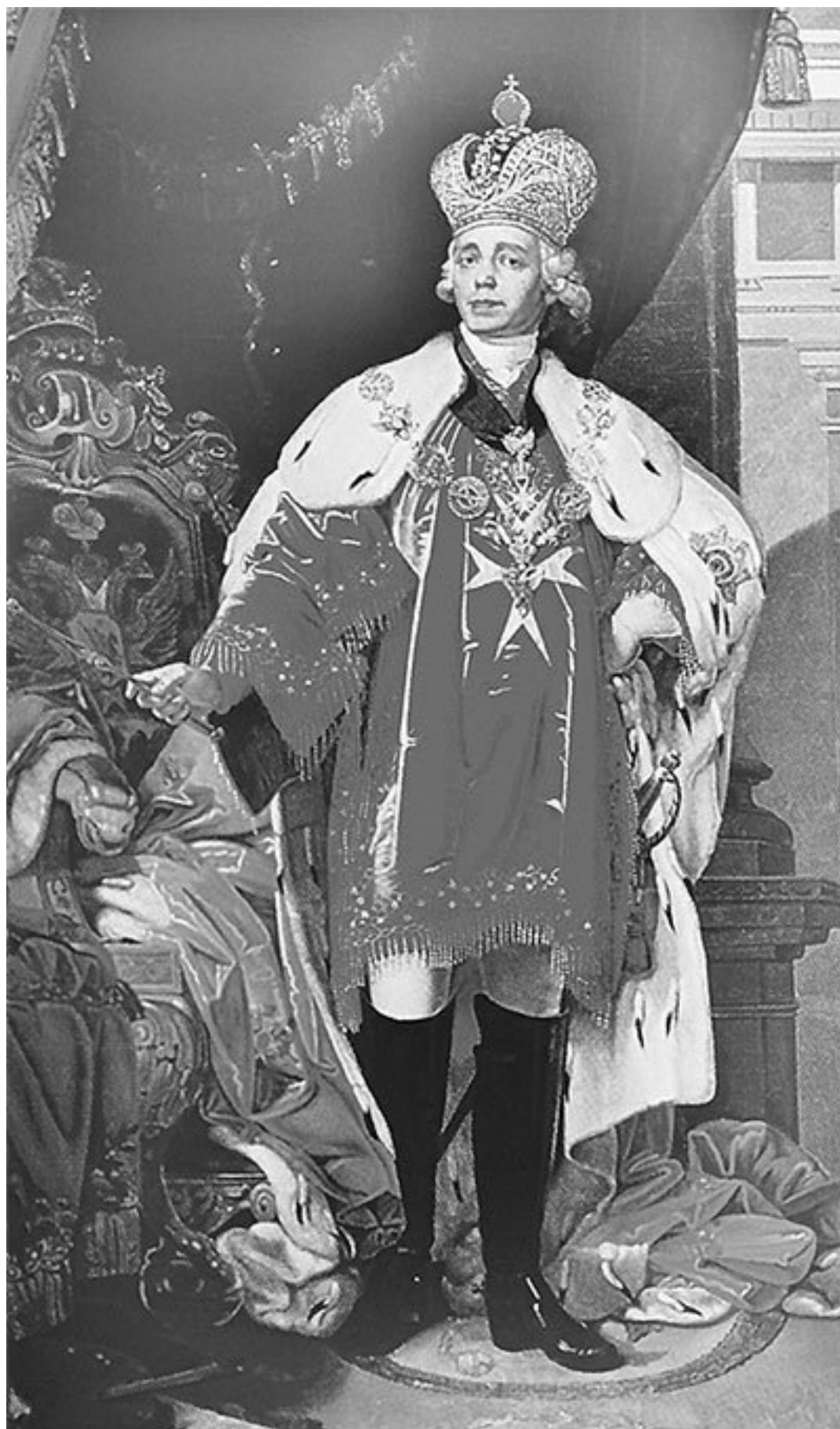
Император Павел I