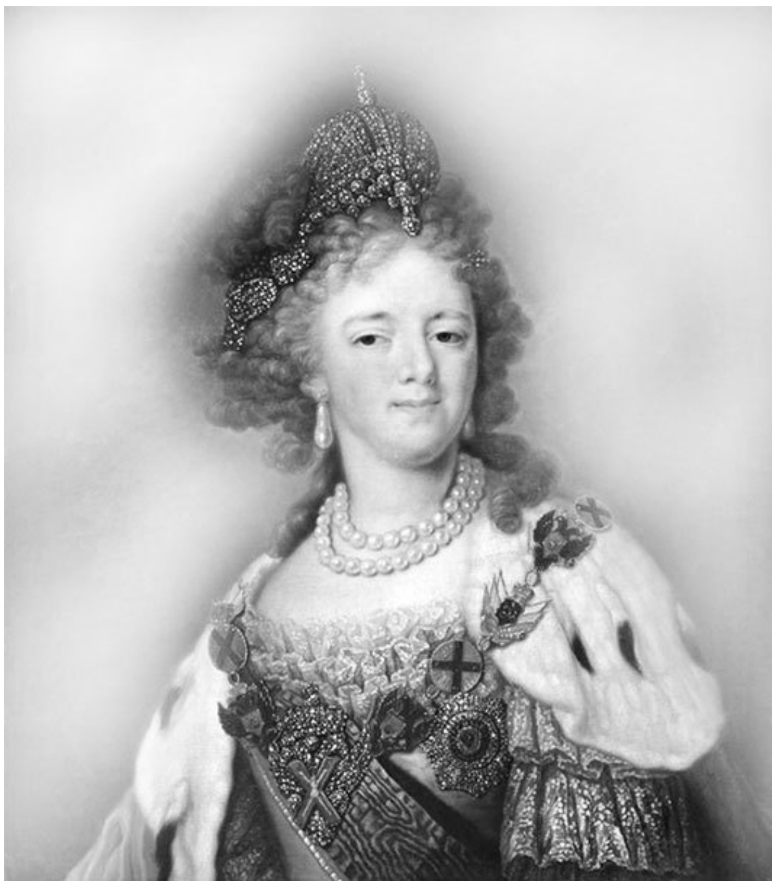
Императрица Мария Федоровна