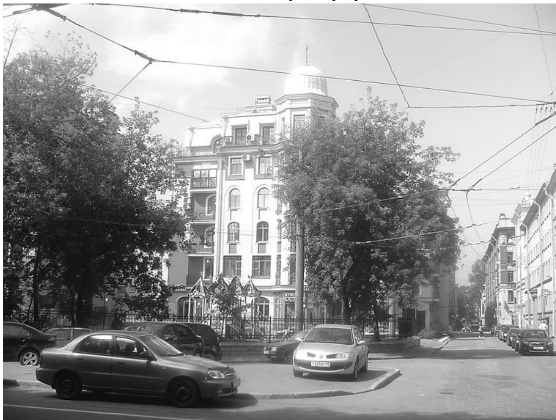
Бармалеева ул., 2

В 1880 г. на участке № 35, на углу Геслеровского переулка, по проекту архитектора И.Н. Иориса осуществлено строительство четырех каменных построек Дома милосердия. Он предназначался «для приучения к труду впавших в порок несовершеннолетних девушек и взрослых, изъявивших желание исправиться». В марте 1895 г. открылся приют для несовершеннолетних, рассчитанный на 50 девочек в возрасте от 10 до 18 лет. В нем было 10 комнат, домовая церковь, прачечная. Воспитанницы приюта получали религиозно-нравственное воспитание. Они стирали белье, готовили пищу, занимались огородничеством, всем тем, чтобы «из них получилась хорошая прислуга или хозяйка в сельском быту». Это был единственный приют в России подобного типа. В 1899 г. в Доме милосердия призрелись 53 девочки и 42 женщины.