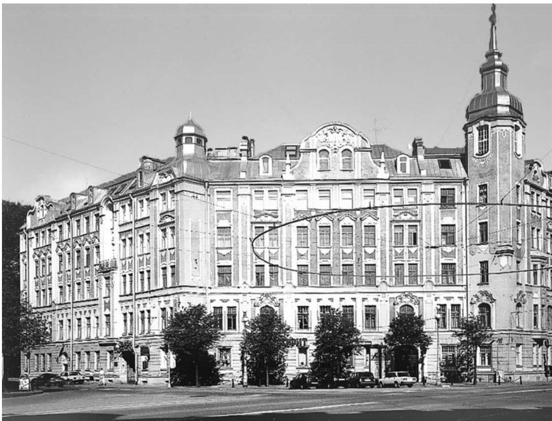
Один из домов на Австрийской площади (Каменноостровский пр., 20)

Первоначально площадь имела дугообразные очертания угловых участков. Планом Петербурга 1880 г. были определены «красные линии» примыкающих зданий, фактически урегулированные в конце 1890-х гг. Тогда же она стала многогранной. Площадь оставалась безымянной.