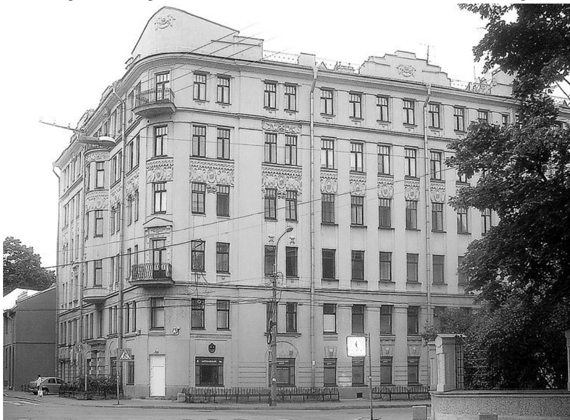
Аптекарский пр., 8

В этом же доме в 1912 г. жил профессор Электротехнического института (1911–1917 гг.) С.П. Тимошенко, специалист в области механики твердых деформируемых сред. Он – автор 35 книг (учебников, монографий мемуаров). С.П. Тимошенко являлся членом многих академий Европы и Америки, иностранным членом АН СССР (1928 г.). С 1962 г. жил в Германии.