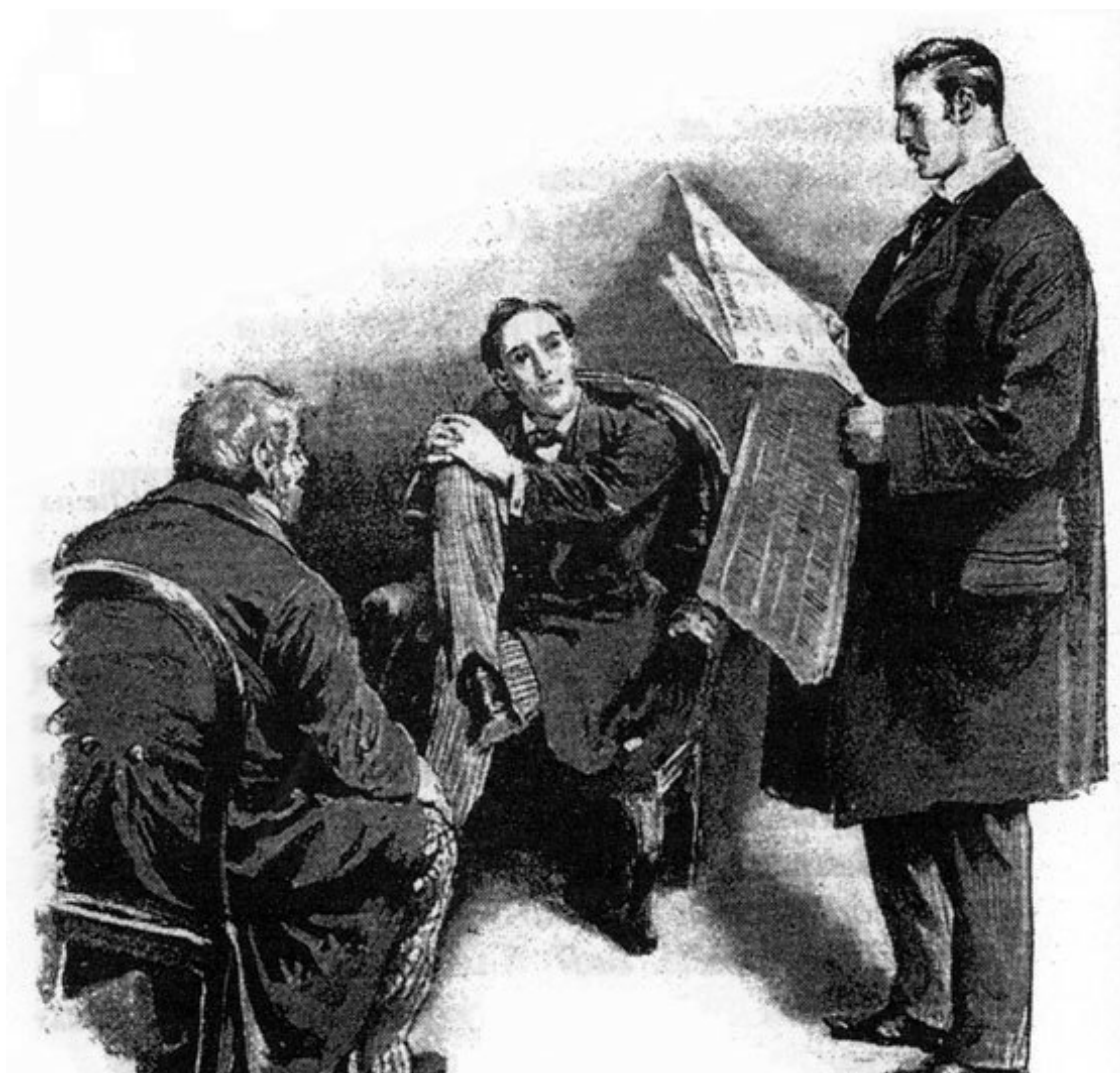
Иллюстрации художника Сидни Пэджета (1860–1908), друга А. К. Дойла, к его рассказам о Шерлоке Холмсе

В 1837 году было около шестидесяти таких коммун, где наблюдались вспышки сверхъестественных сил. Но степень «одержимости» была разной. Как правило, сначала психические силы проявлялись в виде криков, которые были предупреждением об угрозе, затем практически все члены общины попадали во власть этих сил. Вступить в контакт с духами мог каждый – и мужчина, и женщина. Первым делом «непрощенные гости» спрашивали дозволения явиться, а уже потом, когда коммуна не работала, являлись. Интересно, что чаще всего «приходили в гости» духи индейцев – прямо всем племенем. «Прежде всего один индейский вождь или два стучали и спрашивали, можно ли войти. Затем они появлялись в помещении, а за ними – все соплеменники. Дом был полон духами краснокожих, и отовсюду было слышно гиканье». Собственно, гикали сами члены общины шейкеров. Более того, духи индейцев так на них влияли, что присутствующие коммунары начинали не только танцевать традиционные для индейцев танцы, но и общаться друг с другом на каком-то индейском наречии. Все это указывало на одержимость духами аборигенов.