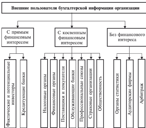
Рис. 1.2. Классификация внешних пользователей бухгалтерской информации организаций

Группу пользователей с прямым финансовым интересом объединяет желание получить сведения, позволяющие определить возможные сроки возврата предоставленных организации займов и инвестиций.