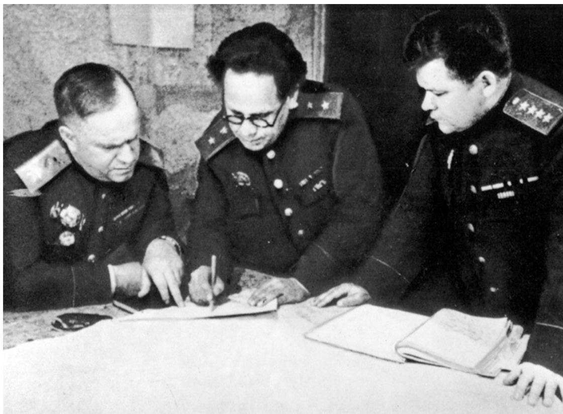
Представитель Ставки ВГК маршал Г.К. Жуков, начальник штаба 1-го Украинского фронта генерал А.Н. Боголюбов и командующий фронтом генерал армии Н.Ф. Ватутин.

План Жукова и Ватутина был достаточно простым, цельным и логичным. Однако в планирование вмешивается Москва (это будет происходить неоднократно). В ночь на 25 февраля 1944 г. директивой Ставки ВГК № 220036 И. В. Сталин и А. И. Антонов приказывают изменить план и обе танковые армии «использовать с фронта главной группировки 60 А с задачей овладения районом Проскурова». Лишившуюся поддержки танковой армии П. С. Рыбалко 1-ю гв. армию предписывалось «усилить танками и самоходными орудиями за счет имеющихся во фронте танковых бригад и самоходных полков». С одной стороны, такое решение выглядит логичным: обе танковые армии направлялись в разрыв фронта в построении ГА «Юг». До этого план предусматривал прорыв обороны немцев силами 1-й гв. армии с вводом в прорыв 3-й гв. ТА на Староконстантинов. С другой стороны, во-первых, план лишился удара по сходящимся направлениям с образованием окружения, а во-вторых, повисало в воздухе наступление 1-й гв. армии. Наступление этой армии превращалось в сковывающий удар, а «котел» у Острополя во взаимодействии с 38-й армией сам по себе становился сомнительным предприятием. Прекращать же план радикально, отменяя уже начавшиеся перегруппировки войск, и в том числе 1-й гвардейской армии, времени уже не оставалось.