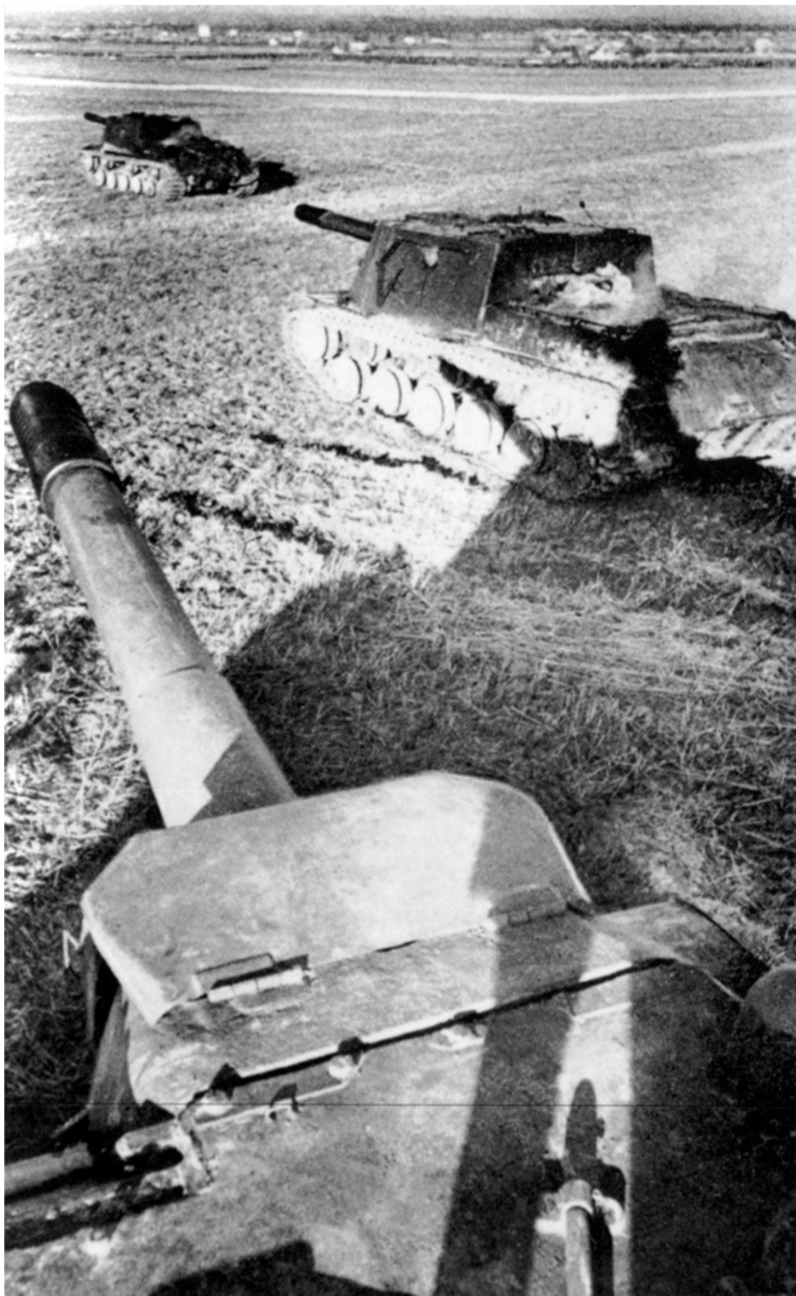
Самоходки СУ-152. Снимок сделан с крыши рубки одной из САУ.