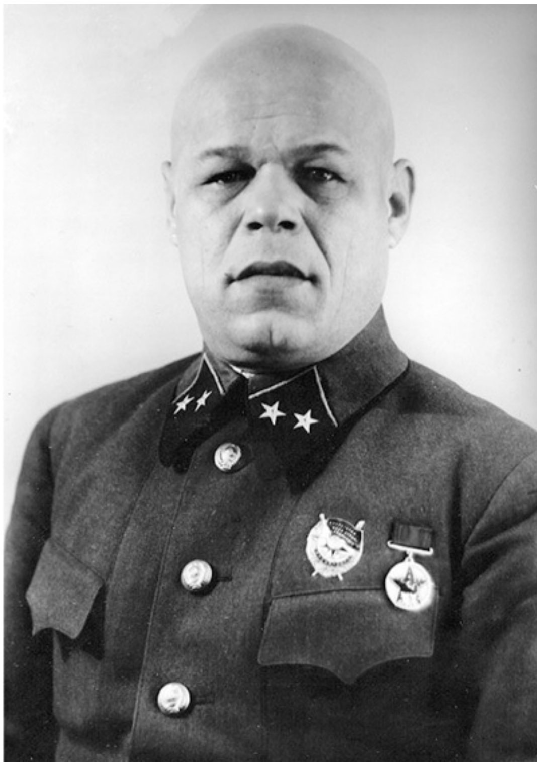
Командующий 3-й гв. танковой армией П.С. Рыбалко.

1-я гвардейская армия к 1 марта 1944 г. также входила в тройку самых многочисленных объединений в составе 1-го Украинского фронта, она насчитывала 112 176 человек 12 . Командовал армией будущий Маршал Советского Союза и министр обороны СССР, член Политбюро ЦК КПСС 40-летний генерал-полковник Андрей Антонович Гречко. Надо отметить, что полковником А. А. Гречко стал только в июле 1941 г. Поэтому его карьеру в Красной армии во