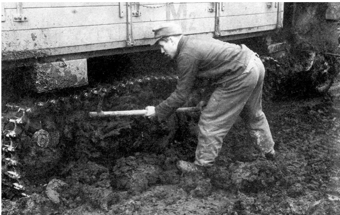
Немецкий солдат с кайлом очищает ходовую часть грузовика «Маультира» от липкого чернозема.

Тем не менее на третий день боев положение советских частей становится стабильным, яростные атаки прекращаются. На 9 марта в Фридриховке из состава 61-й гв. танковой бригады оставалось 6 танков в строю и 100 человек мотострелков. Бригада занимала восточную часть города. В западной части находилась 29-я мотострелковая бригада. Она не только отражала частные атаки противника с запада, но и пыталась сама наступать на Волочиск. 63-й танковой бригаде было доставлено самолетами У-2 горючее, 2 тонны дизтоплива. Однако на тот момент бригаде М. Г. Фомичева противостояли главные силы 7-й танковой дивизии, и пробиться на Подволочиск не удавалось, день 9 марта стоил бригаде 6 танков сгоревшими.