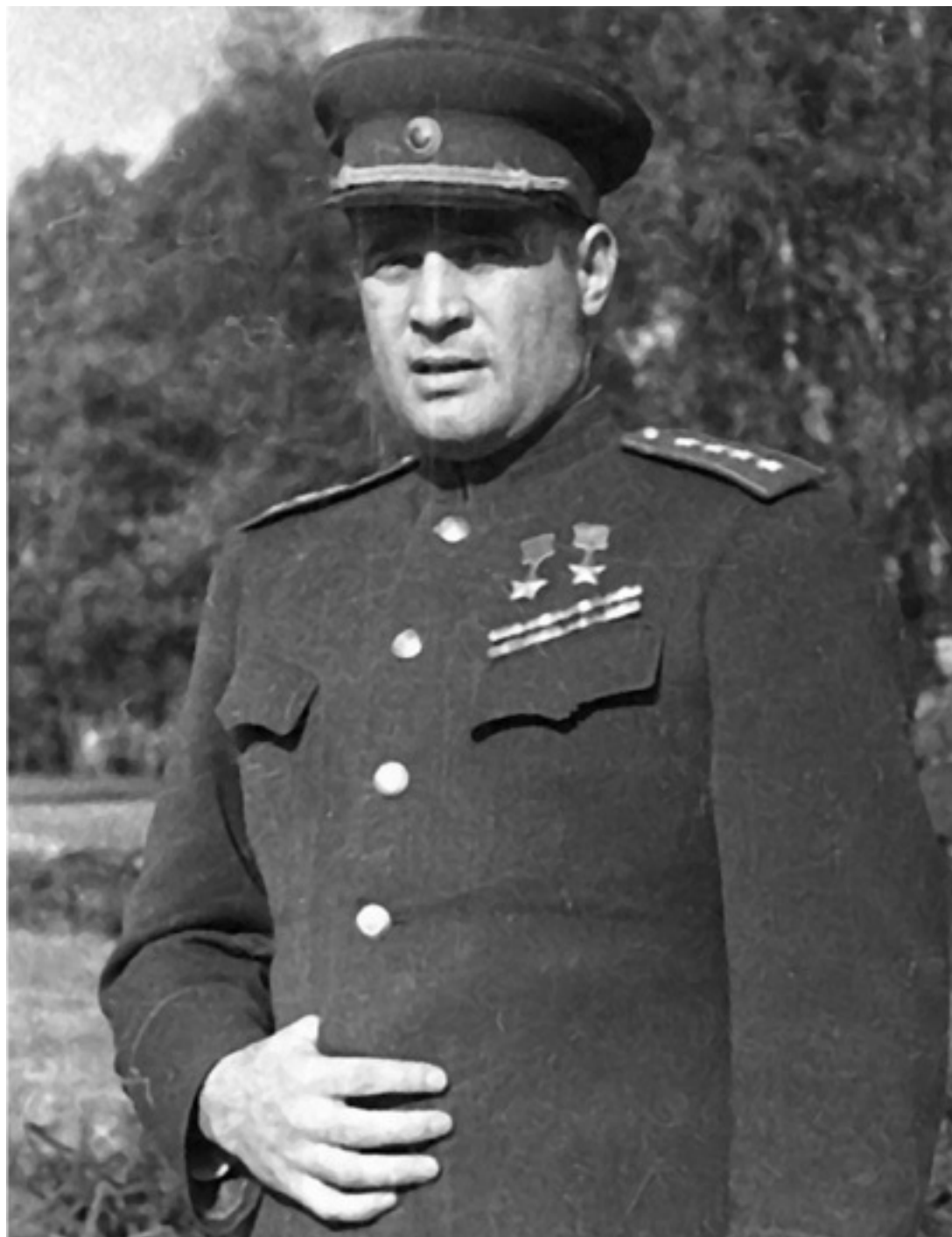
Командующий 60-й армией И.Д. Черняховский. Фото лета 1944 г. на посту командующего 3-м БФ после присвоения звания генерала армии и получения второй Звезды Героя Советского Союза (29.07.1944 г.).