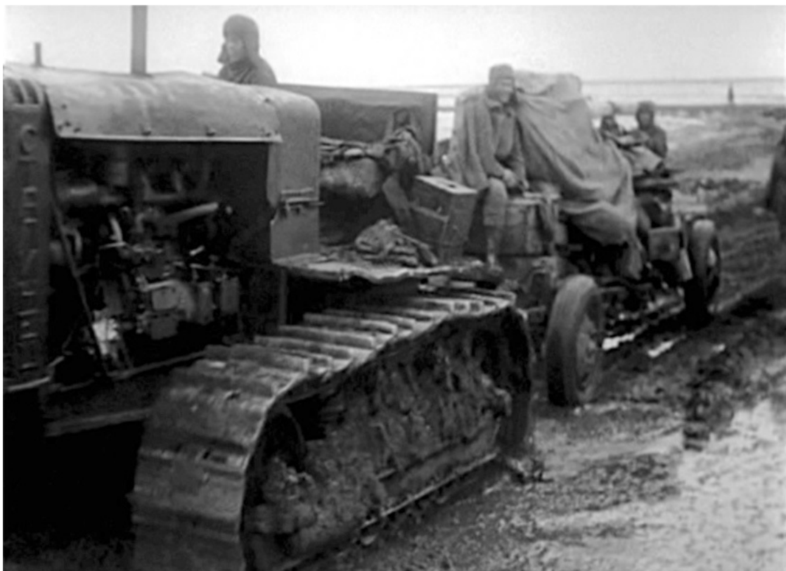
Только гусеничная техника уверенно преодолевала весеннюю грязь. Трактор «Сталинец» С-65 тянет 85-мм зенитную пушку обр. 1939 г.