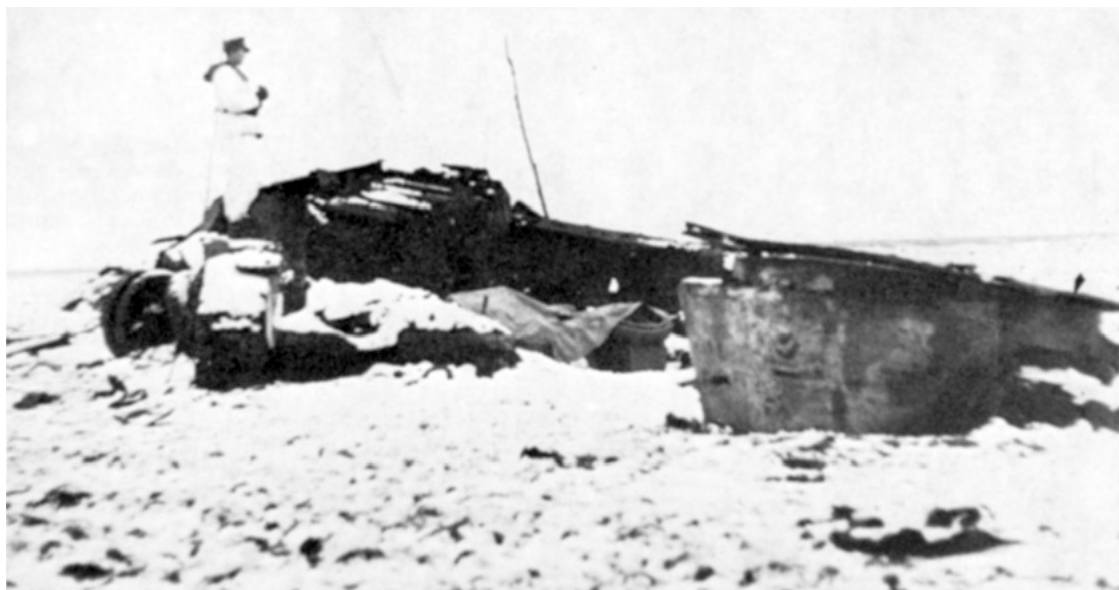
Советский танк Т-34-76, разрушенный внутренним взрывом.

Ранним утром 17 марта пехота 68-й пехотной дивизии перешла в наступление и за несколько часов глубоко вклинилась во фланг 6-го гв. мехкорпуса. Оборонявшийся здесь 507-й стрелковый полк дрогнул и поспешно отступил на Романове Село. Романувка была полуокружена. В этот момент сказали свое веское слово танки. Генерал А. И. Акимов по радио приказывает 28-му танковому полку (5 танков) и 56-му танковому полку (10 танков) контратаковать противника с флангов. Увидев на поле боя танки, немецкие пехотинцы начали отступать, но было уже поздно, вырвавшиеся вперед подразделения попали в стальное кольцо. Уже к 11.00 все было кончено. Потери 68-й пехотной дивизии, и в частности ее 188-го полка, оценивались в очередном донесении как «тяжелейшие». За время с начала контрнаступления в 188-м полку 68-й дивизии численность боевых подразделений 86 сократилась с 1302 до 277 человек, в 196-м полку – с 1285 до 887 человек, в 169-м полку – с 1155 до 537 человек, в саперном батальоне с 444 до 284 человек 87 . По советским данным, танки огнем и гусеницами в бою 17 марта уничтожили около 1500 человек, что представляется близким к истине. Как утверждалось в вечернем донесении XXXXVIII корпуса, пехотинцами было уничтожено 10 танков «Офенрорами» 88 . Однако по советским данным, ни одного танка в этом бою потеряно не было, а вот четыре «Офенрора» взяли в качестве трофеев.