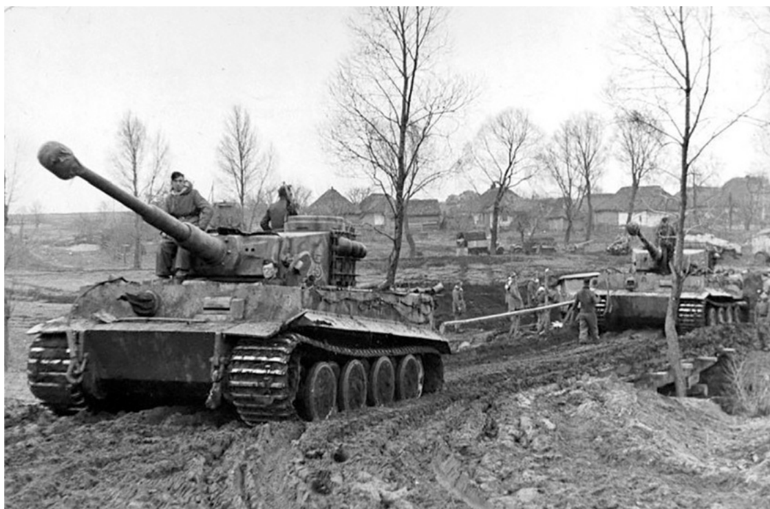
«Тигры» 1-й танковой дивизии СС «Лейбштандарт Адольф Гитлер» на марше.

В конце февраля 1944 г. самым сильным объединением советских вооруженных сил на правобережной Украине являлся 1-й Украинский фронт Н. Ф. Ватутина, и он же занимал самый протяженный 760-километровый фронт. Для проведения весеннего наступления советским верховным командованием была произведена перебалансировка сил, в том числе с передачей части войск и полосы на север, 2-му Белорусскому фронту. В результате 1-й Украинский фронт к началу марта сохранил лидерство по численности войск и вооружению, но получил более узкую полосу (см. таблицу).