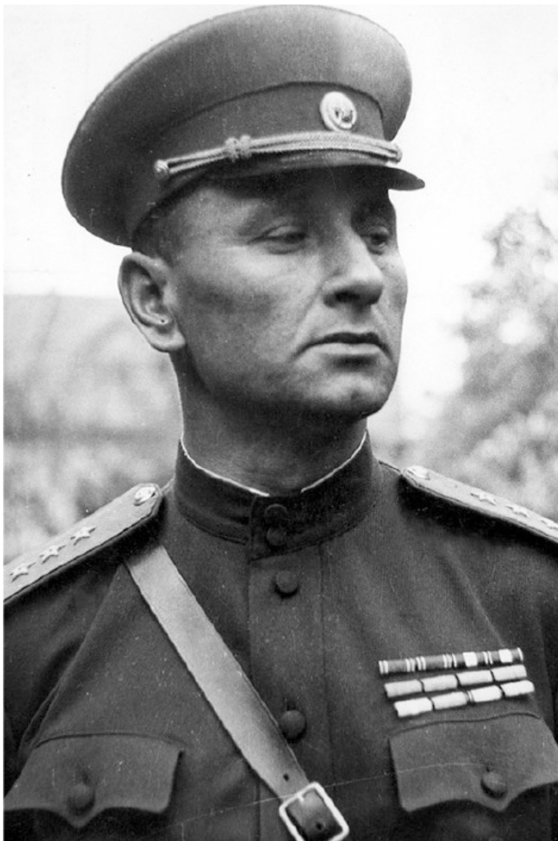
Командующий 1-й гв. армией генерал-полковник А. А. Гречко. Весной 1944 г. будущему маршалу и брежневскому министру обороны СССР было всего 40 лет.