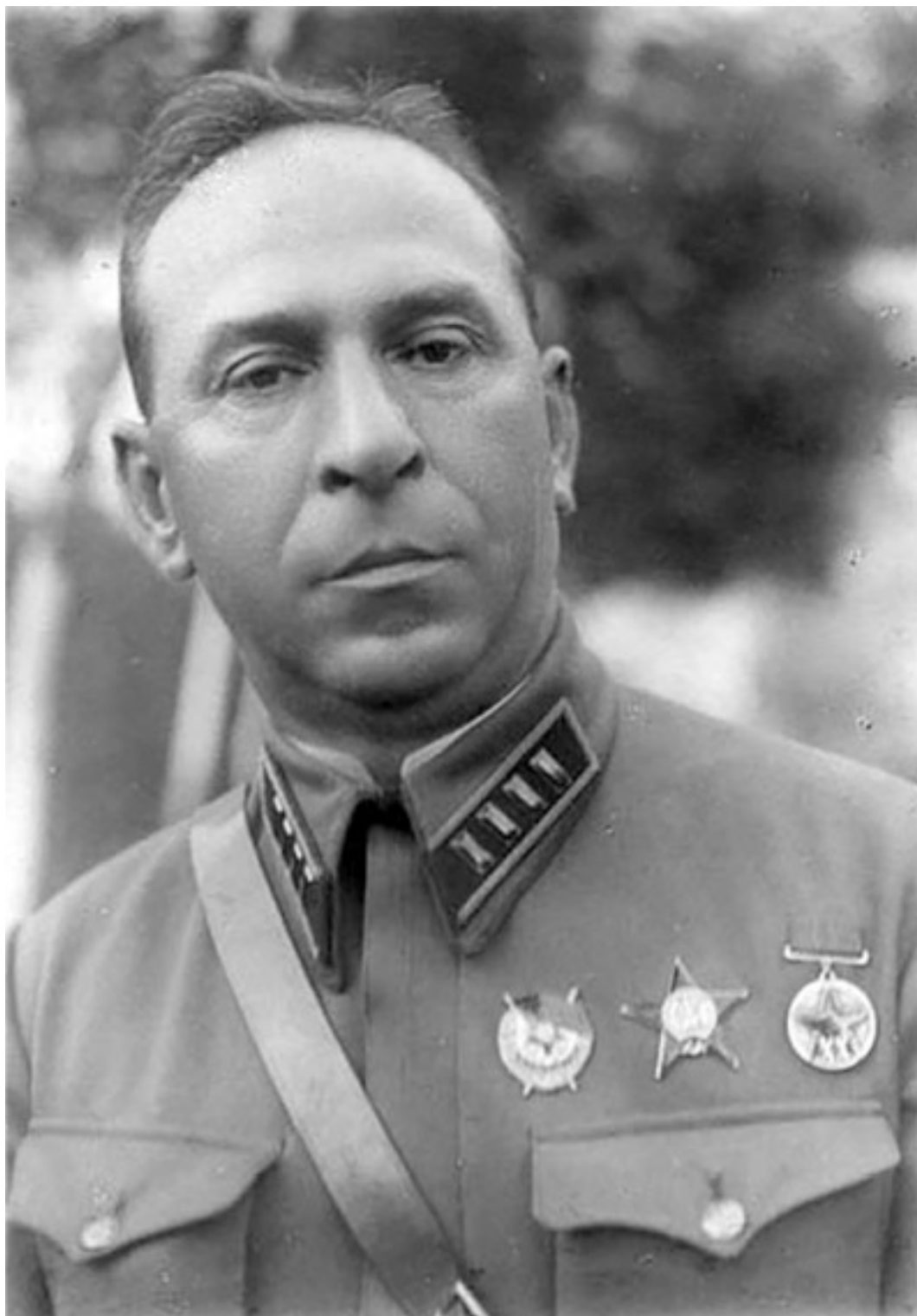
Г.С. Родин, командир 10-го гв. танкового корпуса. Фотография 1942 г., после награждения орденом Красного Знамени за бои 1941 г. в качестве командира 47-й тд 18-го МК.

Размытые дороги одинаково влияли на противников по обе стороны фронта. Марш «Лейбштандарта» проходил в тяжелых условиях, однако уже в 3.00 ночи 5 марта дивизия вышла в район Купели, в нескольких километрах к югу от Базалии. Нужно отметить, что германские подвижные соединения использовали в качестве средств тяги артиллерии полугусеничные тягачи, что давало им некоторое преимущество в трудных дорожных условиях. Дорога удовлетворительного качества закончилась в нескольких километрах к северу от Купели,