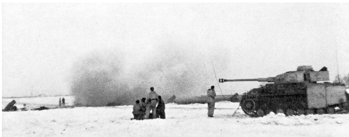
Перед атакой. Экипаж Pz.IV наблюдает за стрельбой «скрипух», шестиствольных реактивных минометов.

Удар по плацдарму был перенесен на 4 марта. К наступлению привлекались боевая группа «Дас Райха» и 6-я танковая дивизия в полном составе. Последней поручалось нанесение главного удара, сначала предполагалось прорываться к переправам у Гулевиц и Синюток, а затем ударом вдоль реки на Дворец и Михнов отрезать и уничтожить советские части на плацдарме. По первоначальному плану 4-му мотополку 6-й дивизии придавался 509-й батальон «Тигров» и рота «Хорниссе». Однако по какой-то причине использование «Тигров» в намеченном наступлении оказалось отменено. В итоге для поддержки запланированной атаки оставались примерно два десятка боеготовых Pz. IV 6-й танковой дивизии и рота «Хорниссе». В отсутствие тарана из «Тигров» контрудар по усиленному советскими танками плацдарму нельзя назвать иначе как самоубийственным. Однако события развивались по кошмарному сценарию, который офицеры 6-й танковой дивизии вряд ли могли себе даже вообразить.