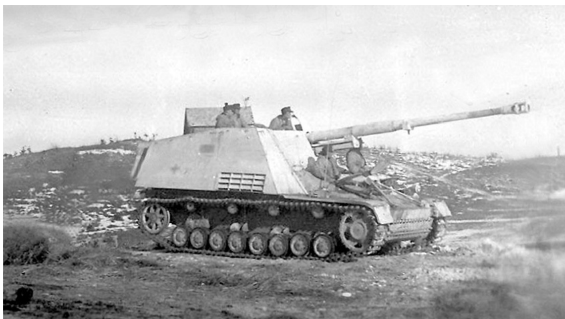
Немецкая САУ «Хорниссе» на марше.

В целом же ситуация для обеих сторон оставалась патовой. Попытка 6-го гв. мехкорпуса подразделениями 16-й мехбригады с двумя танковыми полками развить наступление на юг успеха также не имела. У Лозовы и Гарнышевки атакующие были встречены огнем «Тигров». У эсэсовцев-хлебопеклов пытались изъять «Тигры» 7 марта для атаки на Фридриховку, но штаб «Лейбштандарта» выхлопотал у Балька сохранение 5 «Тигров» на участке группы Гратца. Это позволило группе удержать позиции 8 марта.