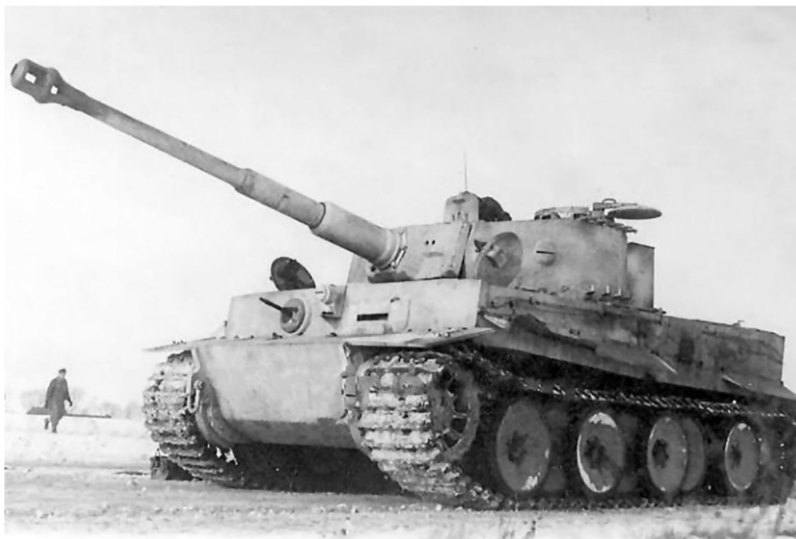
Немецкий тяжелый танк «Тигр». Машина с новой командирской башенкой с низким силуэтом.

командованием было запланировано продолжение успешной зимней кампании 1943/1944 г. Следует подчеркнуть, советское верховное командование задумало весеннее наступление на всем огромном пространстве от Полесья до Днепра в районе Никополя в южном секторе советско-германского фронта. Наступательные задачи получили 1-й, 2-й и 3-й Украинские фронты. Впоследствии эти наступления получили наименования Проскуровско-Черновицкой, Уманско-Ботошанской и Брезнеговато-Снегиревской операций. Тогда было трудно предполагать, что задуманные на период распутицы операции станут одними из самых крупных и результативных наступлений Красной армии в истории всей войны.