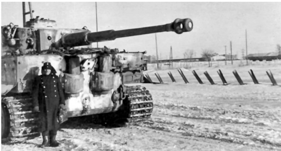
Еще одно фото того же танка. Справа надолбы неизвестного происхождения.

Одним словом, остановка наступления 9-го мехкорпуса под Базалией имеет вполне объективные причины – выдвижение противником дееспособных резервов на рубеж р. Случь. Собственно ввиду присутствия частей советского механизированного корпуса на другом берегу р. Случь «Лейбштандарт» не перешел в запланированное наступление на Теофиполь. То есть немецкий план контрудара по существу оказался сорван.