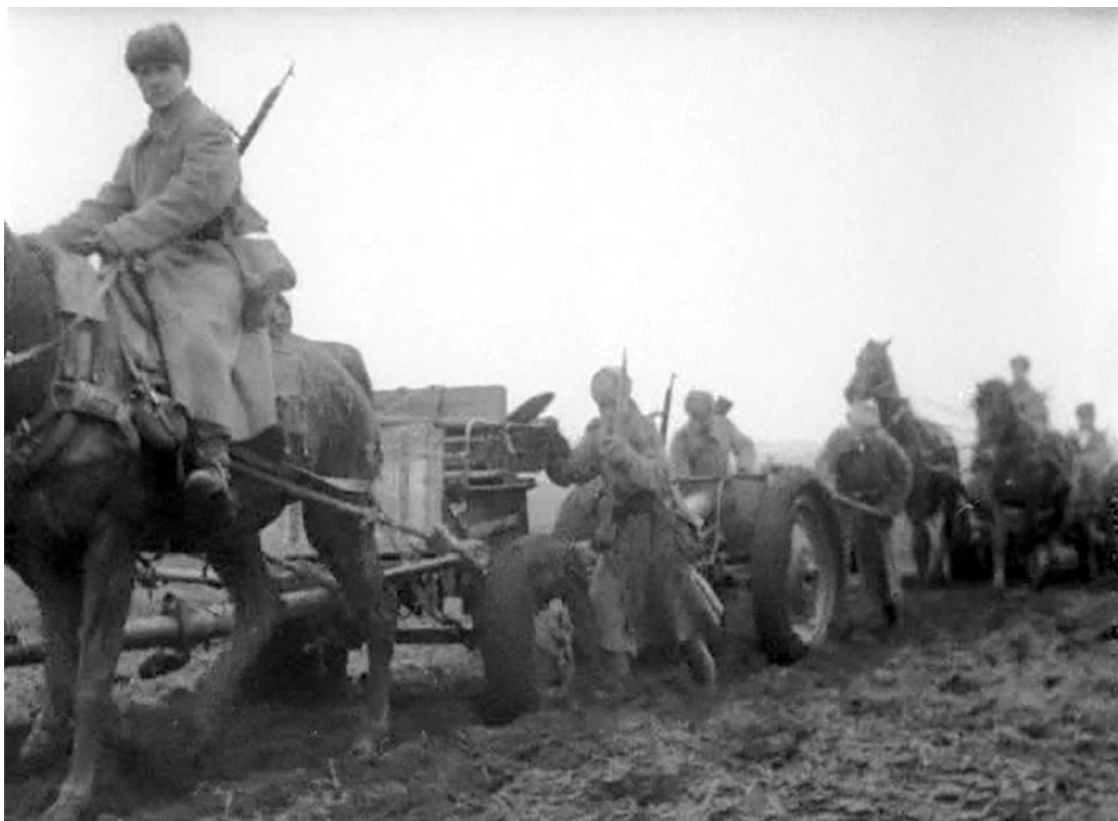
Батарея 76-мм полковых пушек обр. 1927 г. на гужевой тяге на марше по раскисшей дороге. Полковые пушки получили у бойцов прозвище «бобики».

Однако нельзя сказать, что нахождение под огнем вполне реальных, а не бумажных «Тигров» было по достоинству оценено командованием. Оборона Фридриховки является хорошим примером захвата и удержания важного пункта в глубине обороны противника, часто в окружении или частичной изоляции. Это было типичной задачей для танковых соединений сторон в ходе Второй мировой войны. Свердловская 61-я гв. танковая и 29-я гв. мотострелковая бригады справились с ней вполне достойно.