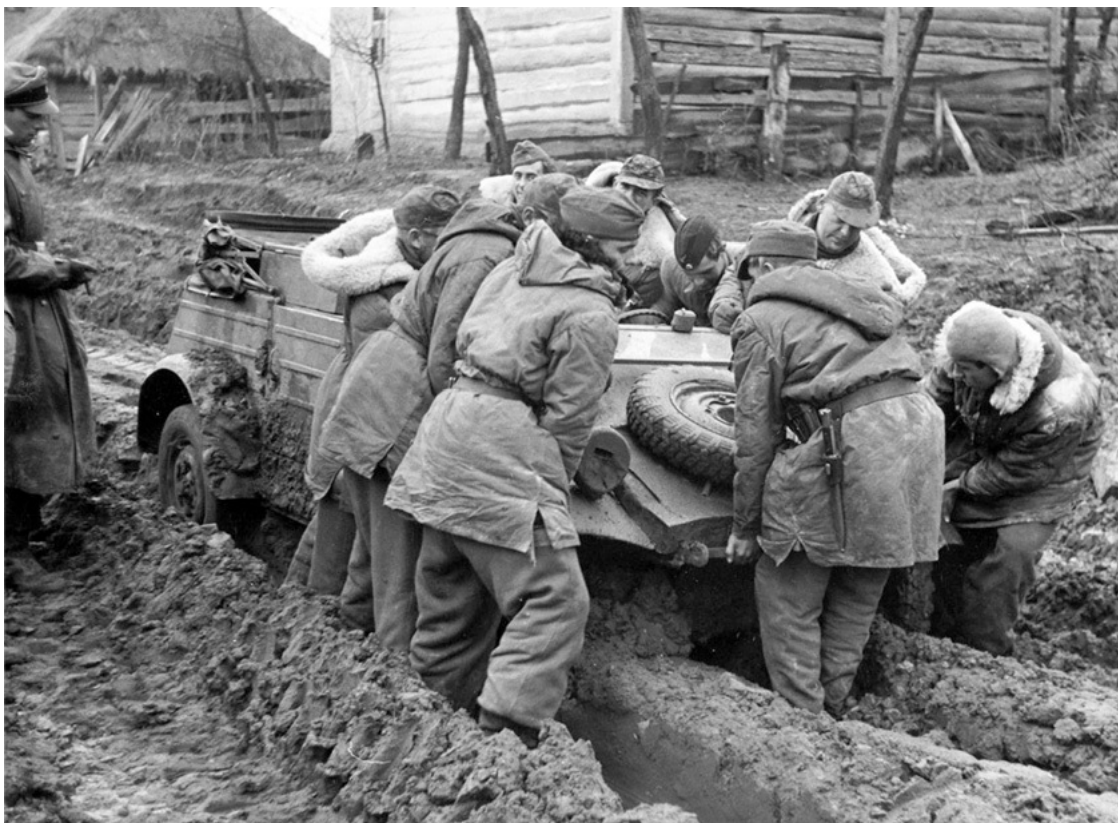
Солдаты дивизии СС «Лейбштандарт» буквально на руках тащат по грязи легкой «Кубельваген».

Тем не менее продолжение сражения с двумя немецкими подвижными соединениями считалось в штабе фронта бесперспективным. Вечером 13 марта штаб Д. Д. Лелюшенко полностью переориентировался на новое наступление. В шифровке № 605, полученной от Военного совета фронта, указывалось: «Исходное положение для наступления занять 18.3 в районе Скалат, Гжимайлув, Иванувка, откуда перейти в наступление в общем направлении на Гусятин, Каменец-Подольск» 79 .