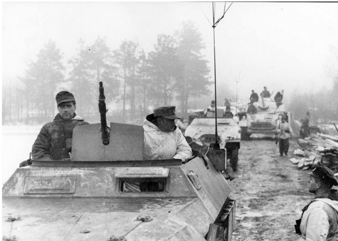
Колонна 16-й тд на марше. На переднем плане БТР SdKfz 251.

Как мы видим, общая численность соединений вермахта даже после кровопролитной зимней кампании 1943/1944 гг. оставалась достаточно высокой. Пехотные дивизии были несравненно более многочисленными, нежели стрелковые дивизии Красной армии. Из числа танковых дивизий только боевая группа «Дас Райха» имела сравнительно небольшую численность, но это объяснялось частичным выводом дивизии на переформирование на запад.