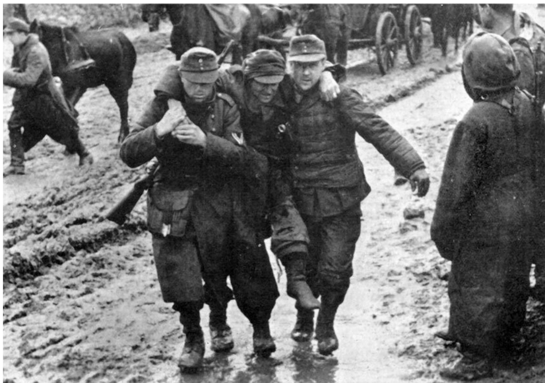
Немецкие солдаты тащат раненного в ногу товарища в тыл.

безвозвратные потери разрушены и 5 сожжены 68 . Из 9 самоходных установок 356 САП, разбитых в бою в этом же р-не, 6 разрушено, а 3 сгорело 69 . Бой в условиях угрозы разрушения боевой машины вести было просто тяжело психологически.