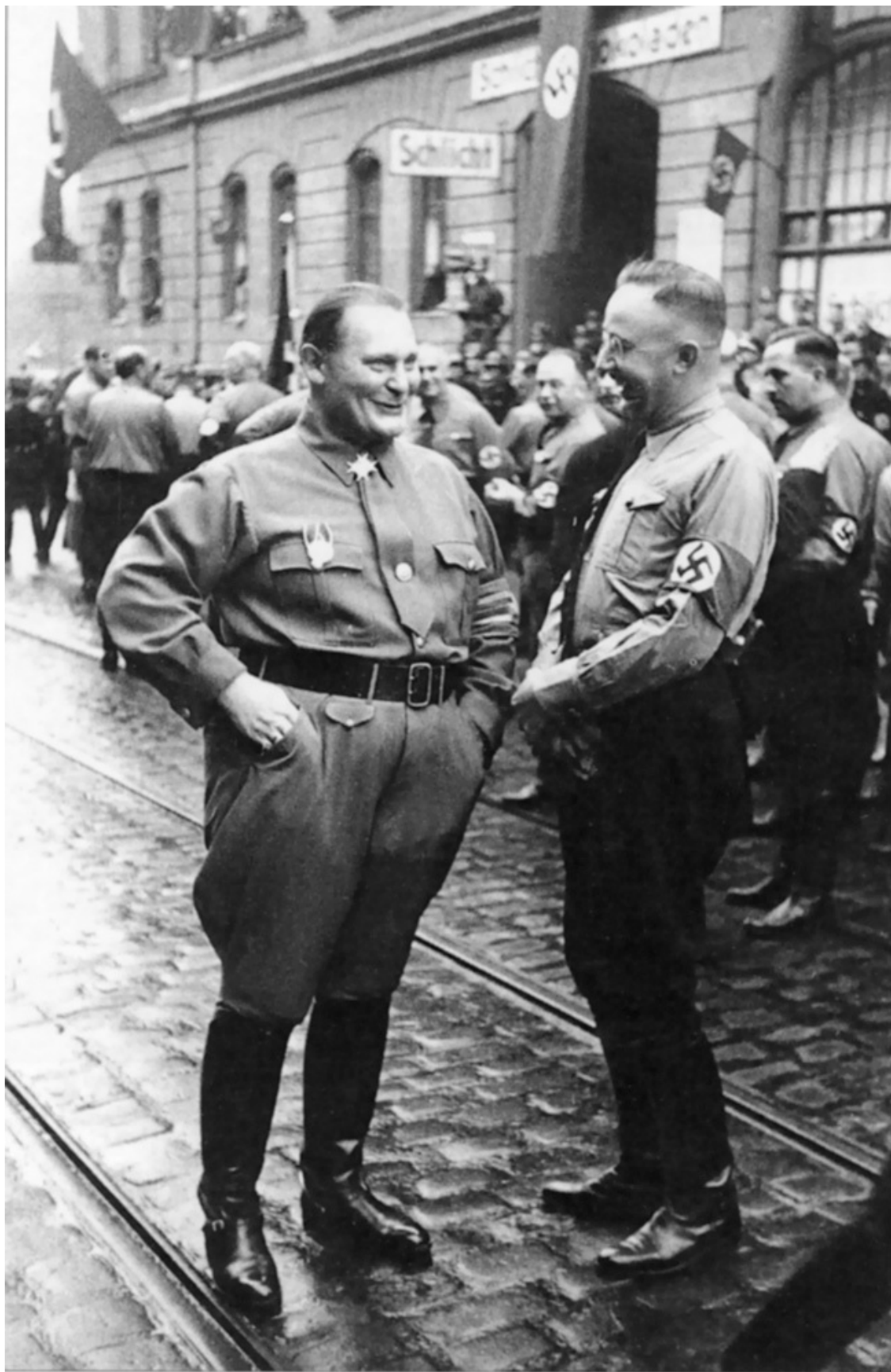
Организаторы геноцида европейских евреев Герман Геринг и Генрих Гиммлер. Мюнхен, 9 ноября 1937 года