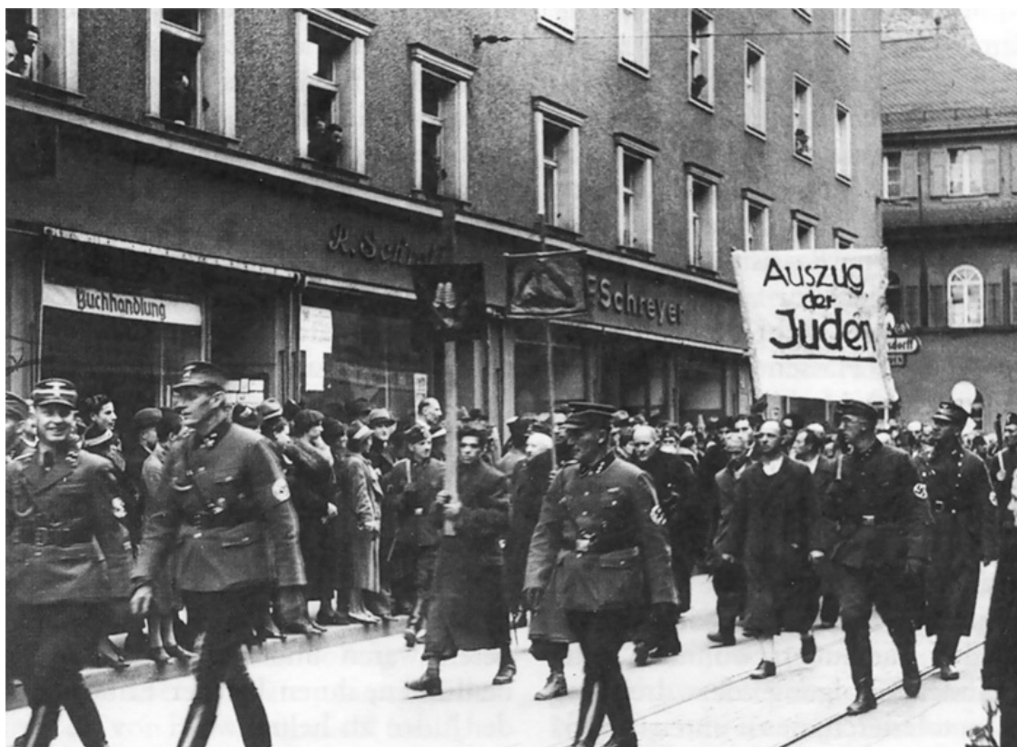
Депортация мужчин-евреев из Регенсбурга в концлагерь Дахау, 1938

Почти теми же словами реакцию на события 9–10 ноября 1938 года описывает Дениц в своих мемуарах, увидевших свет в 1958 году, через год после публикации воспоминаний Редера: «Мы, офицеры, безоговорочно отвергали бесчинства против евреев, которые позднее достигли апогея во время Хрустальной ночи. Утром после 9 ноября 1938 года я поехал к своему начальнику командующему флотом адмиралу Бему и сообщил ему, что такого рода происшествия должны вызывать порицание порядочных офицеров. Я предложил ему передать это главнокомандующему ВМФ, чтобы он был уверен в поддержке с тыла, если он будет высказываться против этих бесчинств перед руководителями государства. Я предполагал, что он поступит именно так. Я разговаривал с командующим флотом как капитан 1-го ранга и одновременно как руководитель подводного флота от имени своих офицеров. Командир торпедных катеров капитан 1-го ранга Лютьенс, который позднее, будучи командующим флотом, погиб на «Бисмарке», предпринял такой же шаг. Только теперь из воспоминаний гроссадмирала Редера я узнал, что командующий флотом действительно сообщил о наших протестах главному ВМФ» 74 .