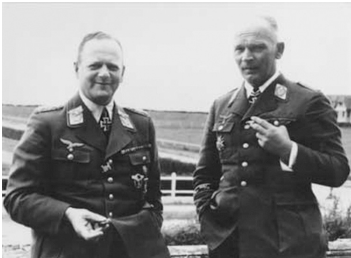
Один из создателей люфтваффе генерал-фельдмаршал Эрхард Мильх, еврей по отцу, и генерал авиации Вольфрам фон Рихтгофен

Пассивность высших военных руководителей, немногих из тех, кто обладал в стране реальной силой, по отношению к судьбе полумиллиона немецких евреев развязывала Гитлеру руки для ужесточения их социальной и экономической дискриминации, апогеем которой стала Имперская хрустальная ночь – еврейский погром в ночь с 9 на 10 ноября 1938 года. После него ОКВ достигла критика в адрес еврейских чисток. Военно-экономическая инспекция XVII военного округа (Вена) сообщала, что очень большое число австрийцев не согласно с методами «удаления евреев». Хотя они не чувствовали особого сострадания «к этому еврею» и хотели лучше избавиться от него сегодня, чем завтра, все же «сожжение святыниц и избиение евреев было для них совершенно непонятным» 72 .