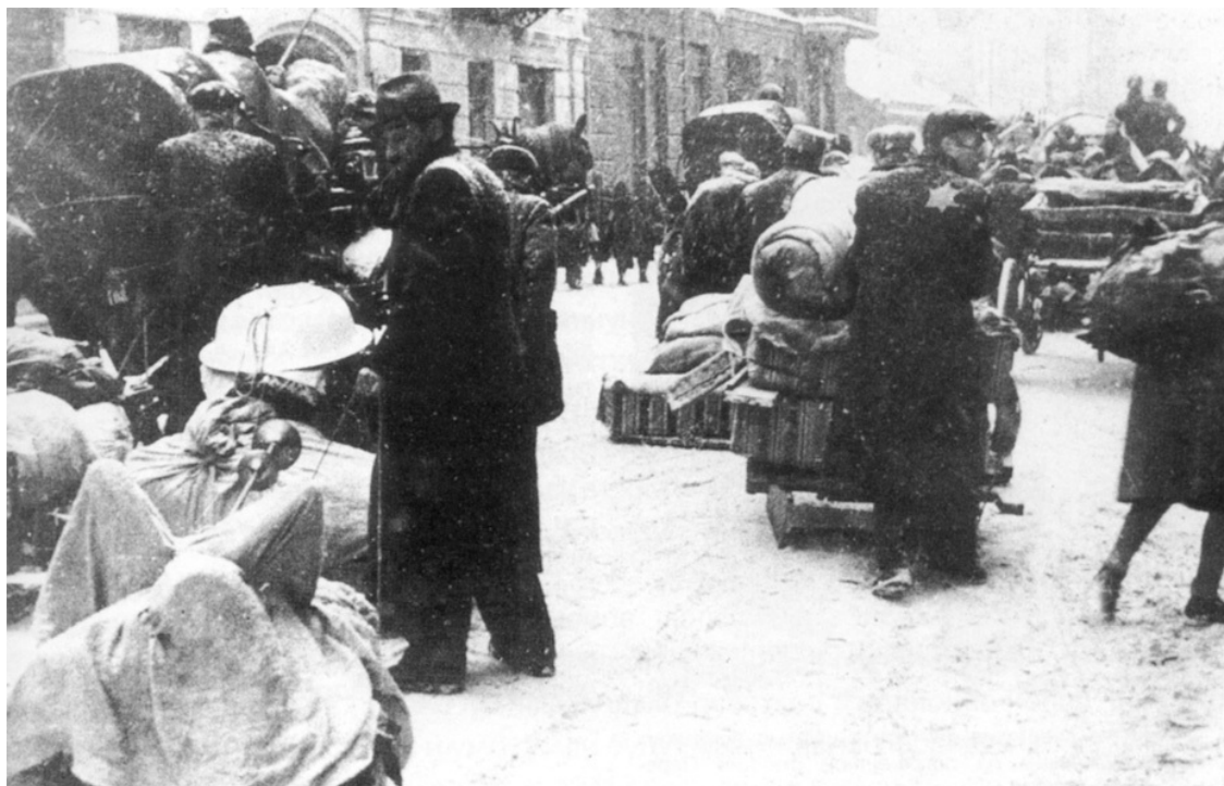
Насильственное переселение евреев Лодзи в городское гетто. Март 1940 года

Необходимо упомянуть, что преступления гитлеровцев против евреев в Польше не одобрялись и некоторыми офицерами среднего и низшего звена. Будучи не в силах что-либо изменить, они доверяли свое возмущение дневникам и частной корреспонденции. Среди подобных документов той эпохи хрестоматийным стало письмо будущего участника антигитлеровского заговора подполковника Гельмута Штифа, побывавшего в Варшаве в ноябре 1939 года: «Самая буйная фантазия пропаганды бедна по сравнению с вещами, которые там совершают организованные банды убийц, разбойников и мародеров будто бы при попустительстве военных инстанций. Здесь нельзя больше говорить о «справедливом возмущении преступлениями, совершенными в отношении фольксдойче». Это искоренение целых семей вместе с женщинами и детьми может совершать только ублюдок, который больше не достоин называться немцем. Мне стыдно быть немцем! Это меньшинство, которое оскверняет имя немца убийствами, грабежами и побоями, накличет беду на весь немецкий народ, если мы скоро не положим этому конец. Ведь такие вещи... вызовут мстительную Немезиду» 109 .