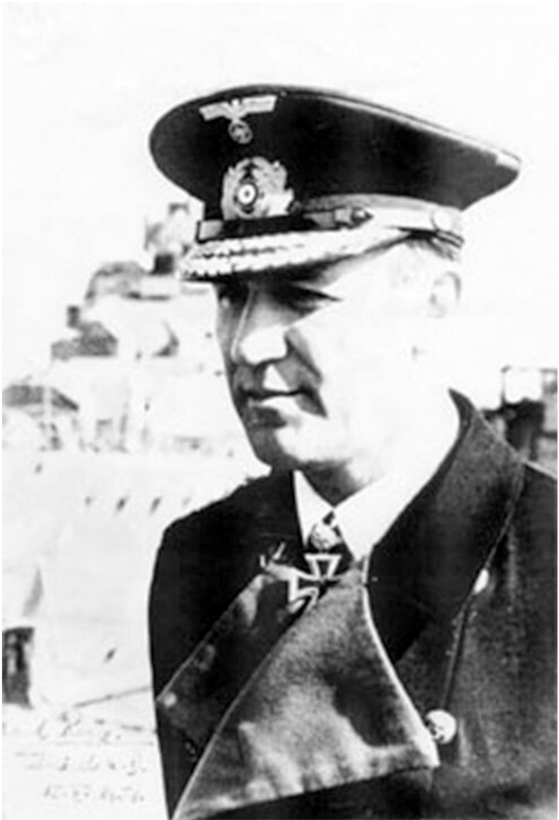
Вице-адмирал Кригсмарине Бернхард Рогге, еврей на четверть

Учитывая расовое законодательство вермахта 1934-1936 гг., нельзя согласиться с утверждением английского историка Джона Уиллер-Беннета о том, что расовые законы Третьего рейха применялись в сухопутных войсках «так мягко и в столь немногих исключительных слу-