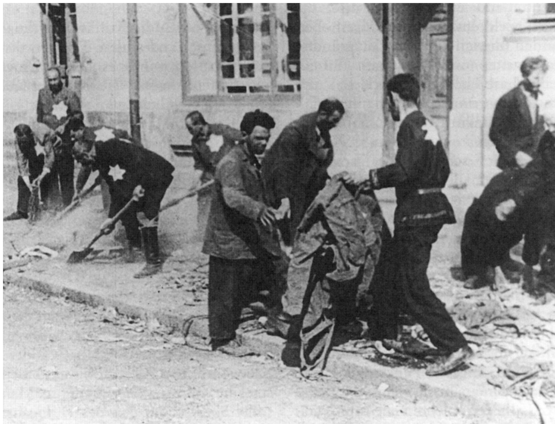
Евреи на принудительных работах неподалеку от Освенцима (Аушвица), 1941 год