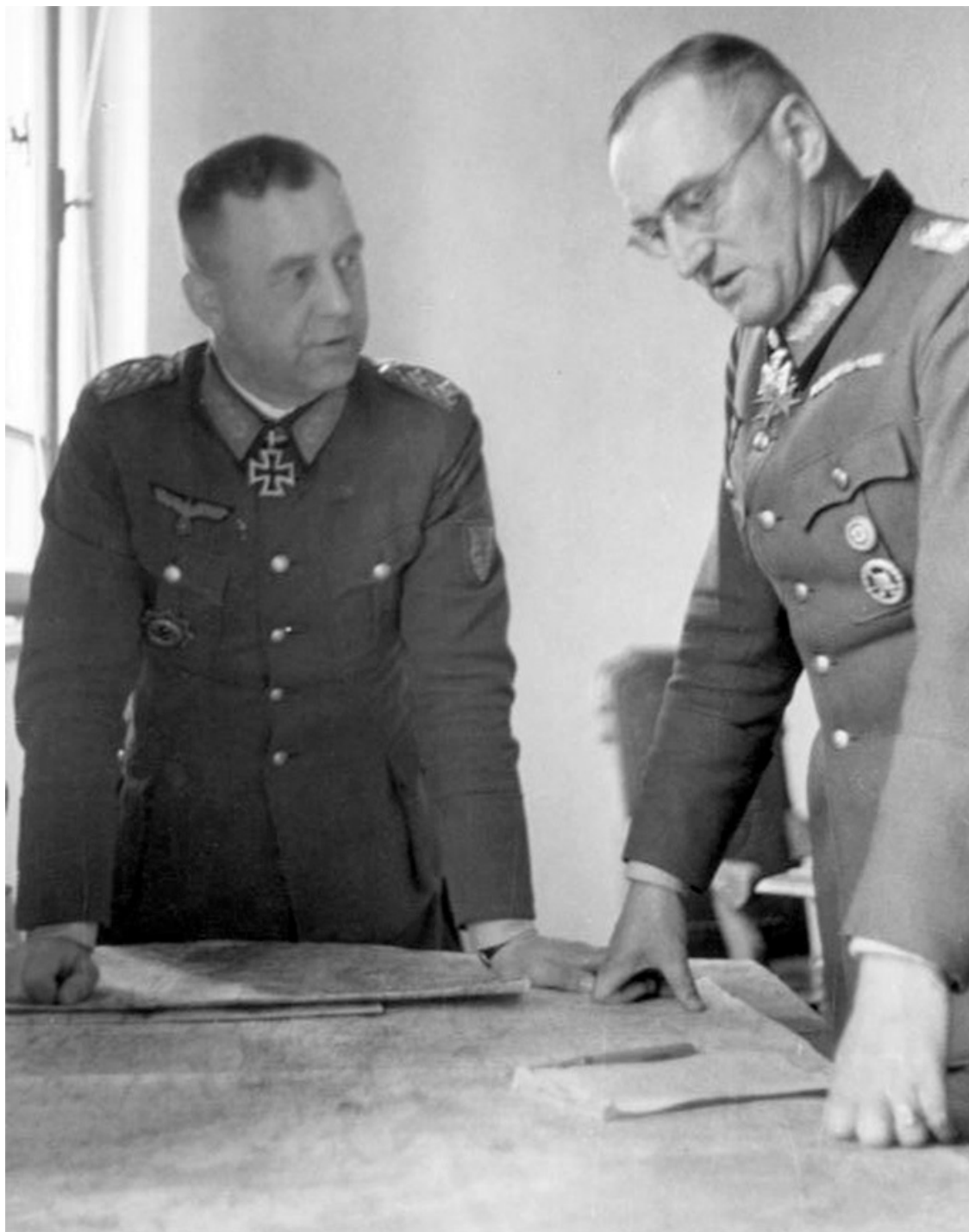
Командующий тыловым районом группы армий «Юг» генерал пехоты Эрих Фридрици

Уже в первой декаде июля 1941 года были образованы тыловые районы групп армий «Север», «Центр» и «Юг» под командованием генералов пехоты Франца фон Рока, Макса фон Шенкендорфа и Карла фон Рока (с октября 1942 года – генерала пехоты Эриха Фридрици). Подконтрольные этим генералам территории менялись в зависимости от перемещения фронтов. Так, штаб-квартира тылового района группы армий «Центр» перемещалась вслед за германскими войсками от Могилева до Смоленска, а сам район в течение войны охватывал Прибалтику, Белоруссию, часть РСФСР. Тыловой район группы армий «Юг» в разное время