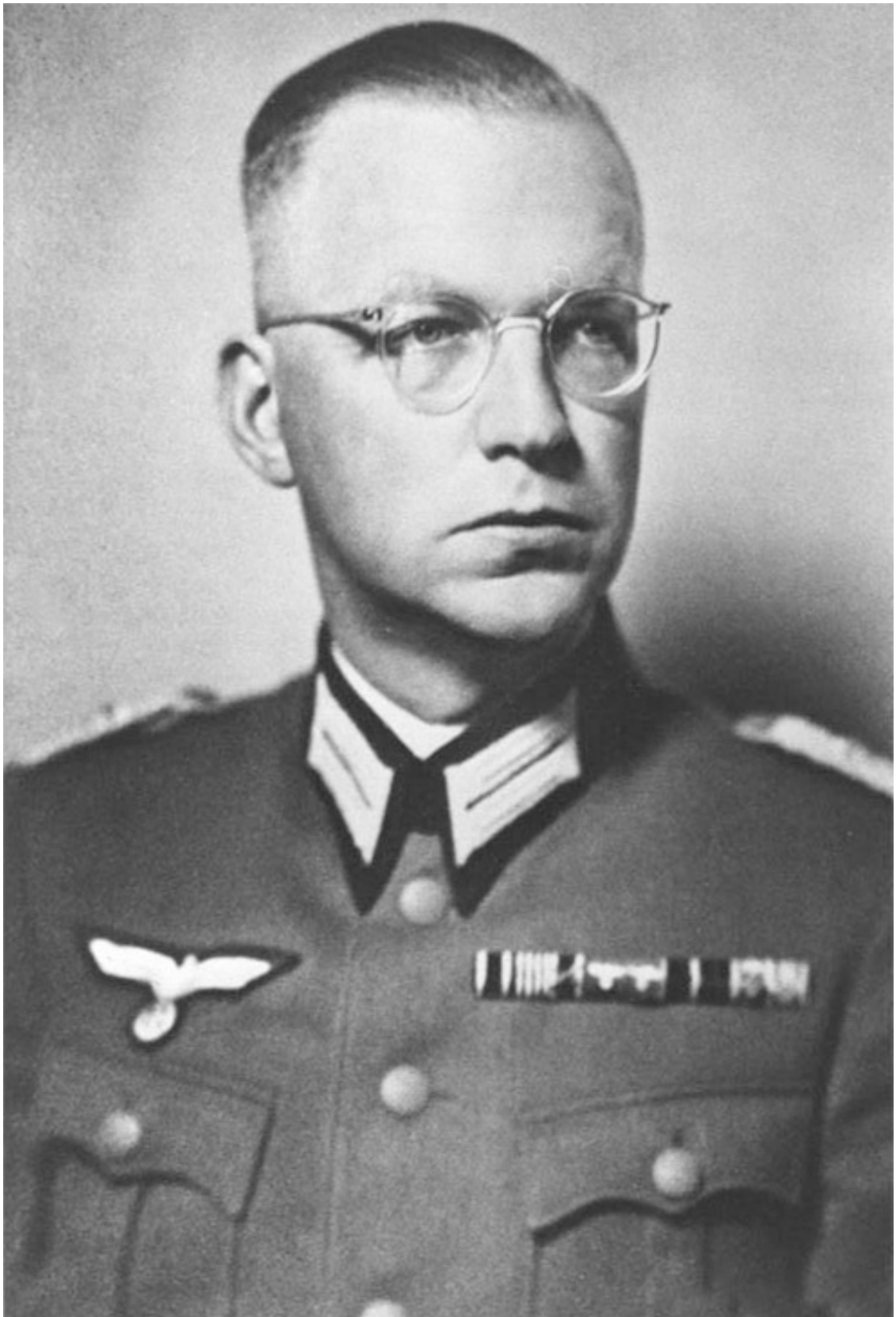
Подполковник Гельмут Гроскурт в 1941 году

Обнаружение останков людей, убитых НКВД, послужило поводом к погрому в городе Золочеве Львовской области 2–3 июля 1941 года. Здесь солдаты дивизии СС «Викинг» и местные коллаборационисты заставили евреев раскапывать могилы на территории крепости