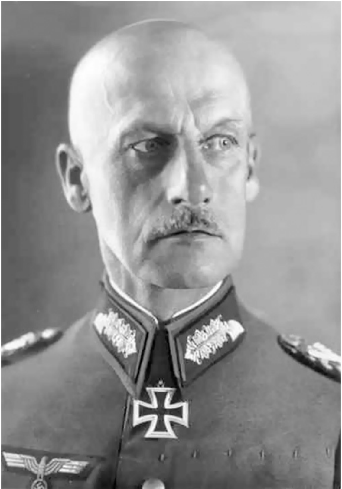
Командующий группой армий «Север» генерал-фельдмаршал Вильгельм фон Лееб

Солдат 16-й армии вспоминал, что в тот день немецкие военнослужащие толпились на одной из площадей Ковно, чтобы увидеть и сфотографировать «проявления народного гнева». Литовцы распространяли о евреях невероятные слухи: один еврейский комиссар якобы на глазах связанного супруга изнасиловал его жену, потом убил ее, вырезал сердце, зажарил на ско-