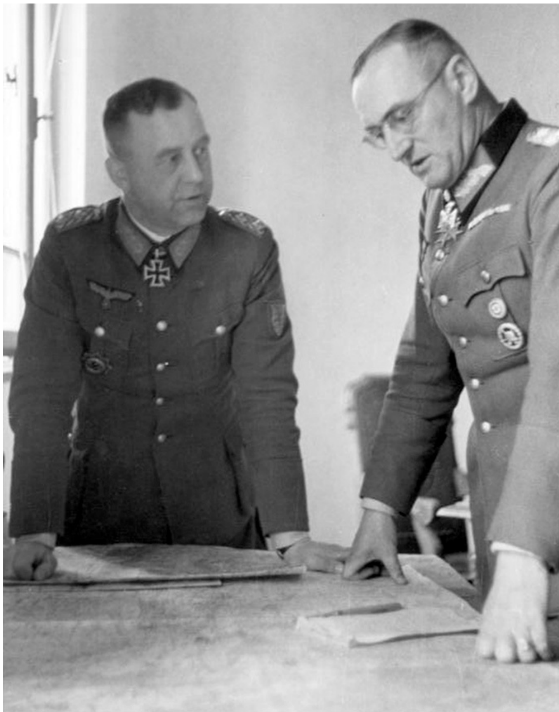
Генерал пехоты Велер и генерал-полковник Шернер, 11 апреля 1941 г.

Зверства румынских войск побудили начальника штаба 11-й армии Отто Велера потребовать от немецких солдат сохранения строжайшей тайны: «При господствующем в Восточной Европе отношении к ценности человеческой жизни немецкие солдаты могут стать свидетелями событий (массовые казни, убийства гражданских пленных, евреев и т. д.), которым они в настоящий момент не могут помешать, но которые глубоко задевают немецкое чувство чести... Нельзя фотографировать такие гнусные бесчинства или сообщать о них в письмах на родину. Изготовление или распространение таких фотографий или сообщений о подобных происшествиях будут рассматриваться как подрыв достоинства и мужской дисциплины в вермахте и строго наказываться. Все имеющиеся фотографии или сообщения о таких бесчинствах