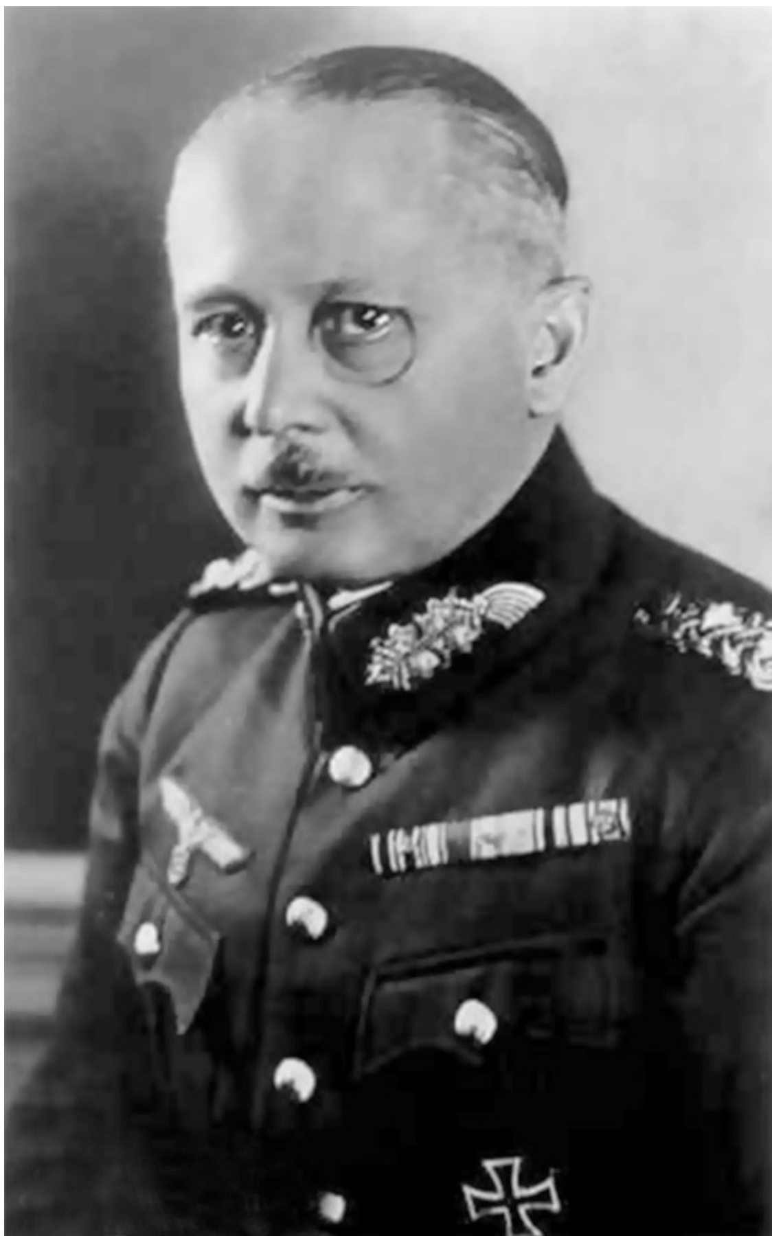
Командующий сухопутными войсками генерал-полковник Вернер фон Фрич (1934-1938)