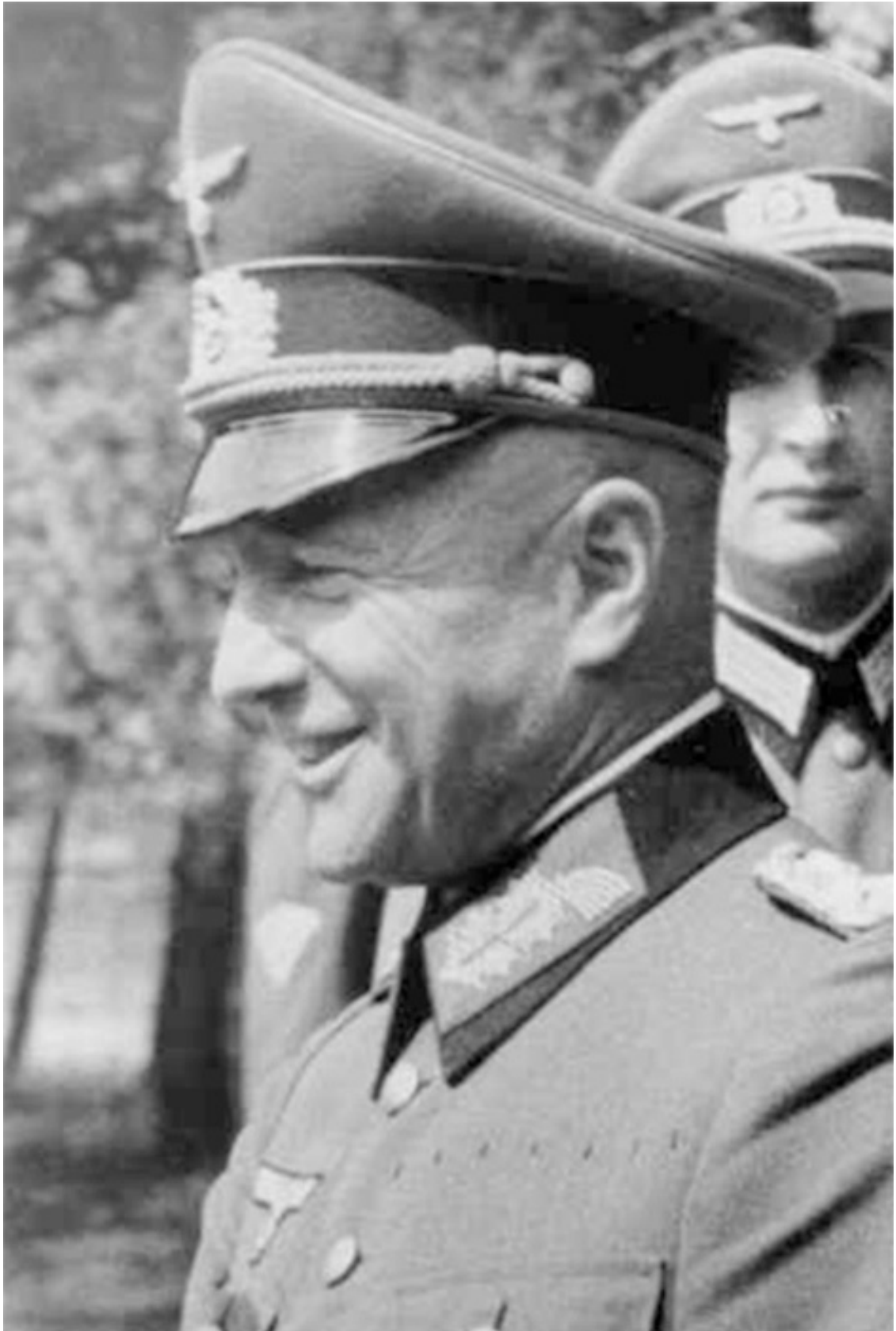
Командующий сухопутными войсками генерал-фельдмаршал Вальтер фон Браухич (1938-1941)

Военное командование послушно последовало за фюрером. Вскоре после его выступления ОКВ издало директивы с комментариями речи рейхсканцлера. В специальное пособие для