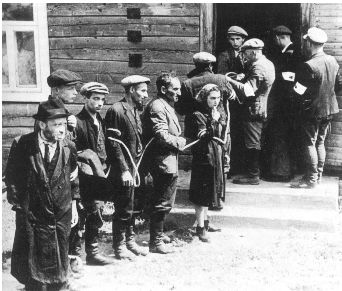
Связанные евреи под охраной литовской «Самозащиты». Июль 1941 года