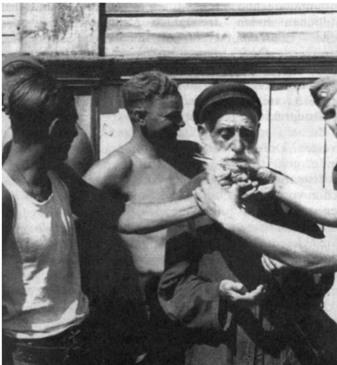
Немецкие солдаты издеваются над стариком-евреем. Западная Украина, июль 1941 года

Следующий, четвертый этап антисемитской политики вермахта начался во время летнего наступления 1942 года на Сталинград и Кавказ, когда основная масса воинских частей покинула центры расселения евреев. С этого момента с карательными органами режима сотрудничали главным образом тыловые военные учреждения – местные и полевые комендатуры, охранные дивизии, караульные воинские соединения, дежурные части, сформированные из тыловых подразделений и маршевых рот 157 .