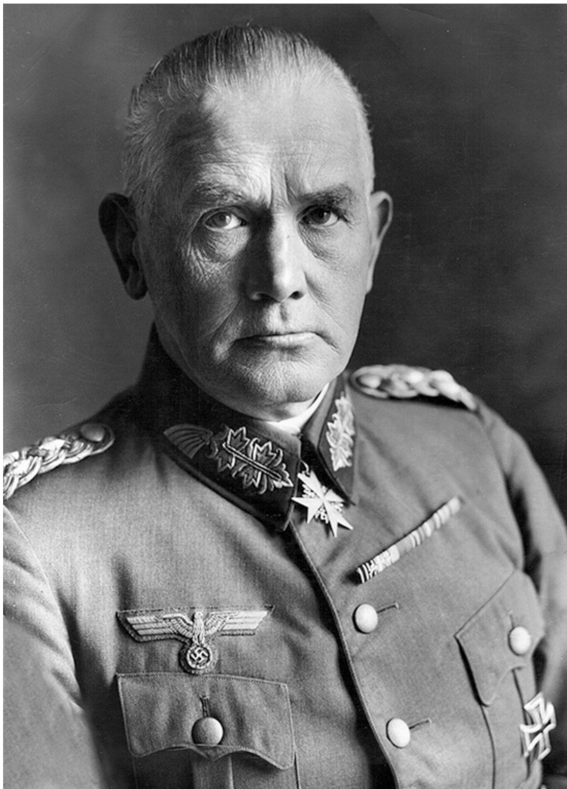
Военный министр генерал-фельдмаршал Вернер фон Бломберг (1933-1938)

В закон о восстановлении профессионального чиновничества от 7 апреля был включен специальный арийский параграф (§ 3), согласно которому чиновники неарийского происхождения подлежали увольнению в отставку. Исключение было сделано только для ветеранов Первой мировой войны (фронтовых бойцов), а также для отцов и сыновей погибших военнотру-