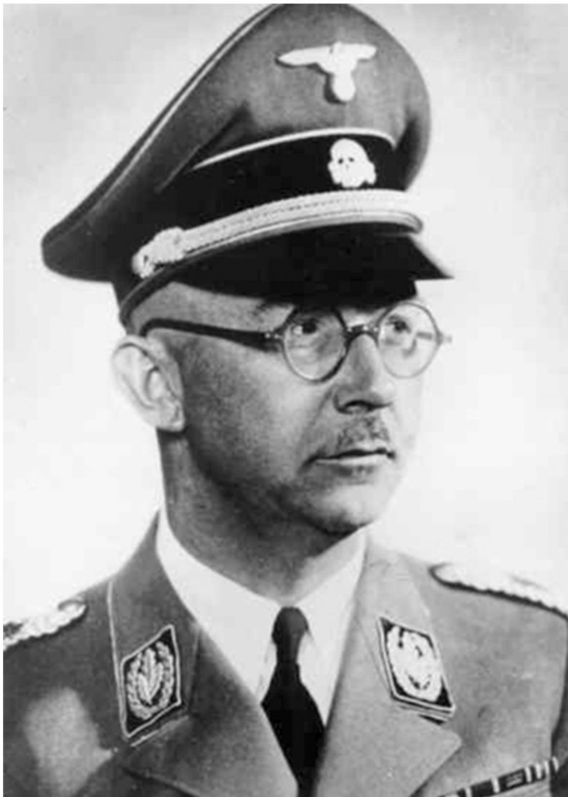
Рейхсфюрер СС Генрих Гиммлер

На военнослужащих вермахта, особенно молодых, большое воздействие оказал внешний вид польских евреев – в отличие от ассимилированных евреев в Германии, Австрии, Чехословакии многие евреи в Польше носили бороды, пейсы, кафтаны и камзолы. Польский еврей-журналист записал: «Молодые солдаты вермахта, которые дома никогда не видели таких евреев, прямо-таки ошалели от восторга. Вот они, перед глазами, враги Германии и всего челове-