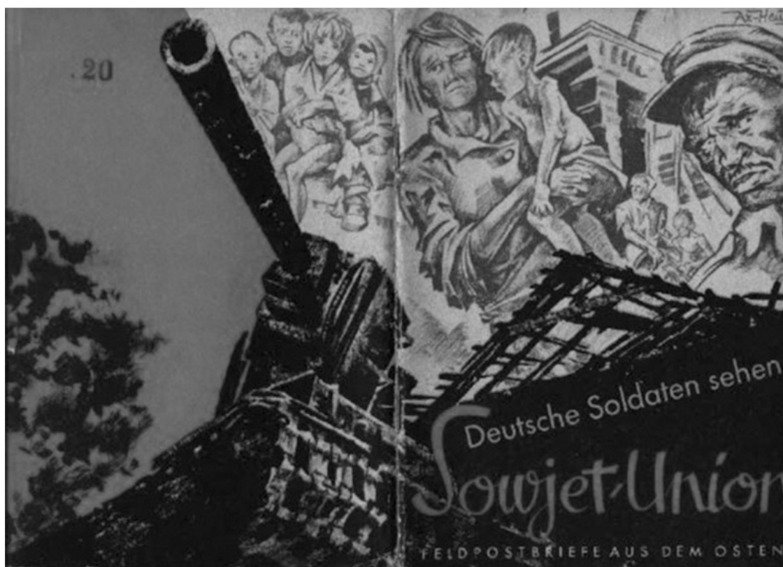
Обложка книги «Советский Союз глазами немецких солдат». Берлин, 1941 год

К задачам комендатур относились не только обеспечение управления, развитие экономики, борьба с эпидемиями и снабжение войск, но и «умиротворение» вверенной им области. Согласно докладу одного полевого коменданта это означало: «а) регистрация трофеев, в особенности всего огнестрельного оружия; б) арест партизан; в) доставка евреев в надежные места; г) настроение населения; д) минные поля; е) военнопленные». Таким образом, евреи считались второй по важности группой врагов после партизан, их доставка в надежные места относилась к обычным задачам оккупационных войск.