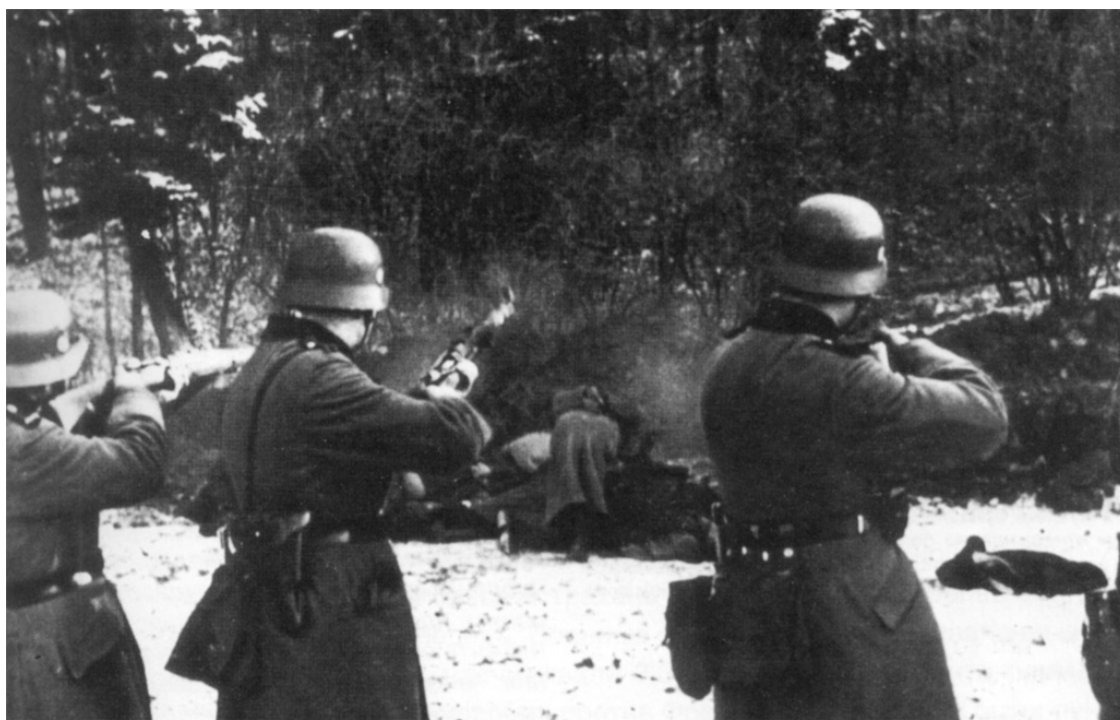
Расстрел польских граждан подразделением вермахта. Декабрь 1939 года

Бласковиц также критиковал действия немецких гражданских властей. Уже 27 ноября он направил Браухичу первый подробный доклад, в котором указал на напряженные отношения между вермахтом и карателями. На том основании, что Польша может превратиться в очаг вооруженного сопротивления оккупации, он предлагал реорганизовать управление ею. Во-первых, он считал необходимым для обеспечения нужд армии и немецкой экономики обеспечить в Польше покой и безопасность. Во-вторых, его заботила репутация вермахта. Бласковиц писал: «Войска не хотят, чтобы их идентифицировали со злодеяниями полиции безопасности, и по собственной инициативе отвергают любое сотрудничество с опергруппами, занятыми почти исключительно экзекуциями. Полиция до сих пор не выполнила никаких очевидных задач по наведению порядка, а только вызвала у населения ужас». Полицейские находятся в кровавом угаре, а «это является невыносимым бременем для вермахта, потому что все это совершают люди в полевом кителе» 103 .