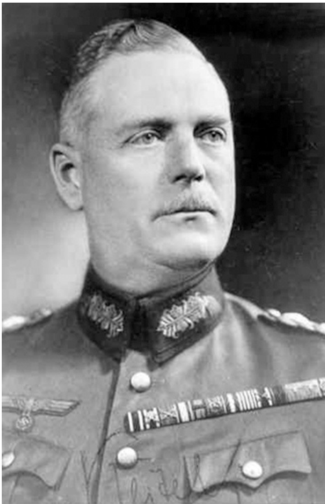
Шеф ОКВ генерал-фельдмаршал Вильгельм Кейтель (1938-1945)