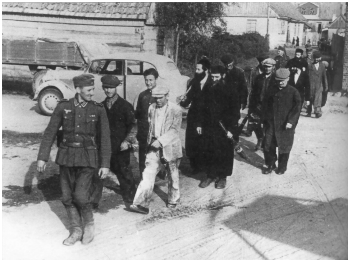
Снимок пропагандистской роты вермахта. Немецкие солдаты конвоируют евреев на принудительные работы. Польша. Сентябрь 1941 года