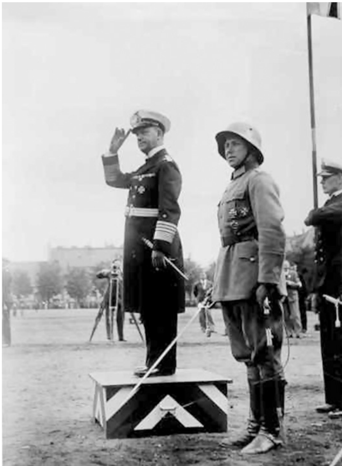
Командующий Кригсмарине адмирал Эрих Редер принимает военный парад

Главкомандующий военно-морским флотом Эрих Редер после краха Третьего рейха утверждал, что по еврейскому вопросу «мы», то есть командование ВМФ, «враждовали с партией». Он вспоминал: «Когда поднимался вопрос о евреях, служащих на флоте, я всегда лично вставал на их сторону и почти всегда выходил победителем. Два еврея – офицеры флота были уволены со службы на основании антисемитских Нюрнбергских законов. Мы позаботились о том, чтобы они смогли занять приличное положение на гражданской службе. Когда разразилась война, они были тут же возвращены на флотскую службу в прежних званиях и оправдали