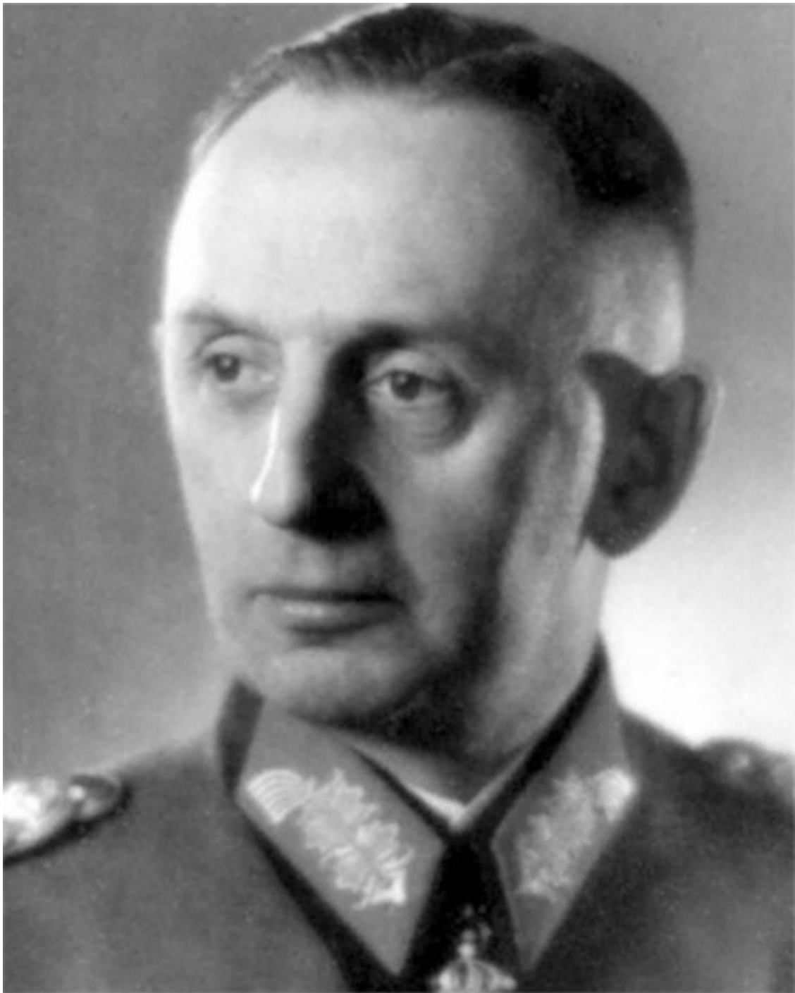
Начальник военно-экономического отдела ОКВ генерал пехоты Георг Томас

Уже во время первой оперативной паузы летом 1941 года началась новая фаза участия вермахта в Холокосте. В связи с конституированием системы оккупационной власти на захваченной советской территории военные органы на местах в нарушение действовавших приказов перешли от пассивного наблюдения к активной помощи опергруппам. Местные и полевые комендатуры, командующие тыловыми районами групп армий участвовали в мероприятиях юридической и экономической дискриминации евреев, в создании гетто и в уничтожении еврейского населения в целом ряде населенных пунктов.