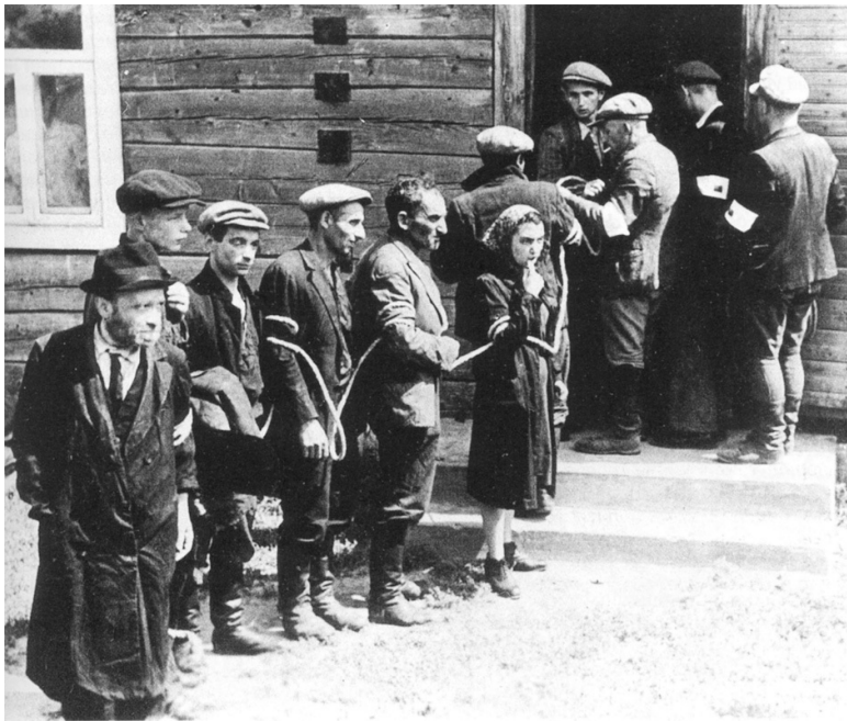
Связанные евреи под охраной литовской «Самозащиты». Июль 1941 года