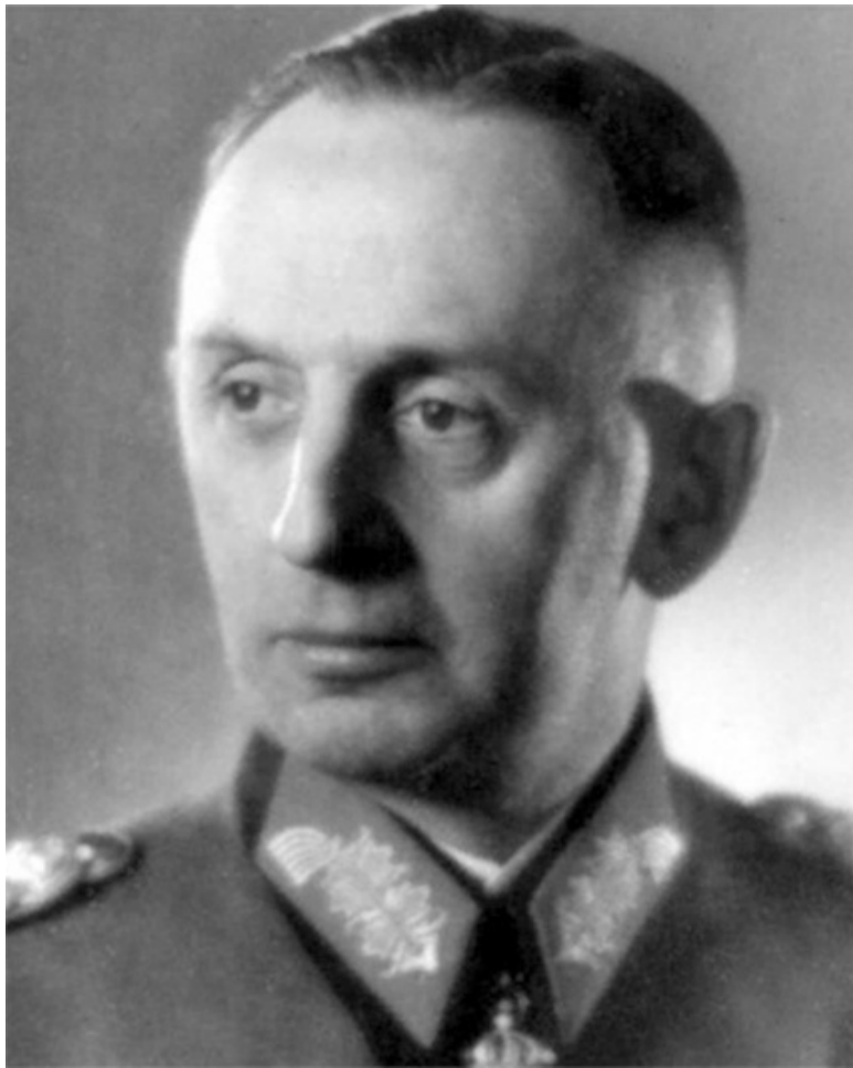
Начальник военно-экономического отдела ОКВ генерал пехоты Георг Томас