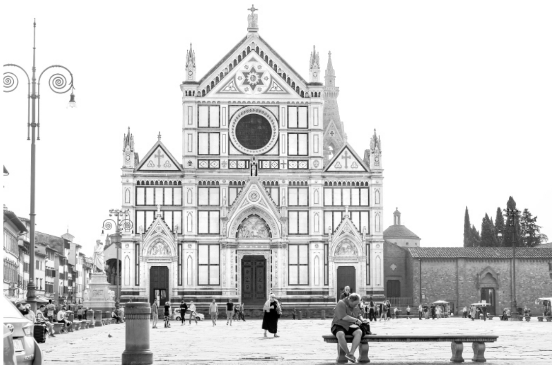
Церковь Санта-Кроче.

Конечно, не каждая городская постройка оплачивалась из казны – казна все же не резиновая. Часто расходы на крупные проекты брали на себя частные лица. Выступая спонсорами, они гарантировали себе уютное местечко в истории Флоренции, или же целые гильдии щедро снимали со своих счетов крупные суммы и тоже вписывали свои имена в дневник истории. Но когда речь шла действительно о престиже города, который, не дай бог, пошатнулся, то на время вводили экстренные налоги.