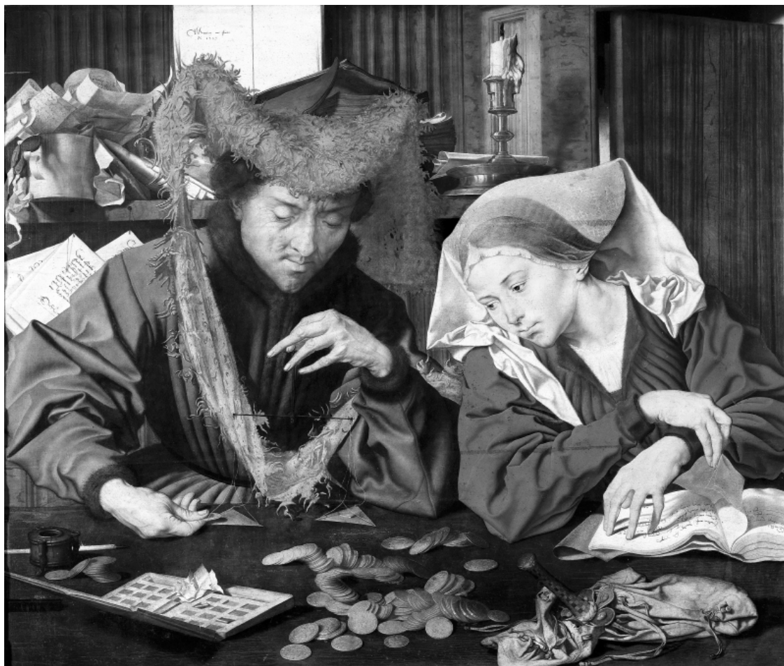
Маринус ван Реймерсвале. Меняла и его жена. 1539 г. Музей Прадо, Мадрид

Раз уж мы заговорили о монетах, то надо поговорить и о том, какая валюта была у Флоренции. О, это такая интересная тема, что не осветив ее, мы бы обязательно схлопотали укоризненный взгляд флорентийца!