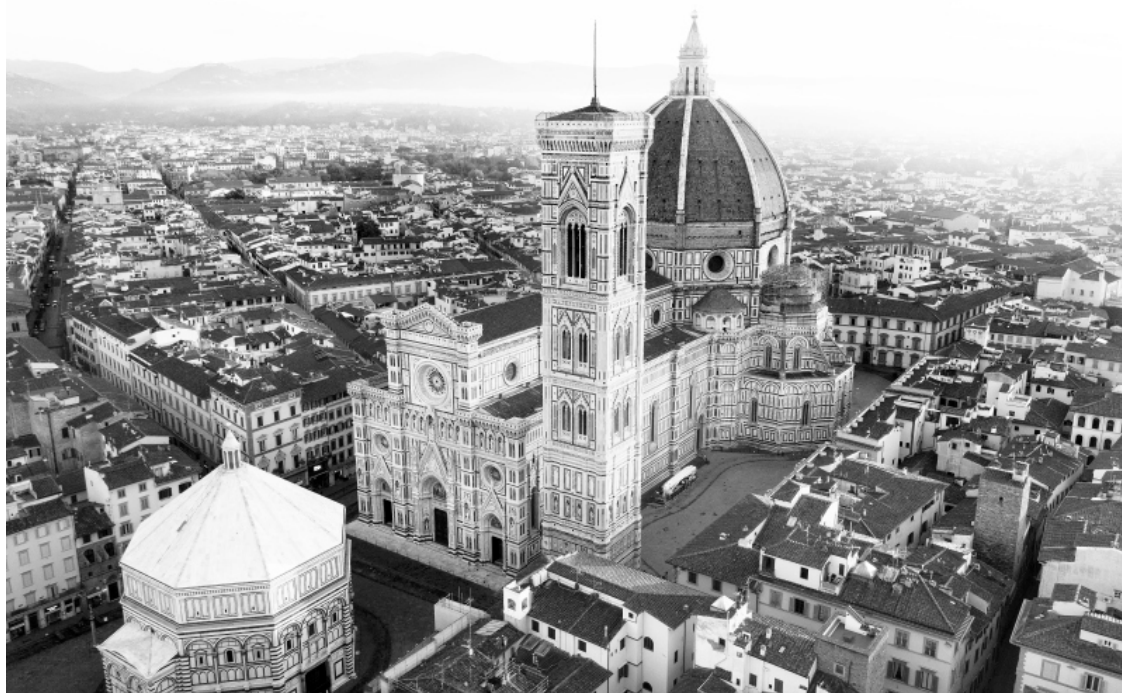
Кафедральный собор Санта-Мария-дель-Фьоре

Наш средневековый город растет как на дрожжах, и первое, что приходится перестраивать, – это городские стены. Времена все-таки были беспокойные: то французский король нарисует на горизонте со своими наемниками, то испанцы решат провести Неаполь, и зловещая конница поднимет пыль у городских ворот Флоренции, и не только напугает, но и виноградники вытопчет. Город должен иметь защиту. Строились подобные сооружения за счет налогов. Но кроме военных моментов любой город большое внимание уделял своей репутации. И как же показать приезжим купцам, что у нас здесь дорого-богато, чтобы те, недолго думая, вклад в банке открыли, недвижимость арендовали или сделки какие-то предложили? Конечно, через архитектуру. Архитектура была визитной карточкой любого города во все времена, поэтому в XIII веке Флоренция озадачилась постройками, которые в будущем создадут ее неповторимый облик. Более того, и сегодняшнее «лицо» Флоренции составляют именно те здания, которые были построены в далеком XIII веке: Кафедральный собор Санта-Мария-дель-Фьоре, церковь Санта-Кроче и Старый Дворец. Если строить, то на века!