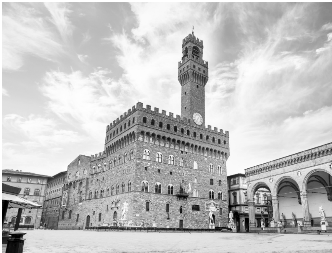
Старый дворец.

Так, в июле 1369 года, в месяц, когда вся Флоренция буквально плавилась под ногами от палящего солнца и дышать просто не представлялось возможности, в документах отмечена последняя выплата архитектору Кафедрального собора по имени Франческо Таленти. Последней она стала не из-за того, что работы по строительству завершились, просто Франческо отошел в мир иной. Так город остался с почти что достроенным собором, но которому не хватало самого главного – купола, – чтобы закрыть алтарь и наконец-то освятить самый крупный дом Господа в Европе (по скромному убеждению флорентийцев). Да, горожане затеяли очень амбициозный проект, даже слишком амбициозный для того времени. Не учли они лишь такой небольшой нюанс, как диаметр запланированного купола: он получился таким большим, что никто не знал, как вообще этот купол воздвигать! Ни строительных лесов такой высоты не строили, ни в принципе таких огромных куполов не возводили. Как же Флоренции удалось выйти из столь неприятной ситуации, мы узнаем в последующих главах. Пока лишь скажу, что, когда архитектор нашелся, деньги на постройку собирали всем городом! Каждый флорентиец вносил в казну по мере своих возможностей, но вносил. Поэтому мы смело можем сказать, что сегодняшний символ города, чудесный купол Брунеллески, – это чудо, которое случилось благодаря неравнодушным жителям города, среди которых были и богатые купцы, и бедные прачки!