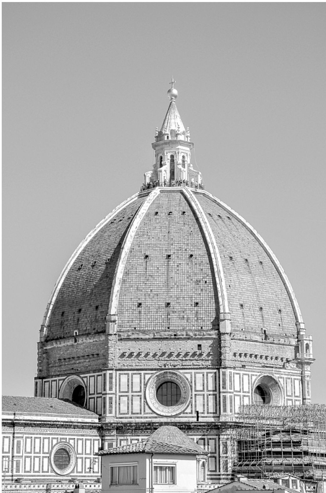
Купол Брунеллески.

К слову о богачах и бедняках. Большое расслоение в социальных классах – история древняя как мир, но иногда оно было настолько огромным, что государство было вынуждено сгла-