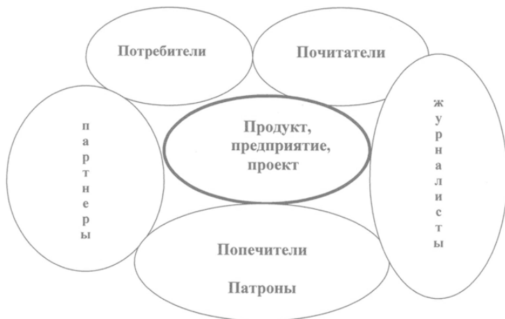
Схема формулы 4П+1Ж опорного круга базового окружения (ОКБО)

1. П1 – Потребители – разные, но любой потребитель любимый.