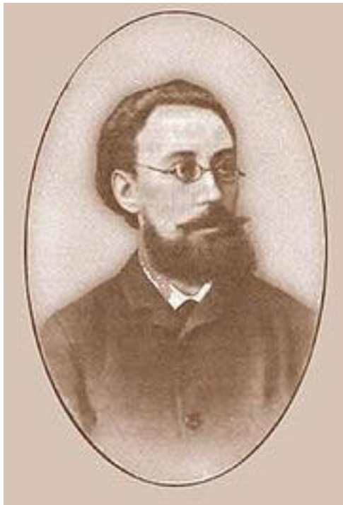
Фёдор Адамович Корш

Среди перечисленных антрепренеров-профессионалов мы не указываем К.С. Станиславского и Вл. И. Немировича-Данченко. В истории русского частного театра это был выдающийся творческо-организационный тандем, беспримерно прослуживший искусству долгие годы, невзирая на личную неприязнь друг к другу. Это очень важная вещь –