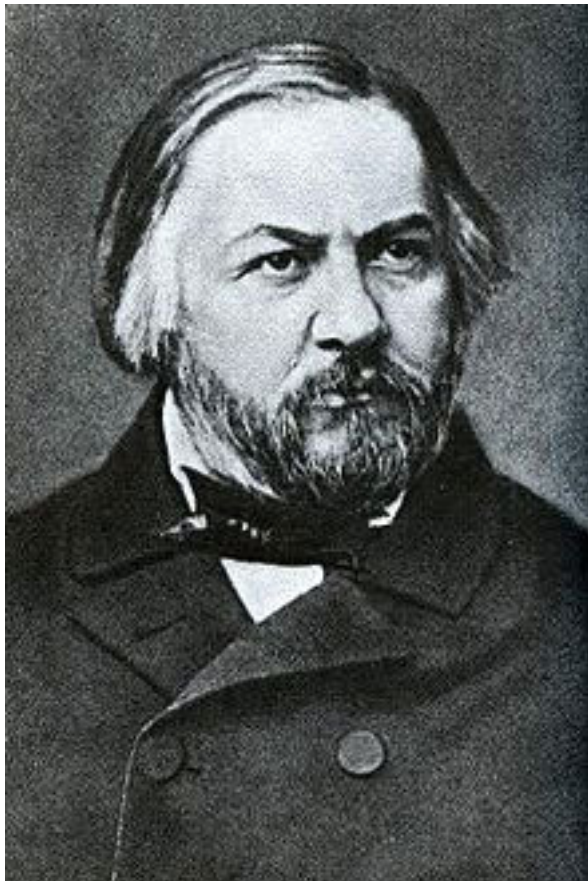
Михаил Иванович Глинка

И лишь тогда, когда в ходе неспешного исторического процесса творческие силы нации стали пробуждаться, ко-