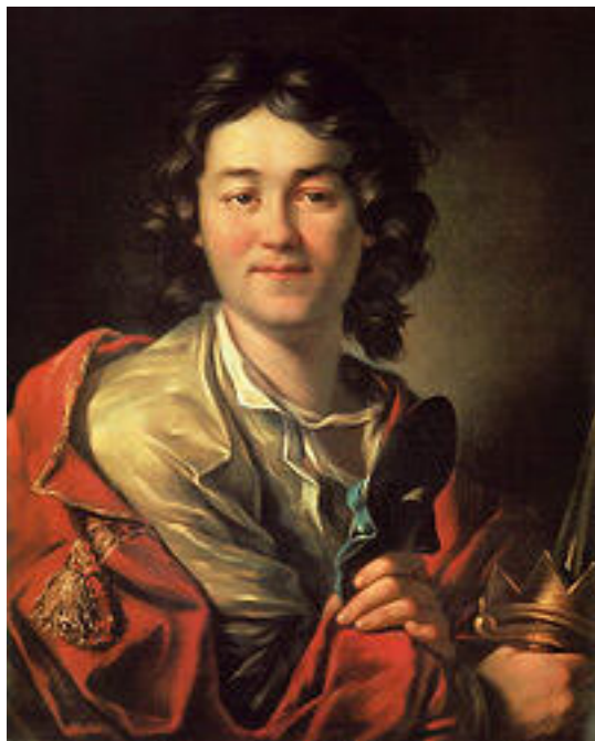
Фёдор Григорьевич Волков