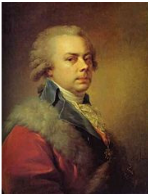
Николай Борисович Юсупов

школы, но и национального музыкального театра.