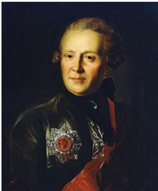
Александр Петрович Сумароков. 1777 год. Художник Ф.С. Рокотов

После Указа Екатерины Великой 1783 года Российский придворный театр стал именоваться Императорским. Тогда же появились в России русские театры оперы и балета в Петербурге и Москве, Русский драматический театр в Москве, постоянные иностранные труппы.