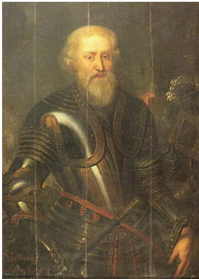
Артамон Сергеевич Матвеев (посмертный портрет)