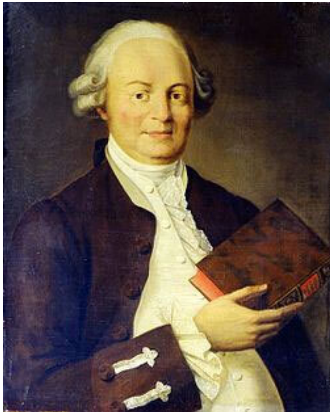
Василий Кириллович Тредиаковский

Поэтому в кратчайшие сроки репертуар переделывается под русскую публику, под максимально широкую городскую аудиторию. К примеру, первое представление оперы в Рос-