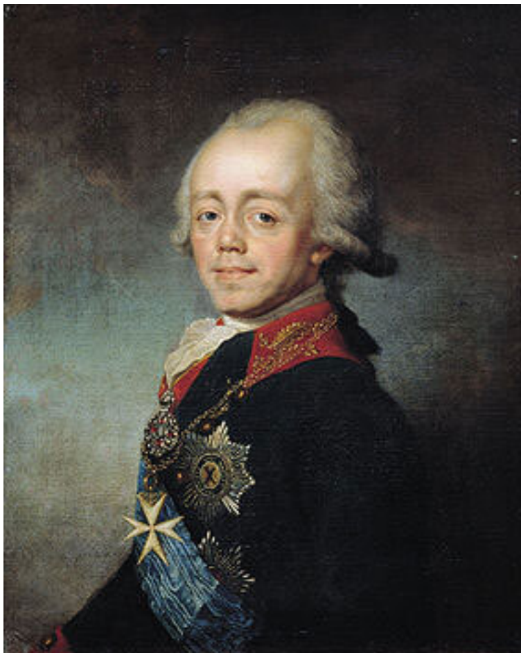
Император Павел I