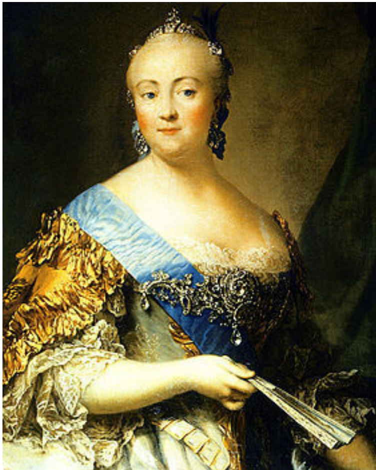
Елизавета Петровна Императрица Всероссийская