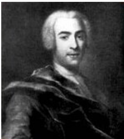
Франческо Доменико Арайя

Некоторые из них задерживались в Петербурге и Москве на многие годы и становились придворными театральными труппами . Так случилось с французским драматическим театром, руководимым Шарлем Сериныи и итальянским оперным театром, возглавляемым известным композитором Франческой Арайей. С ним и связано первое представление в 1735 году в России оперного спектакля.