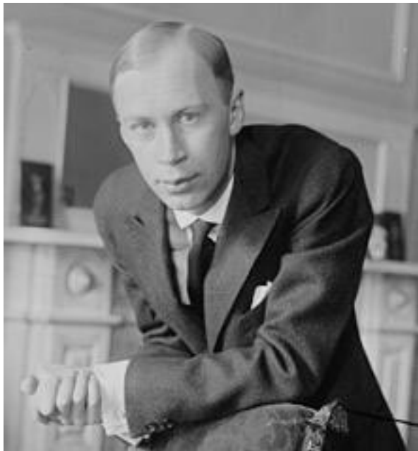
Сергей Сергеевич Прокофьев (1918)

Сегодня среди театрального сообщества ходят байки о том, что современные оперы у зрителей не в чести и что в отличие от зрителей-слушателей начала XX века, у сегодняшних зрителей новые оперы не пользуются популярностью, их не ожидают, за них не болеют и они, как правило, не делают кассовых сборов.