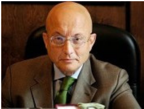
Сергей Александрович Караганов

Всё, что мы описали выше, являлось лишь поводом и предлогом для создания этой книги. В этой связи на этих страницах мы впервые рассматриваем антрепренёрство как предпринимательство и частную инициативу в области отечественного театрально-сценического искусства вообще и оперного в частности с момента постановки первого музыкального спектакля в России в историческом контексте аналитически. Но особое внимание уделяем выдающимся деятелям оперной антрепризы конца XIX – начала XX веков, оказавших беспрецедентное влияние на развитие искусства оперы и театра в стране, но и сделавших без преувеличения бесценный вклад в отечественную художественную культуру в целом. Поэтому читатель поймет, что: