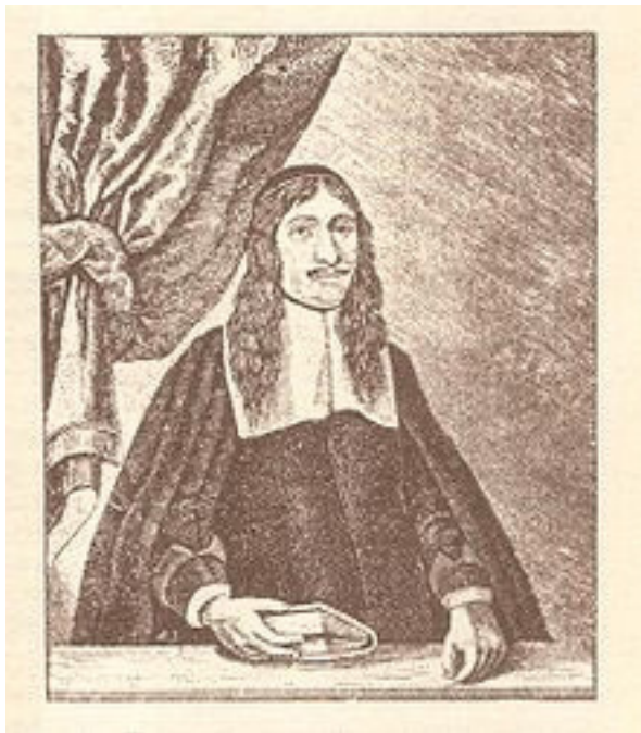
Иоганн Готфрид Грегори (1631–1675). Гравюра С. Гримма (1667).

Таким образом, по сути, благодаря инициативе частного лица (пусть и государя) в России 17 октября (по старому стилю) 1672 года состоялась (выражаясь современным языком) презентация нового вида сценического искусства под названием театр, которое, в виду успешной премьеры и дальней-