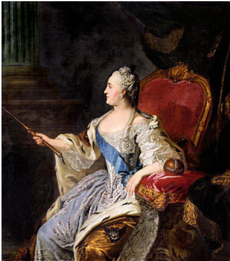
Портрет императрицы Екатерины II. Художник Ф.С. Рокотов. 1763.

Так исторически складывался в России стационарный