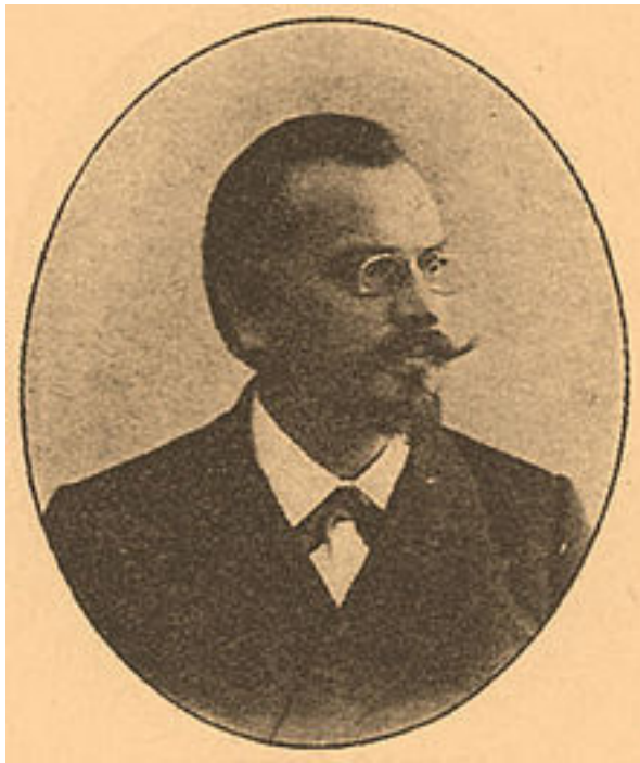
Всеволод Евграфович Чешихин

Раз частная инициатива, предпринимательство, значит антреприза и антрепренёрский театр.