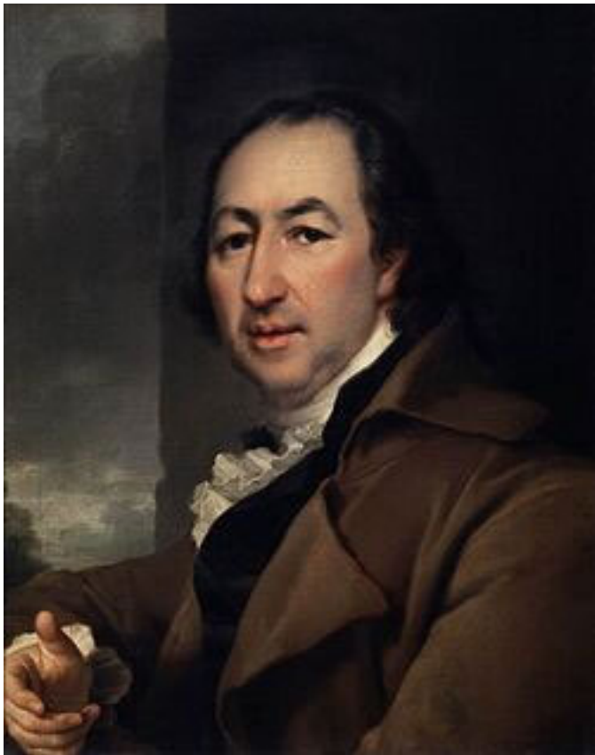
Николай Иванович Новиков. Художник Д.Г. Левицкий.

Золотой (XVIII) век – век свободного передвижения, свободного сообщения и свободного общения. Многие русские, помимо представителей государственной службы, помещики и