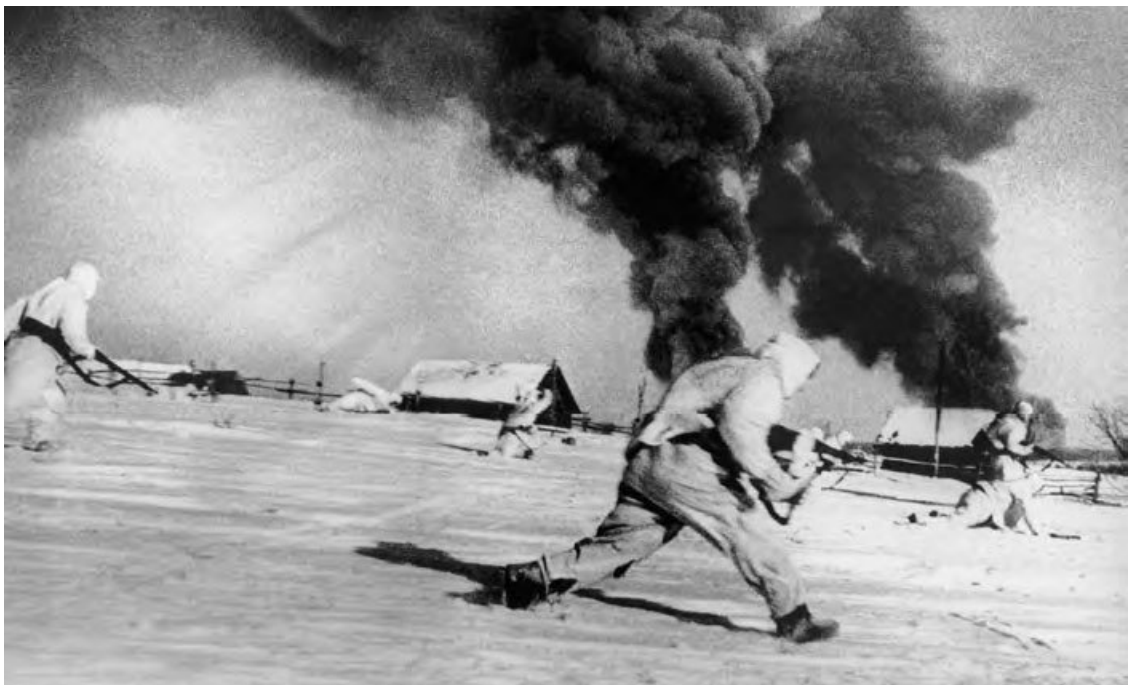
Бойцы занимают населенный пункт в Подмосковье