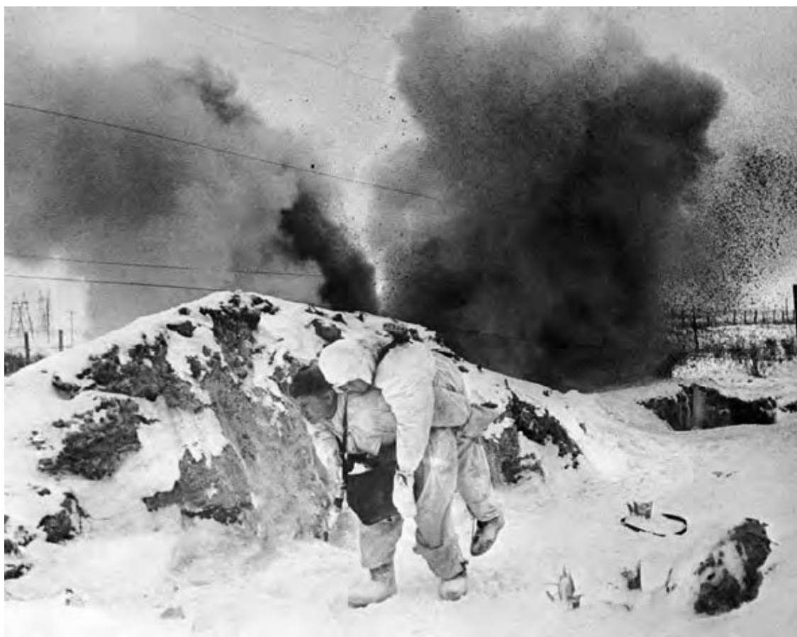
Санинструктор выносит с поля боя раненого бойца