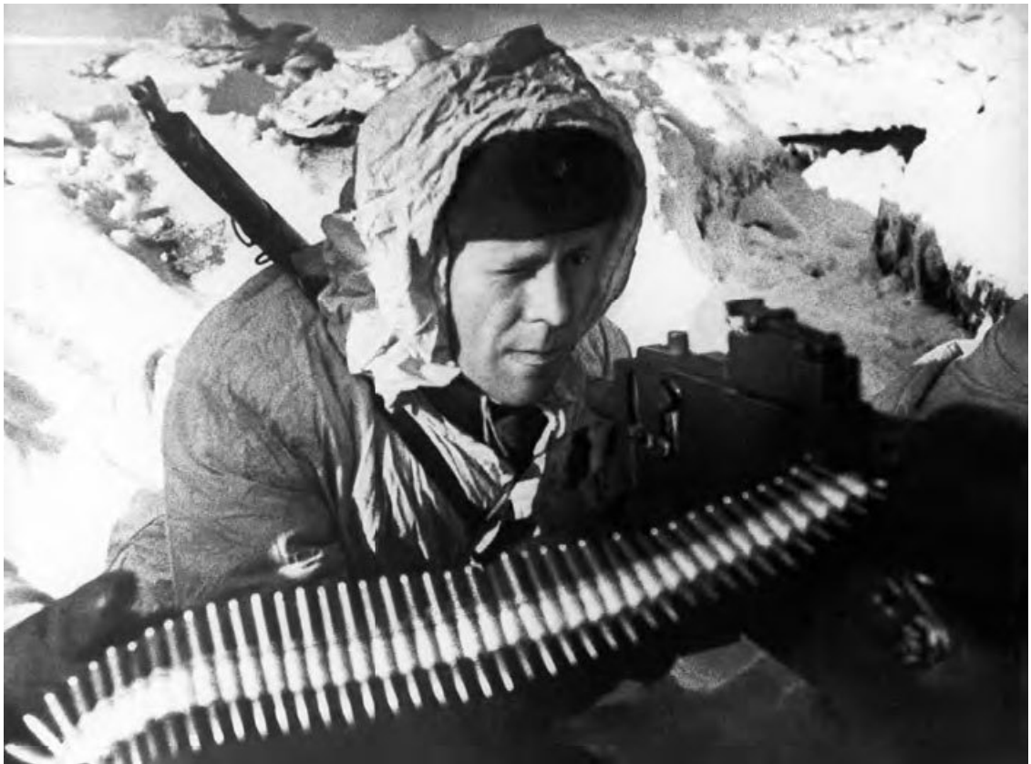
Оборона Москвы. Пулеметчик на огневом рубеже