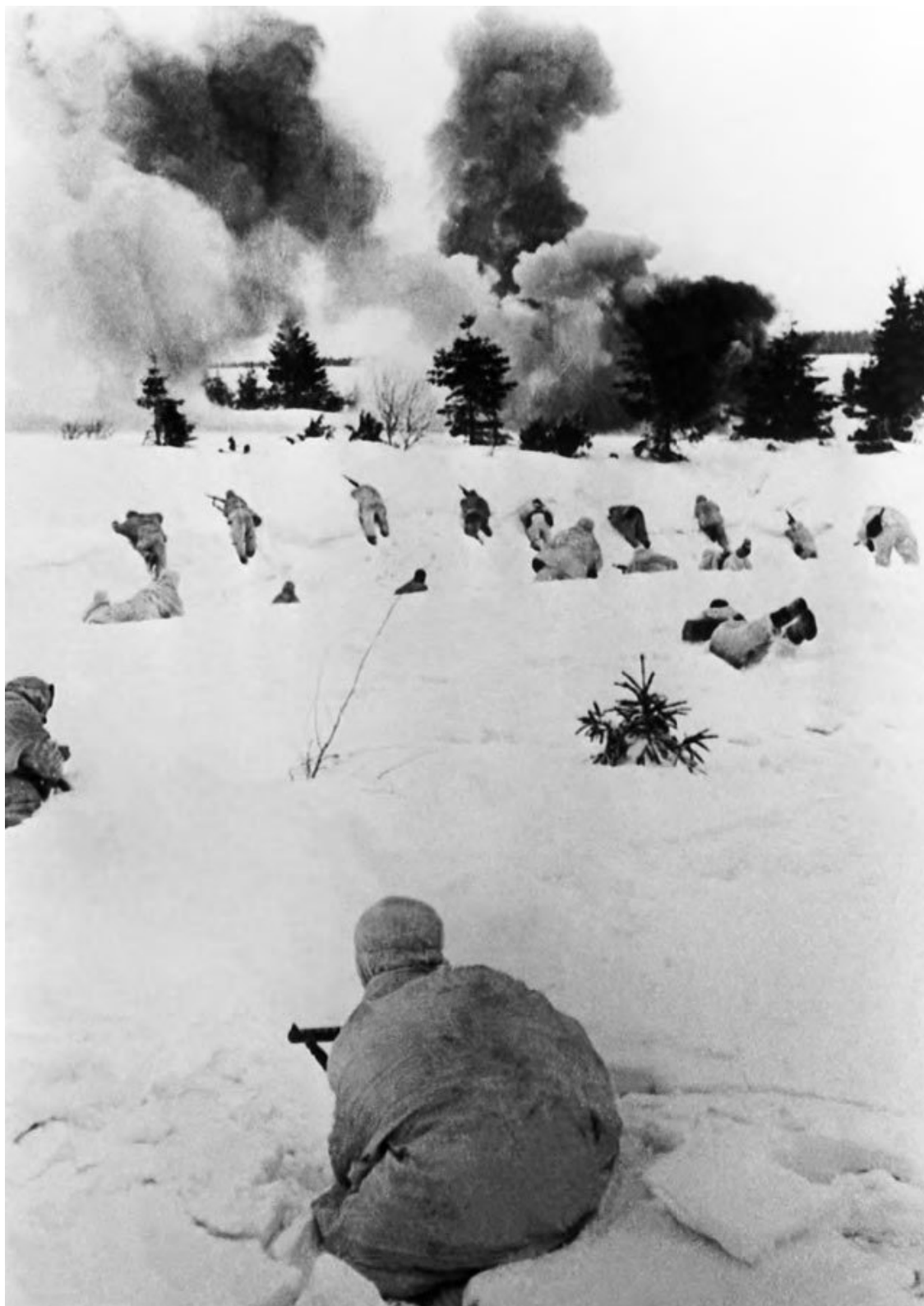
Московская область. Советские пехотинцы атакуют вражеские позиции