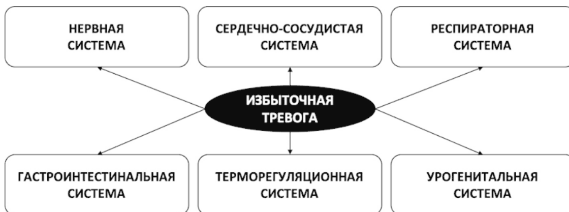
Рис. 5. Многогранность телесных проявлений тревоги

Необходимо понимать, что симптомы, вызванные избыточной тревогой, какими бы неприятными они ни были, являются не признаком реального органического заболевания, а следствием искаженного мышления, которое создает тревогу, не могущую проявляться иначе как в виде телесных симптомов.