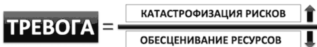
Рис. 2. Краткая формула тревоги