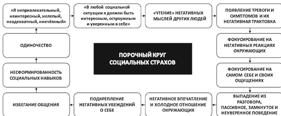
Рис. 7. Порочный круг социальных страхов

Вполне естественно, что избегающая модель поведения препятствует формированию и развитию коммуникативных навыков, не говоря уже о навыках уверенного поведения, что негативно сказывается на качестве общения и уверенности в себе любого человека. В конечном итоге именно вследствие порочного круга социальных страхов люди зачастую оказываются в одиночестве (см. рис. 7).