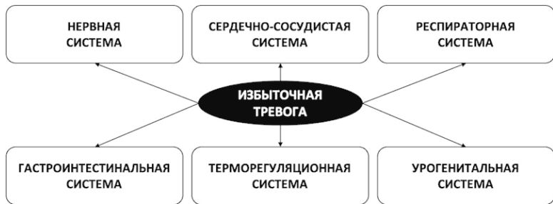
Рис. 5. Многогранность телесных проявлений тревоги

А симптоматики, порождаемой избыточным уровнем тревоги и стресса, может быть превеликое множество, ведь тревога заставляет активно работать разные органы и системы человеческого организма (см. рис. 5).