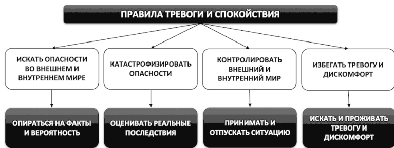
Рис. 6. Правила тревоги и спокойствия

Наглядно и схематично квартет вышерассмотренных правил тревоги и альтернативных им правил спокойствия можно представить следующим образом (см. рис. 6):