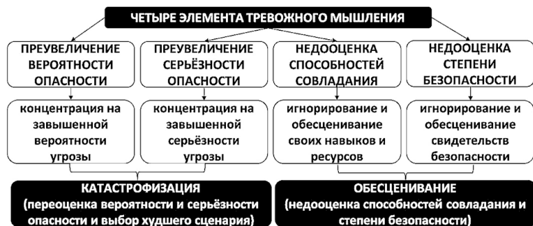
Рис. 1. Элементы тревожного мышления

Разберем эти элементы более подробно на примере социофобических переживаний.