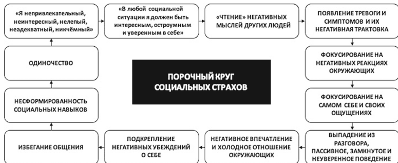
Рис. 7. Порочный круг социальных страхов

Вполне естественно, что избегающая модель поведения препятствует формированию и развитию коммуникативных навыков, не говоря уже о навыках уверенного поведения, что негативно сказывается на качестве общения и уверенности в себе любого человека. В конечном итоге именно вследствие порочного круга социальных страхов люди зачастую оказываются в одиночестве (см. рис. 7).