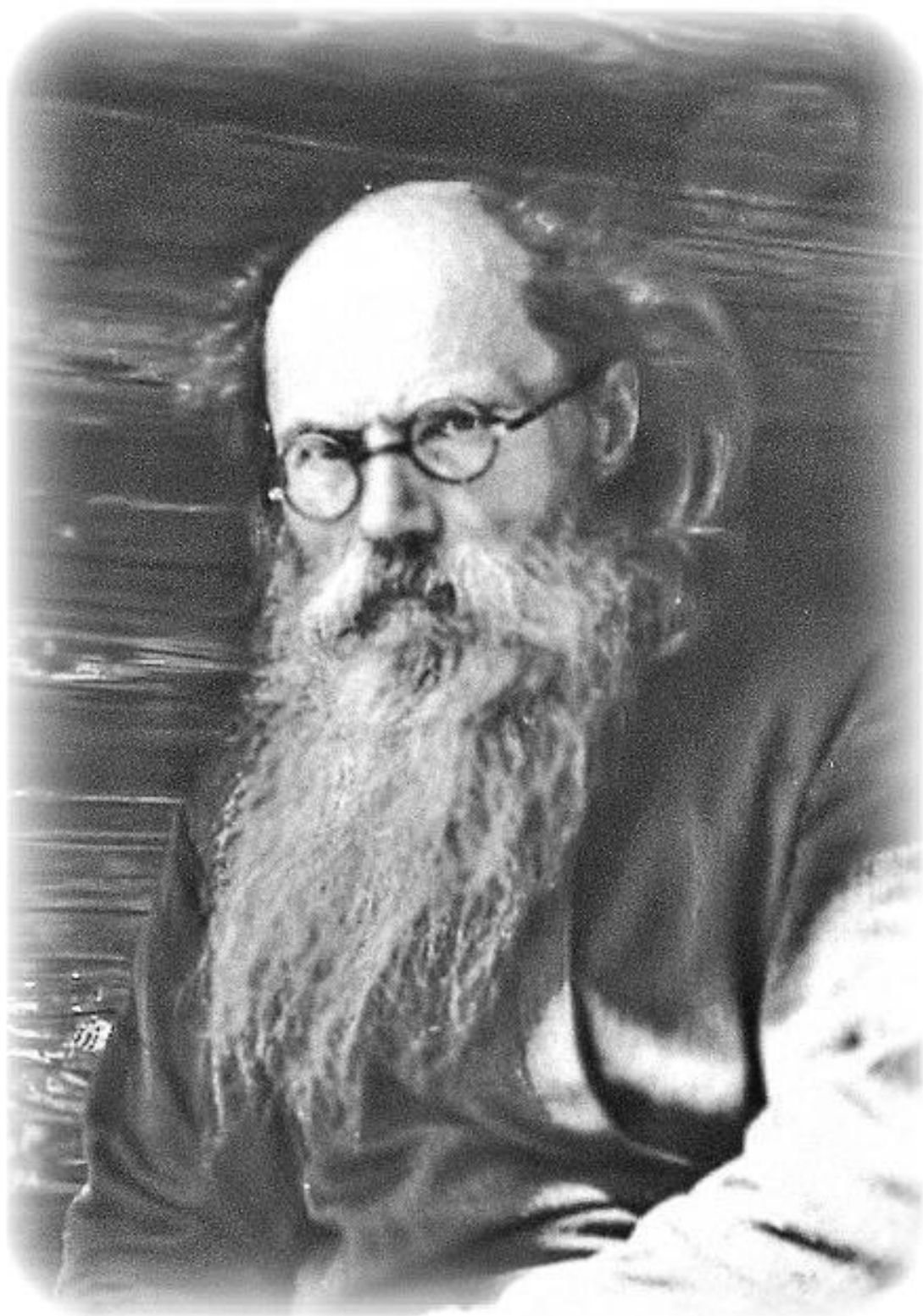
Игумен Никон (Воробьев)

* Размышлял: «По-моему, к людям надо относиться так, как врач к больным. Мы все больны всеми болезнями, только у одних выпирает одна, у других другая болезнь».