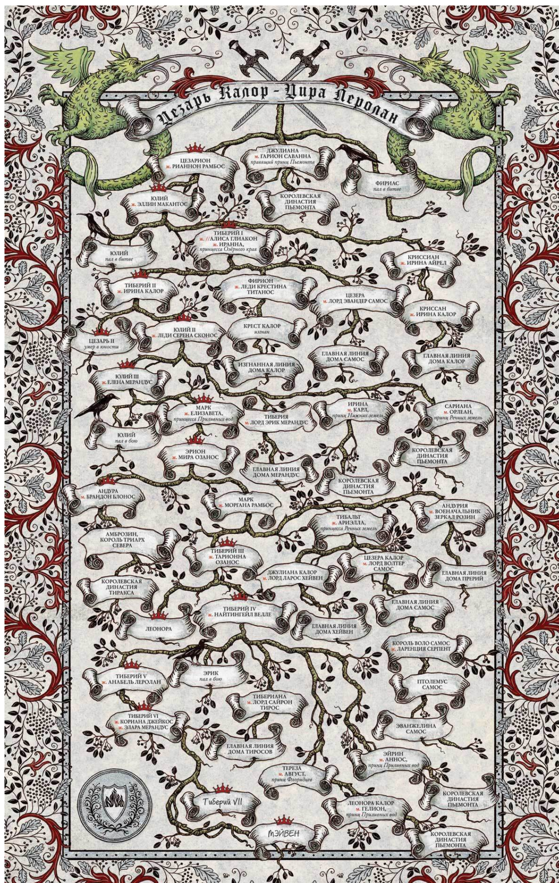
Семейное древо Дома Джейкос