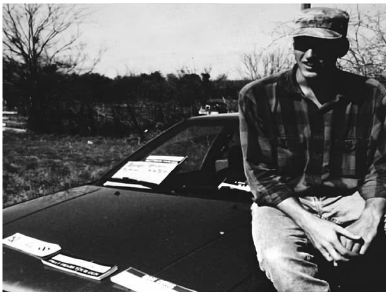
Рис. 1. Тимоти Маквей в Уйэко

тремистских групп, как Posse Comitatus, «Орден», «Арийская нация», а также движения сторонников Рэнди Уивера в Руби-Ридж, «Всемирной церкви Бога» Герберта Армстронга, «Свободных людей Монтаны» и «Мировой церкви Творца». Оно популярно во многих военизированных движениях, а в 1999 году вдохновило Буфорда Фарроу напасть на еврейский центр в Гранада-Хиллс, штат Калифорния.