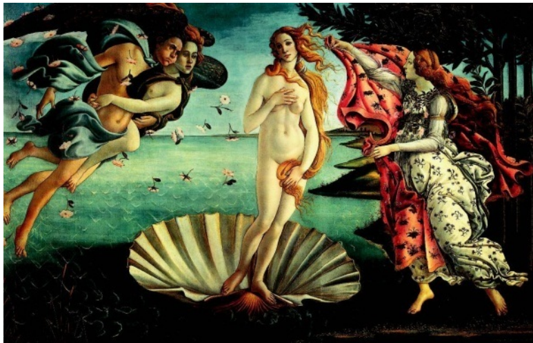
Сандро Боттичелли Рождение Венеры, 1482–1486 Уффици, Флоренция

В этой книге я описываю раскованную сексуальную жизнь молодёжи в городе Москве. Это было время после смерти Сталина – время Хрущёва и Брежнева, время «оттепели». Об этой полосе жизни почти ничего не написано, а провинциальные жители вообще не знают чем жила городская молодёжь в те незабываемые времена.