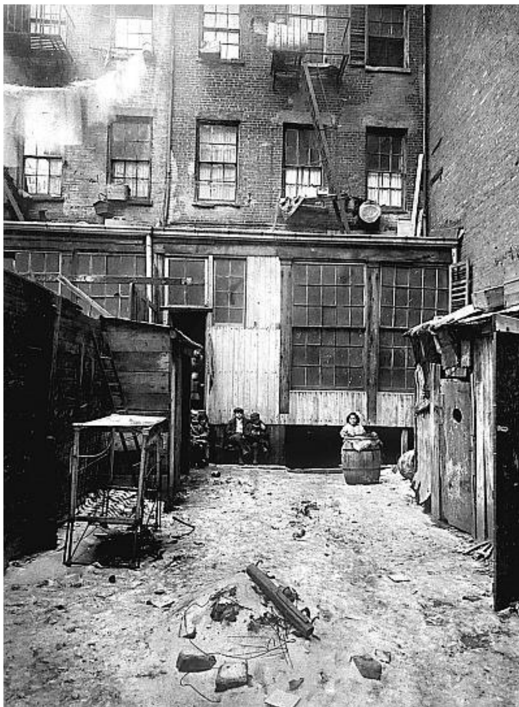
Будничная жизнь простого народа. Америка 20 – 30-х гг. XX века

Как только девочке исполнилось семь лет, произошло непоправимое, а именно столь серьезное обострение болезни у ее матери, что врачи были бессильны что-либо исправить. В последние месяцы состояние ее матери было довольно странным, дни безысходной депрессии сменялись бесконечной, навязчивой болтовней о грехах и страхах или еще хуже – взрывами необоснованной ярости. В один из таких дней Глэдис вдруг набросилась на подругу с обвинениями, что та хочет похитить у нее ребенка, как раньше хотела похитить ее любовника, отца Нормы. В руках помешанной мелькнул нож. На крики сбежались соседи... И вот уже мать несчастной девочки срочно отправлена в ту же больницу, в которой совсем недавно скончалась ее собственная мать, бабушка Нормы Джин.