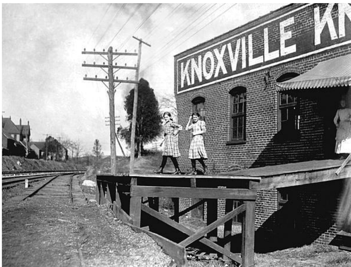
Провинциальное американское детство. Фото начала 20-х гг. XX века

Одному из репортеров ММ призналась, что ее настоящий отец – человек, «живший с моей матерью в одном доме. Он ушел, покинув мать в тот момент, когда я должна была появиться на свет». Предположительно этим мужчиной был Стенли Джиффорд, коллега Глэдис, также служивший в компании «Консолидейтед Филм Индастриз». Находились свидетели, утверждавшие, что когда брак Глэдис с Мортенсоном распался, именно Джиффорд стал ее любовником.