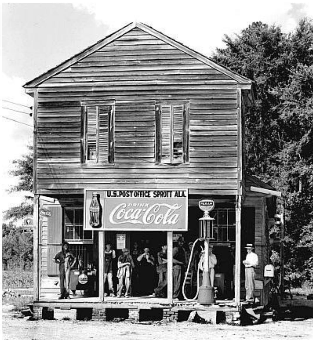
Америка начала XX века

О детских страхах звезды ходит много легенд, и где правда, а где ложь, нам определить сложно. Но то, что насилие над психикой и физиологией ребенка, а затем подростка имели место, – не вызывает никаких сомнений.