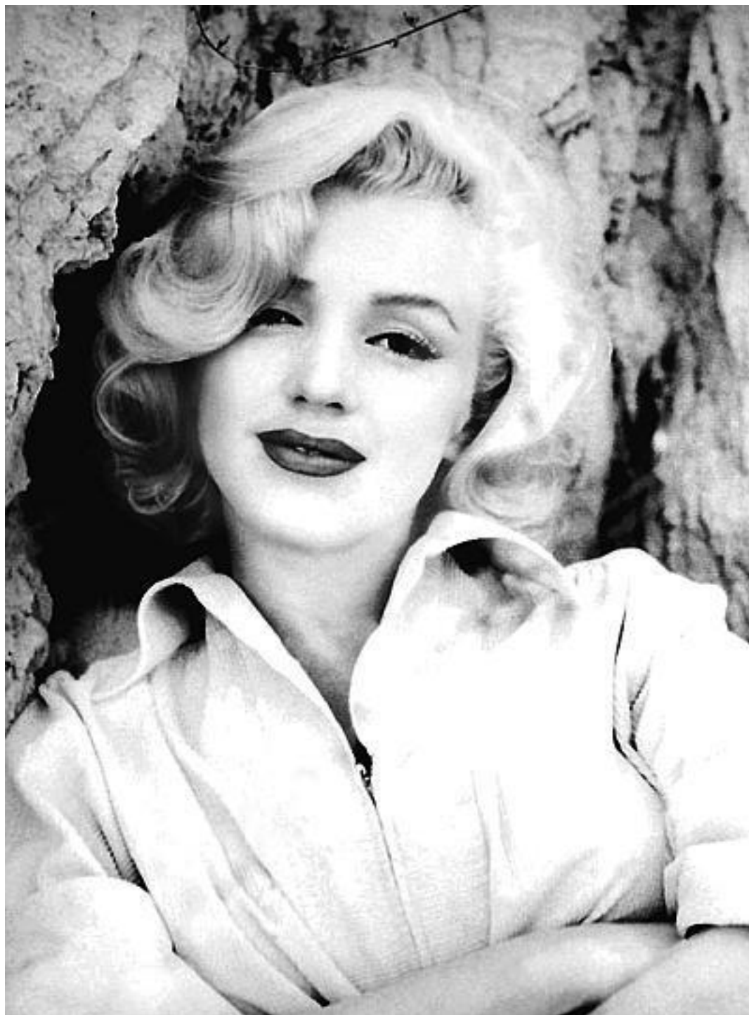
Блондинка, ставшая легендой