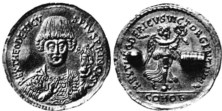
Золотой юбилейный медальон Теодориха Великого, отче-

санкционированный руководством племени, сам предводитель набирал отряд. Так, в 470 г. будущий король Теодорих, видимо даже без воли отца, выступил против сарматов на левом берегу Дуная, собрав шеститысячный отряд из спутников отца, клиентов и просто добровольцев (Jord. Get., 282). Следовательно, если набег организовывался неким предводителем, то основу отряда составляли его дружинники и зависимые соплеменники, к которым присоединялись просто любители приключений и легкой наживы. В данном случае присутствие ветеранов, соратников отца, должно было поднять престиж мероприятия и показать серьезность последнего. Позднее, в 478 г., уже будучи королем, Теодорих собрал в поход против столицы империи 12 000 готов и воинов из других народностей (Fredeg., II, 57).