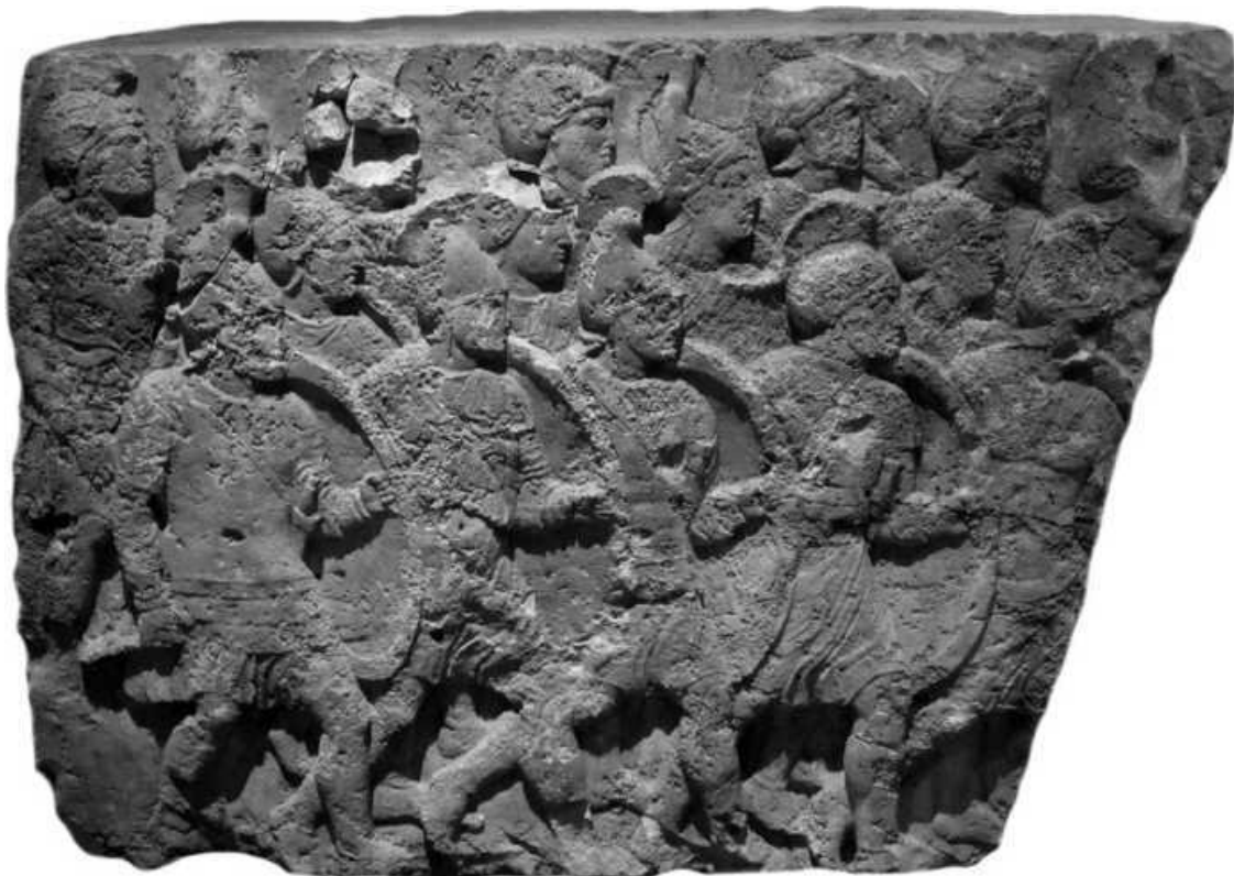
Македонская фаланга. Археологический музей Анталы.

трое жалованьем, а один властью над «декадой», и 12 персов» (Arr.Anab.VII,23). К вопросу о выплате жалованья в македонской армии мы ещё вернемся, пока же обратим внимание на такой момент. Желая польстить самолюбию фалангитов, Филипп II называл их педзетайрами – «пешими гетайрами» (товарищами), тем самым как бы уравнивая их с элитными тяжеловооруженными всадниками – гетайрами.