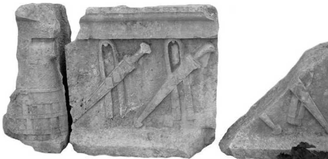
Панцирь линоторакс и мечи ксифосы. Археологический музей Сиде.

ранга» (94,44–45). Комплект защитного снаряжения воина сариссофора дополняли поножи. По мнению Р. Шепарда, это было необходимо для того, чтобы стоявшие в тесном строю педзетайры не поранили ноги своих товарищей подтоками сарисс (113,83).