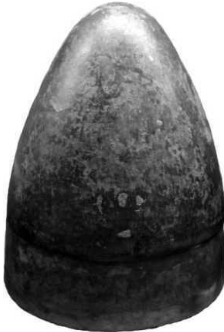
Шлем пилос. Афины. Музей Бенаки.

гими военными организациями эллинского мира, где подобная практика отсутствовала. Хотя к системе обеспечения личного состава армии оружием и доспехами за счет государства Филипп II пришёл не сразу, а по мере роста своих успехов во внутренней и внешней политике и наполнения золотом государственной казны.