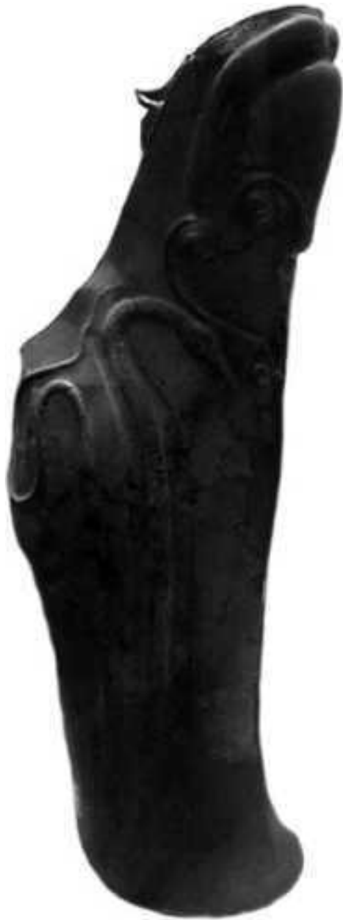
Бронзовая поножа. Афины. Национальный Археологический музей.

Отправляясь в Азиатский поход, Александр оставил в распоряжении наместника Македонии Антипатра 12 000 пехотинцев (Diod. XVII,17). Говорить о том, что все они являлись сариссофорами, не приходится, поэтому логично предположить, что под командованием Антипатра было шесть таксисов фаланги. Остальные пехотинцы были легковооруженными воинами. Описывая битву при Гавгамелах, Арриан называет имена командиров такисов фаланги и показывает их расположение в строю. На правом фланге стоял таксис Кена, Полемократова сына, «затем Пердикки, Оронтова сына; потом Мелеагра, Неоптолемова сына; затем полк Полиперхонта, сына Симмии; затем Аминты, сына Филиппа. Этим полком командовал тоже Симмия, так как Аминта был отправлен в Македонию набирать войско. Левое крыло македонского войска занимал полк Кратера, Александра сына» (Arr.Anab.III,11). Полиперхонт был назначен командиром таксиса вместо Птолея, сына Селевка, погибшего в битве при Иссе (11,12). Обращает на себя внимание тот факт, что в битвах при Иссе и Гавгамелах