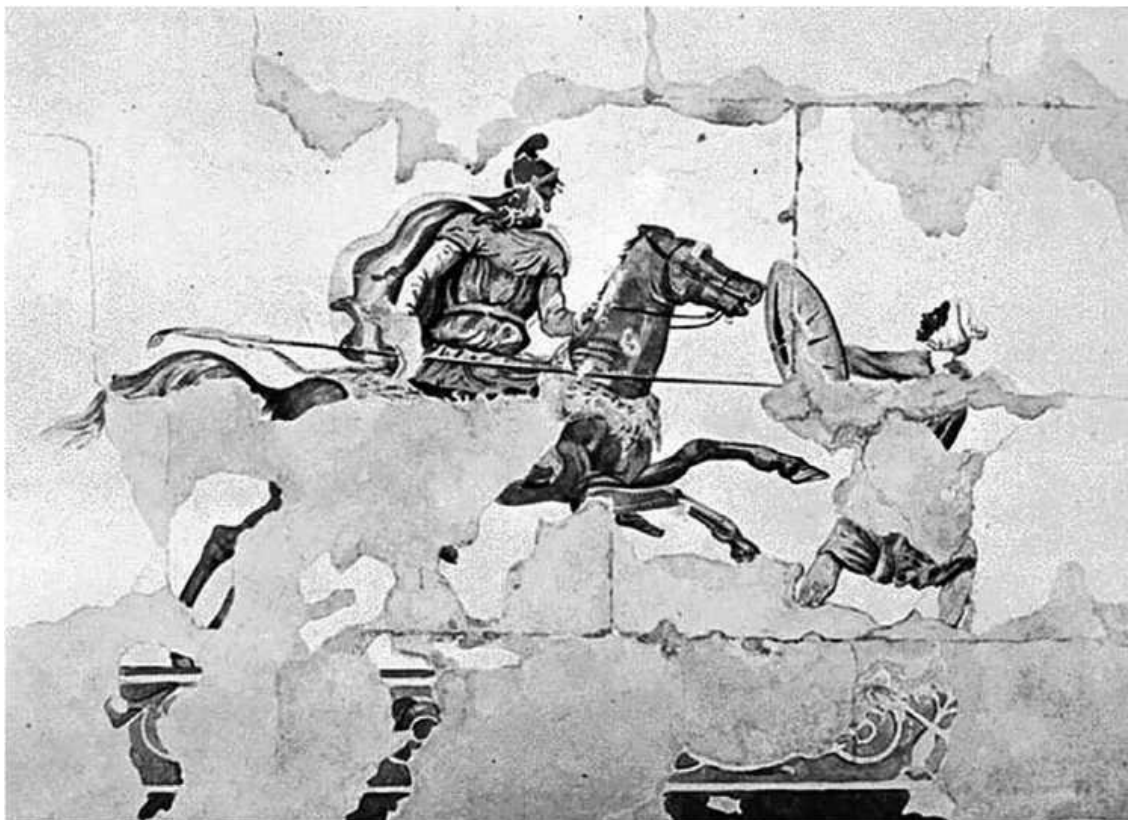
Предположительное изображение конного сариссофора. Фреска из гробницы Кинча. Науса, Греция

Помимо корпуса гетайров в состав кавалерии Филиппа II входили и другие конные отряды. Особый интерес вызывают подразделения, которые античные авторы называют продромами (бегунами) и конными сариссофорами. Н. Секунда пришел к выводу, что « продромы (prodromoi) или разведчики – обозначение, применяемое обычно к четырем илам фракийской легкой конницы, входившим в состав собственно царской армии, но иногда также и к остальным фракийским всадникам » (94,34). По его мнению, продромы и сариссофоры – это одни и те же воины, перевооруженные Александром сариссами вместо дротиков: « При описании событий после пересечения Геллеспонта параллельно встречаются термины «продромы» и «сариссофоры» » (94,35). Аналогичной точки зрения придерживается и П. Фор (100,48). П. Коннолли, напротив, считает, что это были разные подразделения: « ... девятьсот фракийских и пеонийских конных дозорных имели на вооружении дротики. Они шли впереди армии, отыскивали засады и первыми вступали в соприкосновение с противником. Александр использовал их и в качестве застрельщиков. В описании битвы при Гранине упоминаются четыре илы балканских копейщиков. Согласно Арриану («Искусство тактики»), они сражались в тесном строю, сомкнув копья» » (69,68). Как заметил Р. Шеппард, « после переправы через Геллеспонт, термины «продромой» и «сариссофорой» используются в источниках без всякого разбора » (110,95). Рассмотрим, что нам сообщают относительно продромов и сариссофоров античные авторы.