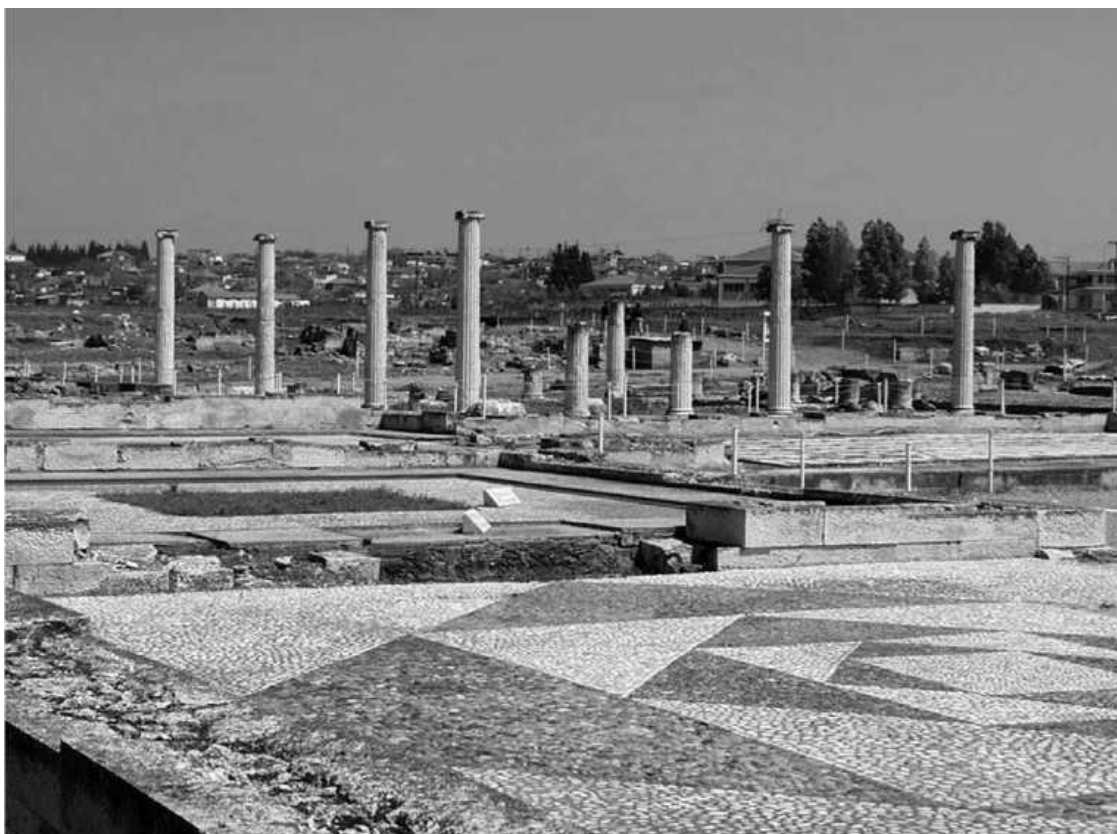
Пелла – столица Древней Македонии.

Согласно свидетельству Фукидида, македонский царь Архелай (413–399 гг. до н. э.) провел некие военные реформы, но в чём был их смысл, неизвестно. В течение длительного времени правителям Македонии удавалось противостоять агрессии соседей, однако делалось это с большим трудом. Ситуация осложнялась вмешательством ведущих греческих полисов во внутренние дела Македонии, что самым негативным образом сказывалось на положении дел в стране. Во время правления Аминты III (392–369 гг. до н. э.) разразилась ожесточенная война между македонянами и иллирийцами во главе с царем Бардилом. Одновременно начались боевые действия на востоке, где лига греческих городов во главе с Олинфом начала наступление на македонские земли. Дошло до того, что олинфяне захватили столицу Македонии Пеллу. В этой критической ситуации Аминта III обратился за помощью к спартамцам и с их помощью отразил вражеское нападение.