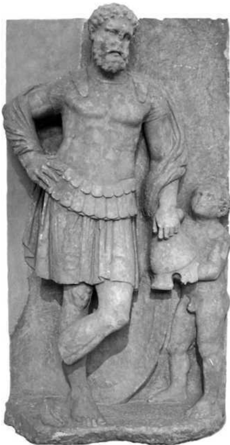
Воин в панцире торакс и с фригийским шлемом. Афины. Национальный Археологический музей.