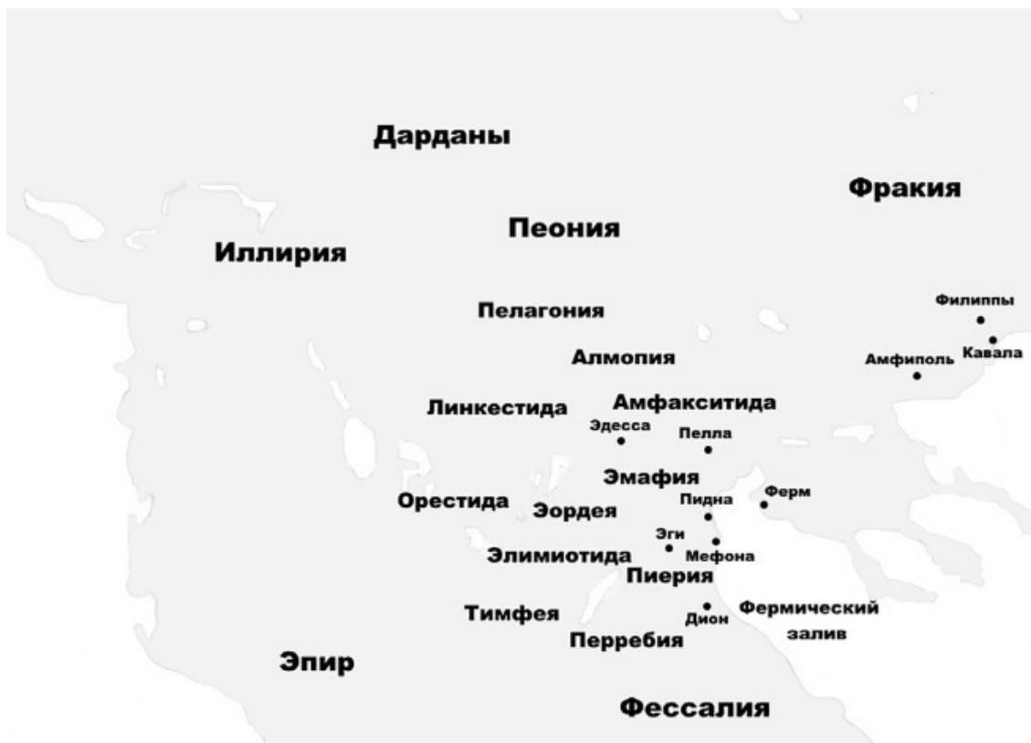
Античная Македония. IV в. до н. э.

Античная Македония располагалась на территории одноименной современной греческой провинции и частично Республики Македония. Исторически страна делилась на две части – Верхнюю Македонию и Нижнюю Македонию. К Нижней Македонии относились плодородные земли приморской области Пиерии, а также области Анфемунт, Грестония, Бисалтия и Мигдония. В состав Верхней Македонии входили Линкестиды, Эордея, Тимфея, Пелагония, Элимиотида и Орестиды. В отличие от Нижней Македонии, эти горные регионы не отличались плодородием, поэтому местное население в основном занималось скотоводством. Возможно, именно жителей Верхней Македонии подразумевал Александр Великий, когда во время мятежа в Описе обращался к бунтующим солдатам: «Филипп застал вас нищими-бродягами; одетые в козухи, пасли вы в горах по несколько штук овец и с трудом отстаивали их от иллирийцев, трибалов и соседей-фракийцев» (Арт.Анаб.ІХ,9). До правления Филиппа ІІ Верхняя Македония лишь номинально подчинялась царям из династии Аргеадов, что самым негативным образом сказывалось на обороноспособности страны.