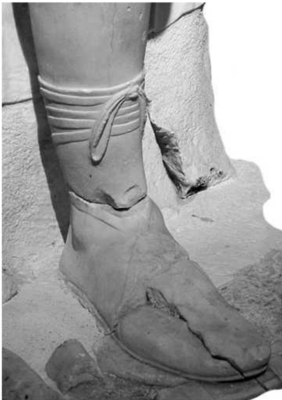
Македонская обувь. Фрагмент статуи Александра Великого из Перге. Археологический музей Антальи.