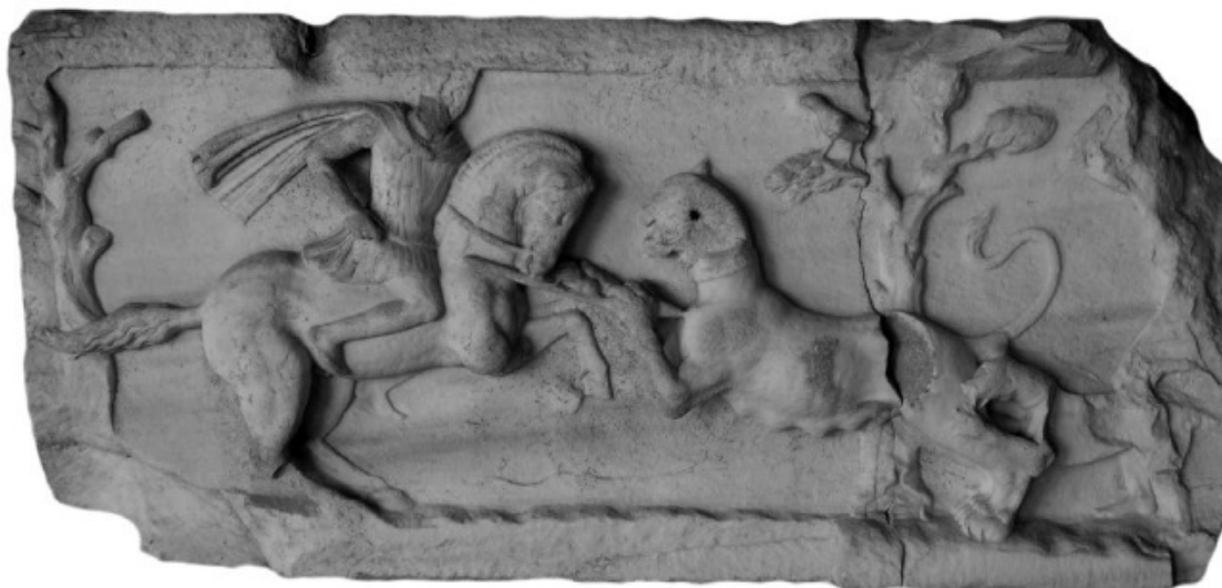
Изображение всадника на охоте. Родос, Археологический музей.