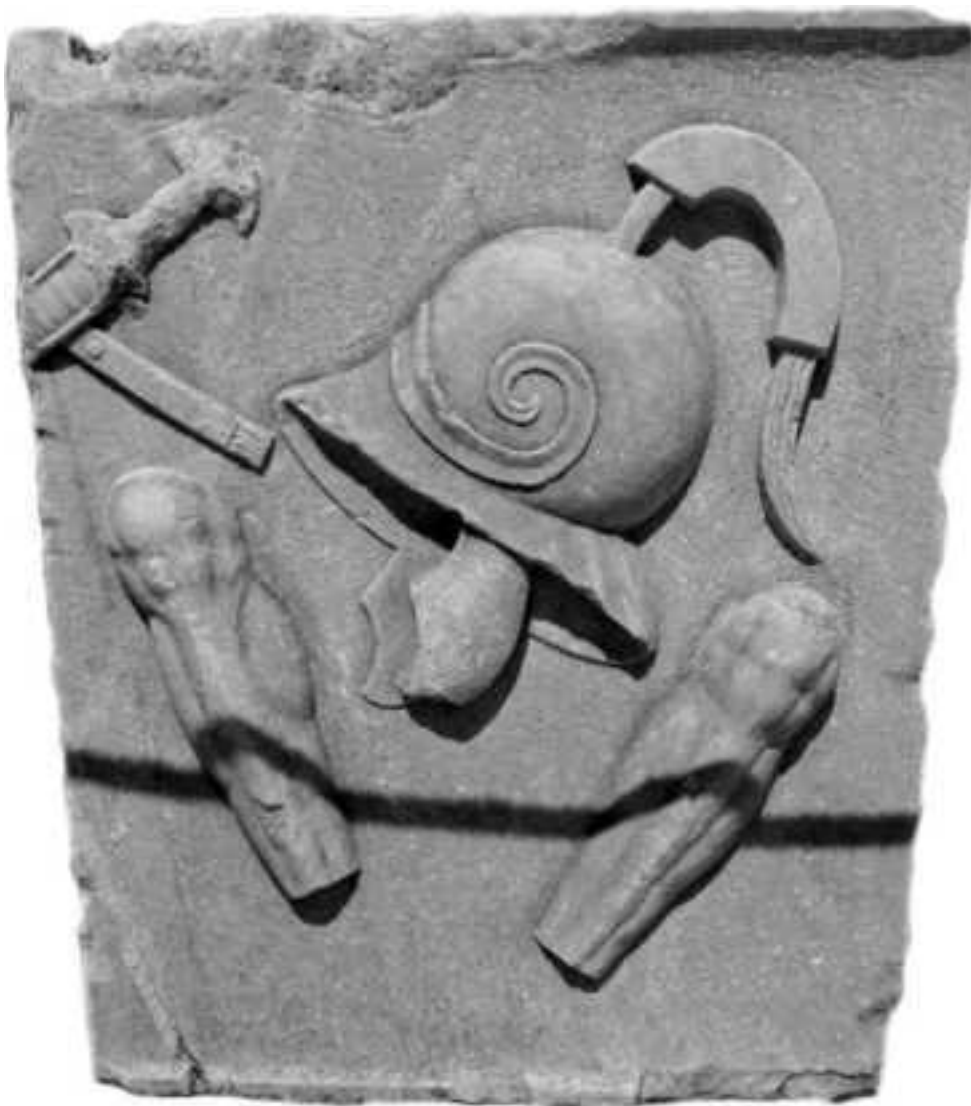
Шлем и поножи. Эфес.

более страшного и потому ощутил испуг и замешательство, и нередко впоследствии вспоминал об этом зрелище и о впечатлении, которое оно оставило» (Аем.19).