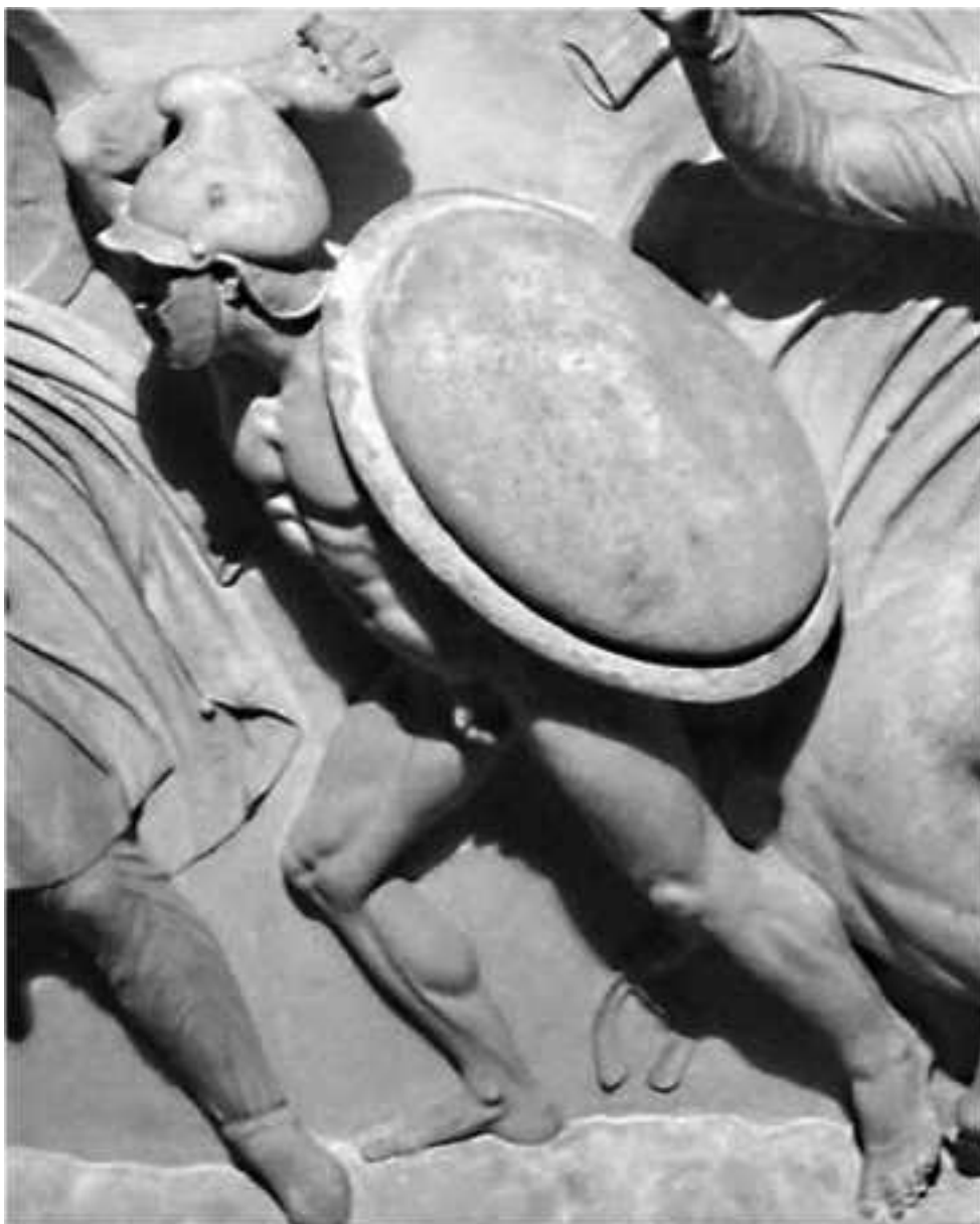
Предположительное изображение гипасписта на Сидонском саркофаге. Стамбул. Археологический музей

Мобильные войска в армиях Филиппа II и его сына в основном набирались среди племен и народов, находившихся в той или иной степени зависимости от Македонии. Это были агриане, фракийцы и иллирийцы, хотя среди легковооруженных воинов числились греки и македоняне. Информации об этих воинских контингентах сохранилось немного. Однако благодаря Диодору Сицилийскому нам известна численность данных подразделений: «Одрисов, трибаллов и иллирийцев следовало за ним пять тысяч; лучников, так называемых агриан, тысяча» (Diod. XVII,17). Обратим внимание, что в список не вошли мобильные войска греческих союзников.