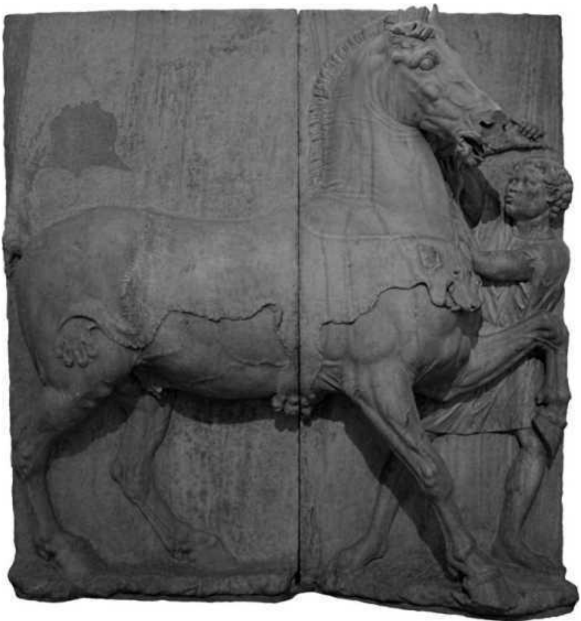
Изображение коня. Афины. Национальный Археологический музей.

только выходцы из собственно Македонии, но и эллины, перешедшие на службу к Филиппу и получившие от царя земельные пожалования. По свидетельству Афиней, гетайров было восемь сотен, но в дальнейшем их число увеличилось. Формировалась тяжеловооруженная конница по территориальному принципу, каждая ила набиралась в определенном регионе. У Арриана есть упоминание об илах «анфемусийской, предводителем которой был Перид, сын Менесфея, и так называемой «Белоземельной» – под командой Пантордана, сына Клеандра» (Anab.11,8). Во время кампании против трибаллов Александр приказывает Гераклиду и Сополу «вести на левое крыло всадников из Боттией и Амфиполя» (Arr.Anab.I,2). Когда после высадки в Малой Азии Александр проходил мимо города Лампсак, «с ним шла ила «друзей» из Аполлонии, которой командовал Сократ, сын Сафона» (Arr.Anab.I,12). Не исключено, что кавалерия гетайров условно делилась на конницу из Верхней и Нижней Македонии, на что косвенно указывает следующее свидетельство Арриана: «Александр, выманив трибаллов из леса, приказал Филоте взять всадников, набранных в Верхней Македонии» (Arr.Anab.I,2). Но это лишь предположение.