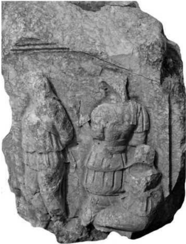
Один из изображенных на рельефе воинов носит панцирь