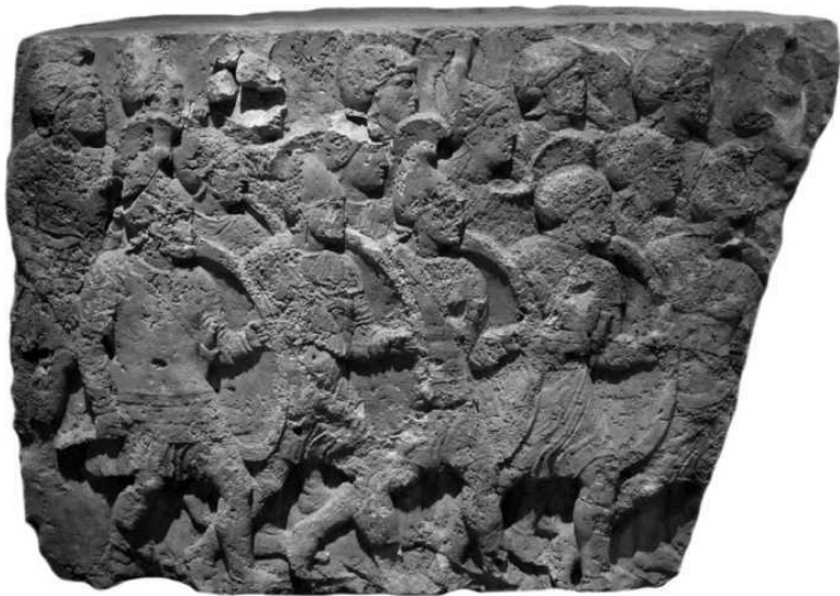
Македонская фаланга. Археологический музей Анталы.

Время, проведенное Филиппом в Фивах в качестве заложника, не прошло для него даром. Будучи хорошо знаком с военной организацией фиванцев, базилевс сделал в своей фаланге два радикальных отличия от классической греческой фаланги – увеличил длину копий и значительно углубил строй. Вместо традиционного копья была введена длинная пика сарисса, которую надо было держать двумя руками. Длина сариссы остается темой бесконечных дискуссий, по-