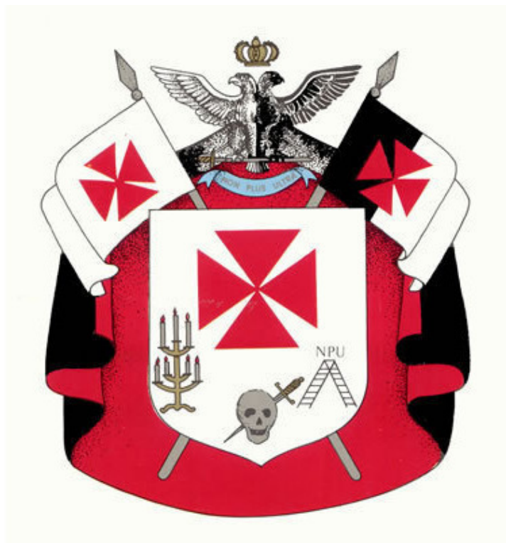
Герб Рыцарей Кадош

Если человек признает существование Единого Бога (в любых терминах и определениях) и бессмертие души, то да, он может вступить фактически в любое послушание в России. Если человек этого не признает – он может вступить только в Великий Восток народов России, куда принимают и атеистов тоже.