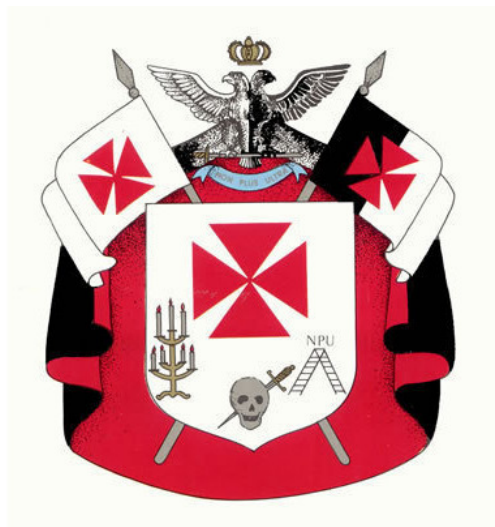
Герб Рыцарей Кадош

Если человек признает существование Единого Бога (в любых терминах и определениях) и бессмертие души, то да, он может вступить фактически в любое послушание в России. Если человек этого не признает – он может вступить только в Великий Восток народов России, куда принимают и атеистов тоже.