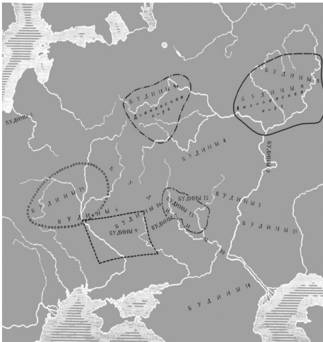
Размещение будинов различными исследователями

Карта, которая отражает различные мнения о местоположении будинов, производит удручающее впечатление; она свидетельствует о том, что авторы, заставляющие обитать будинов в тундре, Пруссии, прикаспийской пустыне, руководствуются не системой взглядов Геродота, а какими-то случайными признаками, вырванными из контекста и сильно обработанными бесконтрольным воображением.