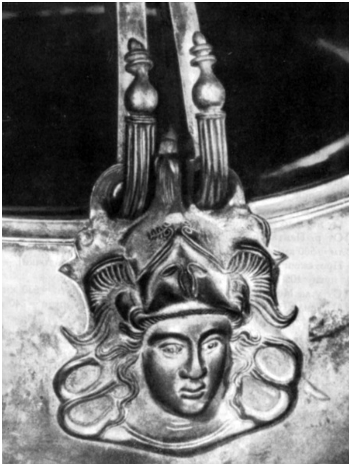
Голова Афины на ситуте V в. до н. э. Из находок на затонувшем челне. Р Супой (левый приток Днепра) у с. Песчаное

Протяжение скифского четырехугольника в глубь материка должно быть значительным. 4000 стадий это – 710 км. Конечно, пути, особенно в северных лесистых местах, не могли быть прямолинейны, но ориентировочно северная граница Скифии в представлении Геродота проходила примерно по 53^{\circ} северной широты, т. е. вдоль Припяти, через Чернигов на Курск и далее на Воронеж. У нас нет никакой уверенности, что скифский тетрагон был геометрически правильным квадратом. Включение Серета, Прута и истоков Днестра в Скифию на западе и низовий Дона на востоке уже превращает квадрат в опрокинутую трапецию, у кото-