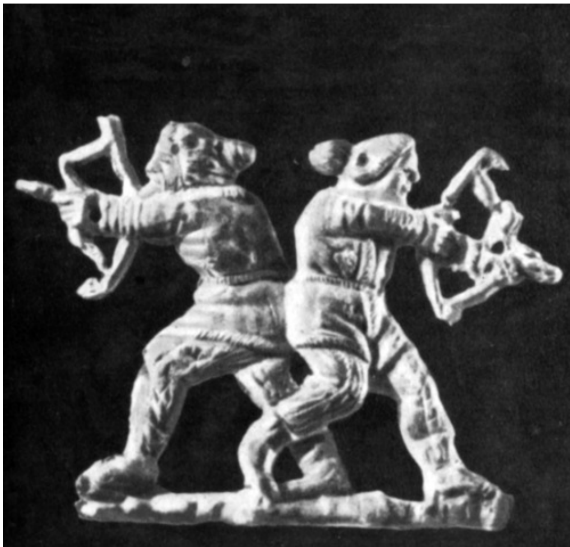
Скифы в бою. Золотая бляшка из кургана Куль-Оба, IV в. до н. э.

Именно здесь, на берегу Боспора кончались поселения скифов, кончалась Скифия. Естественно, что Геродот определял не извилистую береговую линию Крыма, а крайний рубеж скифов на берегу Понта у входа в Меотиду и определял его, как и западную половину стороны скифского квадрата, по сухопутной дороге.