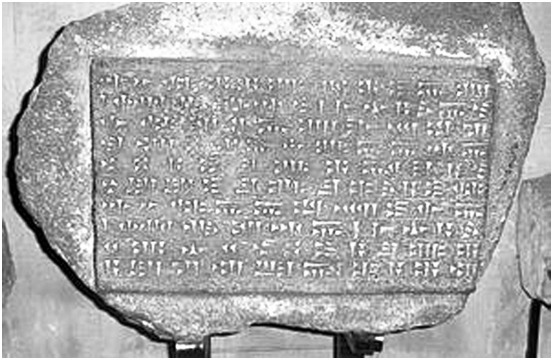
Находка 1958 года

Крепость Эребуни, основанная в 782 году до н. э. в качестве опорного пункта урартов в Араратской долине, положила начало городу Еревану, нынешней столице Армении. Названия «Эребуни» и «Ереван» созвучны и имеют несколько толкований-переводов. Согласно наиболее распространенному в армянском народе толкованию, которое учеными не признается, название «Ереван» произошло от слова «еревац» («появился» или «стал виден»). Якобы именно это воскликнул Ной, увидев сушу после схода вод Всемирного потопа. А сам Ереван построен на том месте, где Ной жил до потопа.