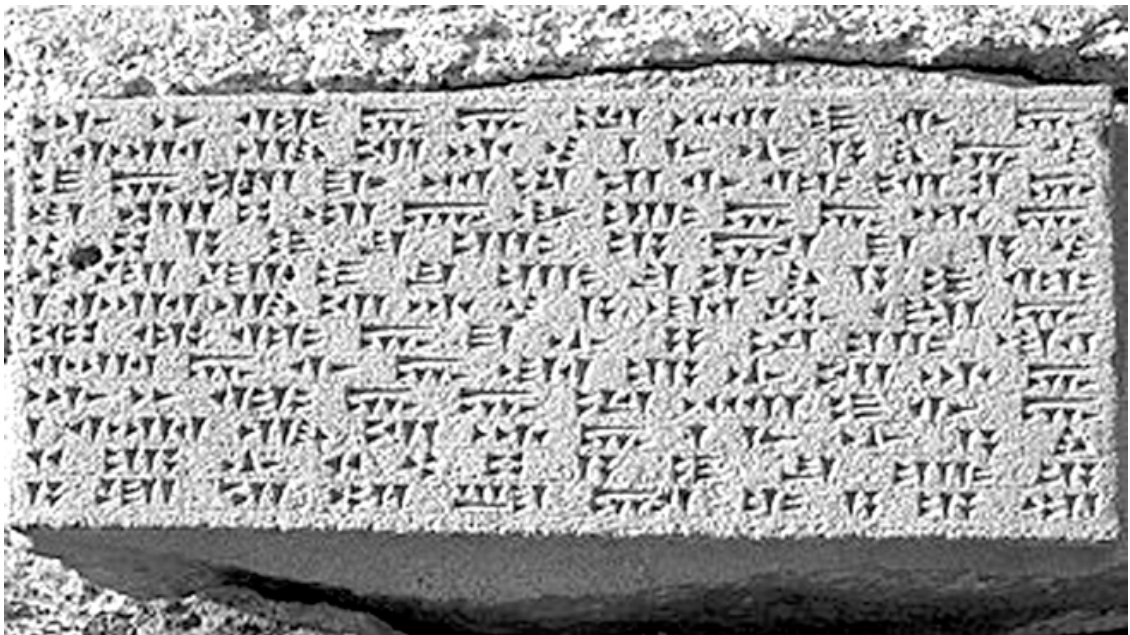
Находка 1950 года

Первая половина XX века выдалась весьма беспокойной, поэтому к археологическим раскопкам на холме Арин-Берд приступили только в 1950 году. Практически сразу же была найдена табличка с надписью: «Величием бога Халди Аргишти, сын Менуа, эту могущественную крепость построил; установил ее имя Эребуни для могущества страны Биайни 10 и для устрашения вражеской страны. Земля была пустынной, могучие дела я тут совершил. Величием бога Халди Аргишти, сын Менуа, царь могущественный, царь страны Биайни, правитель города Тушпы». Спустя восемь лет была обнаружена идентичная надпись на камне, некогда заложенном в стену.