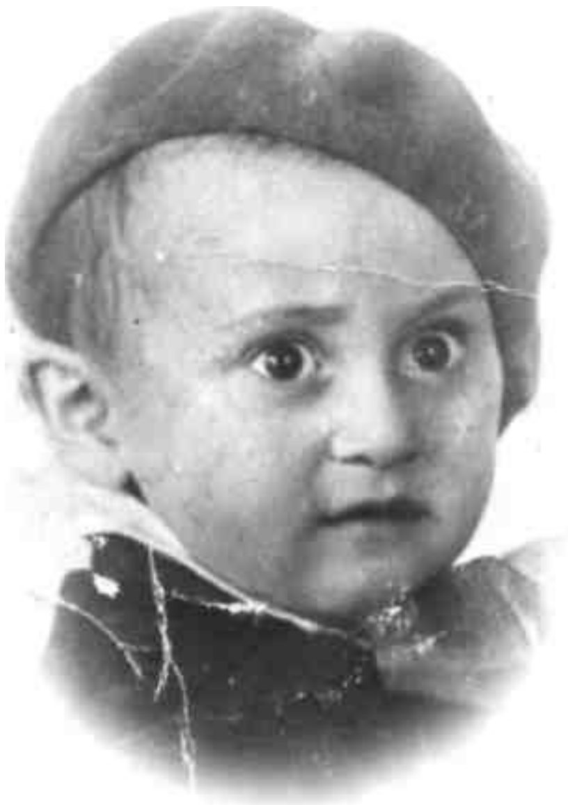
«ЧЕСТНОЕ СЛОВО. ЭТО – Я»

Время шло, мои родители продолжали материально поддерживать всех врачей нашего города. Однажды мама повела меня к самому известному педиатру профессору Сегалу. Помимо того, что он был прекрасным специалистом, он еще славился в Киеве как известный остроумец. Когда меня привели к нему, я был в мохнатой меховой шубке, в меховой шапке и поверх всего обмотан шерстяным шарфом.