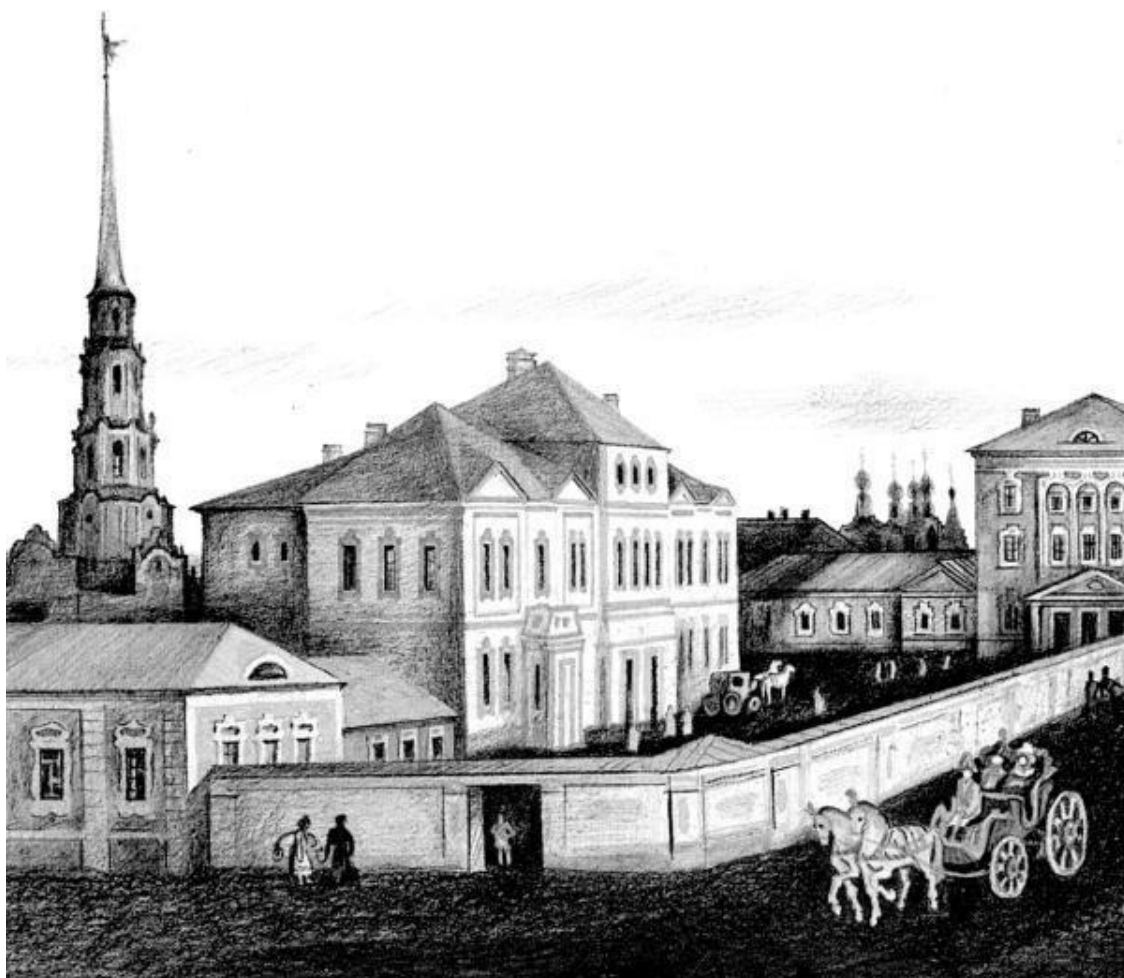
Старый Московский почтамт. Слева – церковь Архангела Гавриила, так называемая Меншикова башня