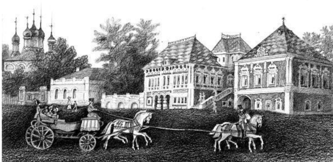
Бывшие палаты бояр Волковых в Большом Харитоньевском переулке

Простота тогдашних нравов выглядит ныне неправдоподобной. Возле ворот устраивались качели, всякие потехи, и на Святках и в Масленицу царь развлекался тут со своими друзьями при всем честном народе. Известные кошунственные процессии шутейного собора проходили по Мясницкой. Сохранились рисунки этих шествий, предводительствуемых Никитой Зотовым, прежним дядькой царя, возведенным в сан папы всепьяного собора: развеселые ряженые в церковных облачениях, с кадилами и хоругвями, верхом на свиньях и бочонках, дудочники и скоморохи. Когда вспомнишь, что происходило это в Первопрестольной спустя всего полтора-два десятка лет после «тишайшего» царя Алексея Михайловича, проводшего полжизни в богомольях по монастырям, то открываются крутые перепутья истории!