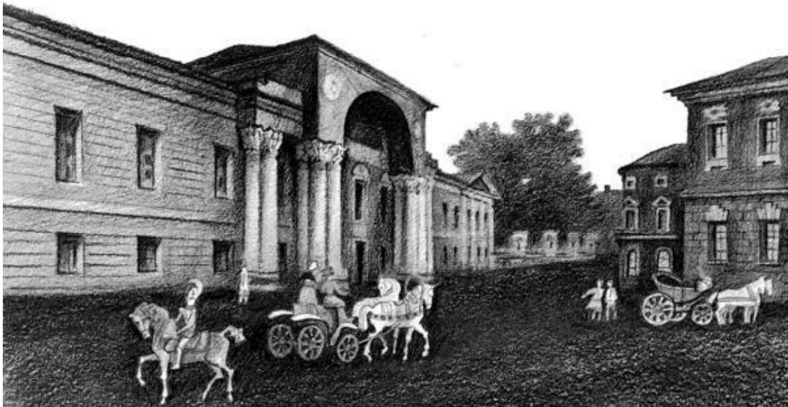
Дом Лобановых-Ростовских, построен Ф.И. Кампорези, последняя четверть XVIII века

Рядом с этим домом совсем врос в асфальт тротуара, обреченно выступив средним ризалитом, с тройкой полуциркульных окон, за красную линию, вовсе ветхий скромный особнячок, некогда принадлежавший сестре Суворова. Под ним – довольно просторные сводчатые помещения из тесаного белого камня старинной кладки. Теперь это – подвалы, но в пятидесятых годах XVIII века, когда строили дошедший до нас особняк, они составляли, очевидно, его нижний этаж.