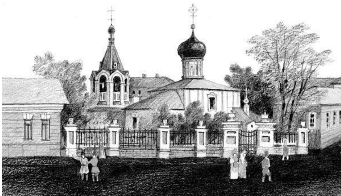
Церковь Успения «на бору», или Гребневской Божией Матери, на Лубянской площади

И еще известно от тех далеких времен, что тот же Иван III поселил вокруг этой церкви после похода на Новгород в 1482 году вывезенных оттуда бояр с семьями. Мясницкая началась тогда от Ильинских ворот и шла оттуда по впоследствии Лучникову и Большому Комсомольскому переулкам. С площадью, тогда Лубянской, а позже Дзержинского, ее связывал узкий переулок.