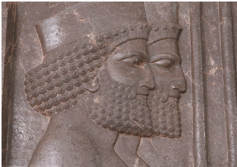
Древние арии в Иране. Рельеф в Персеполисе

На арийском они говорили, дорогой читатель. Но это среди лингвистов упоминать просто страшно. Они и не упоминают. У них так не принято. Видимо, команды, приказа не поступало. А самим – боязно.