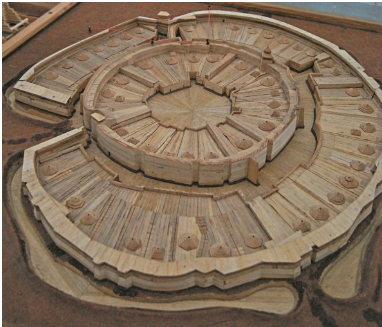
Городище Аркаим на Южном Урале. Современная реконструкция в виде макета

Ситуация примерно ясна. Тем более что наиболее «продвинутые» историко-лингвистические научные статьи, признавая, что вопрос о месте и времени возникновения «индоевропейского» языка остается нерешенным, призывают выйти за пределы археологии и лингвистики и привлечь для решения вопроса «независимые данные», которые позволят