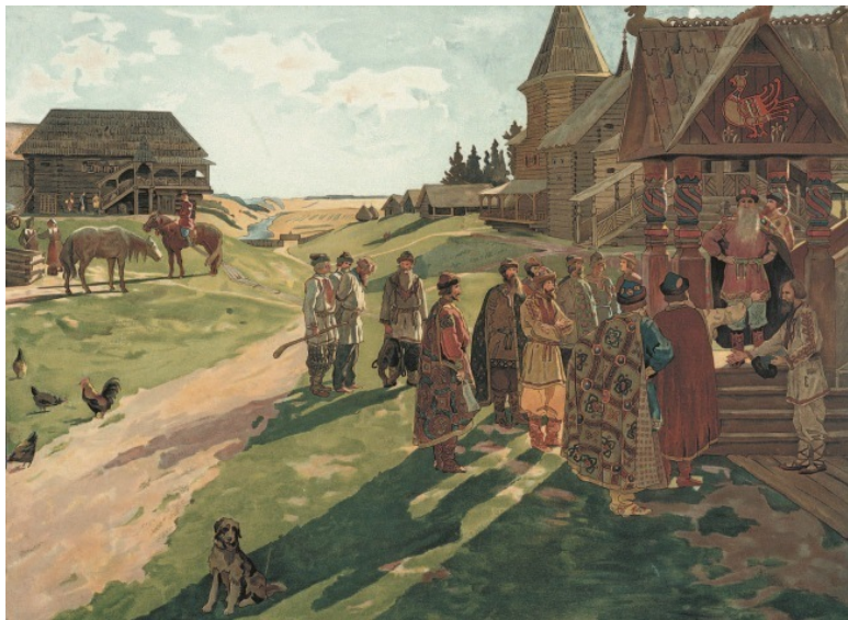
В усадьбе князя. Художник А.Ф. Максимов (1870–1921)

Устраивайтесь поудобнее, уважаемый читатель. Вас ждут некоторые потрясения. Не очень с руки начинать повествование тем, что автор ожидает от своего исследования эффекта разорвавшейся бомбы, но что делать, если так оно и будет?