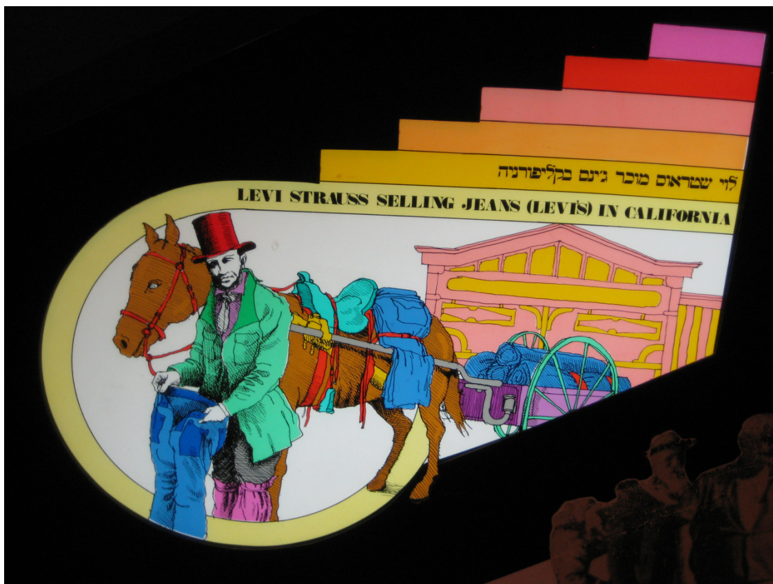
Производители джинсов братья Леви.