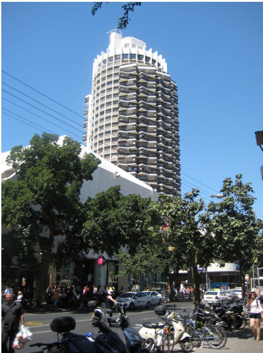
Улица Дизенгоф в Тель-Авиве.

Вдоль набережной идет длинная-длинная пляжная полоса. Здесь расположены фешенебельные отели – Хилтон, Шератон, Ренессанс, Херодс и др. Одно из любимых занятий местных жителей – это спорт. Пока неспешно прогуливаешься вдоль набережной, наслаждаясь солнцем и свежим морским воздухом, мимо проносятся велосипедисты и бегуны. Причем в беге выкладываются так, словно бегут настоящий марафон.