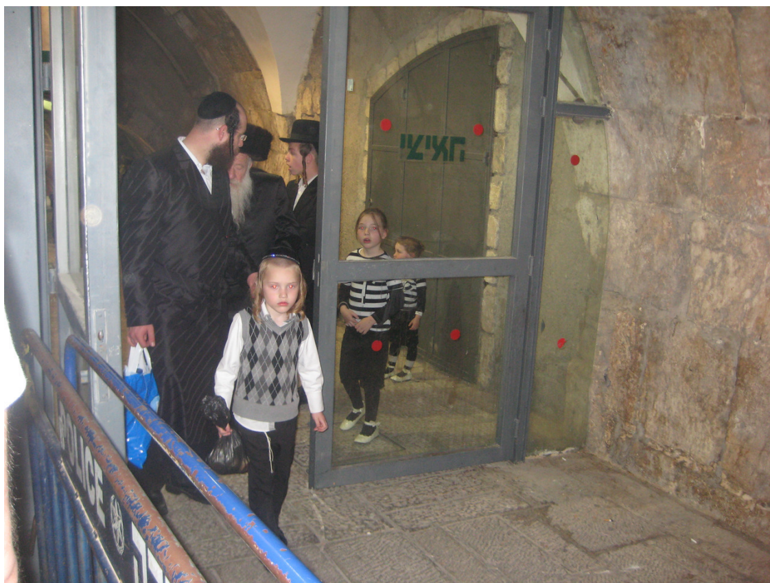
Еще одно семейство (переход к Стене Плача в Иерусалиме).