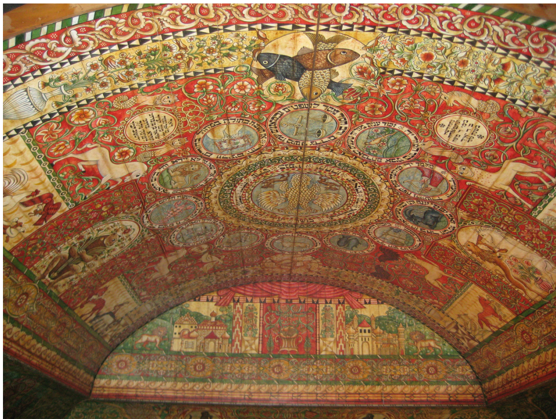
Потолок синагоги в Ходорово. Музей Еврейской диаспоры.

Составители музея – люди с хорошим чувством юмора, поэтому несколько залов украшают забавные панно, на которых изображены люди самых разных профессий, которые дала миру еврейская диаспора. Здесь и еврейский портной, и революционер, и переводчик, и торговец, и производитель тканей, и еврейская бабушка (а что, тоже профессия), и многие другие.