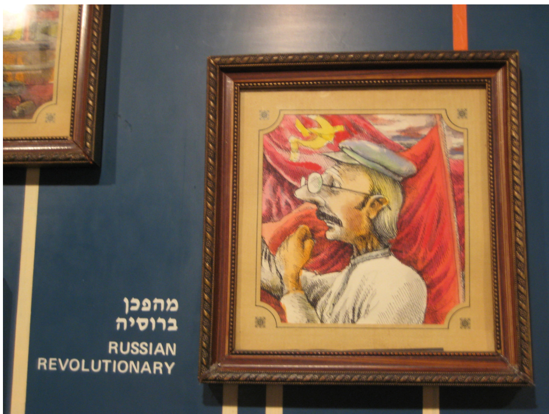
Русский революционер (фрагмент панно).

Кстати, про портного – очередной еврейский анекдот: