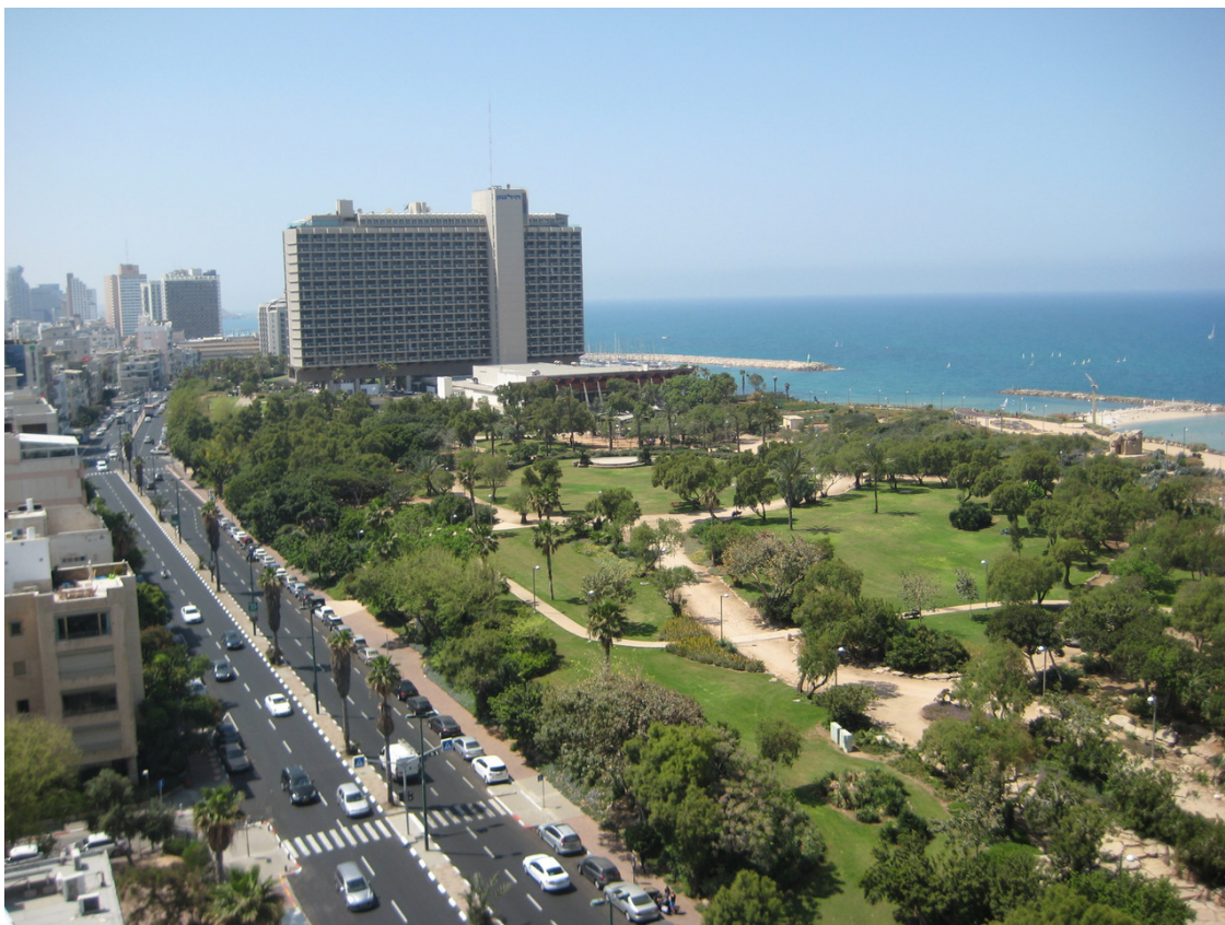
Тель-Авив: вид на ул. Хаяркон и набережную.

Одна из главных улиц Тель-Авива – Дизенгоф. На ней расположены торговые центры, главный из которых – одноименный Дизенгоф – и различные магазины. Сам город очень зеленый, в нем много парков. Улицы широкие, усажены длинными рядами пальм. Есть выделенные велосипедные дорожки и пункты проката велосипедов, к слову довольно дорогие.