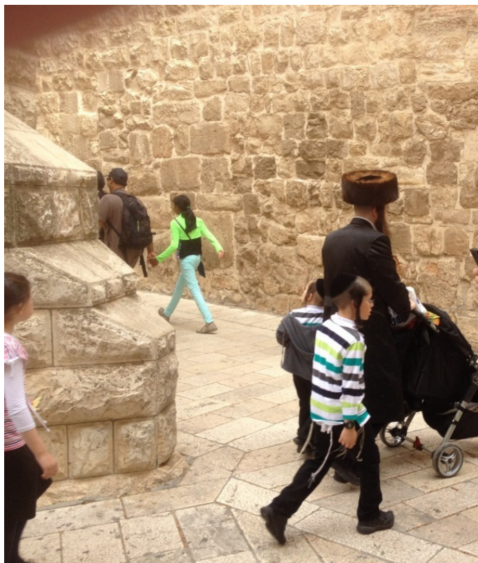
Так выглядят семьи ортодоксальных евреев (Иерусалим).