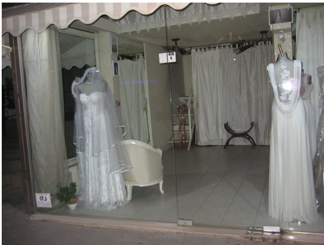
Салон свадебной моды в Тель-Авиве.