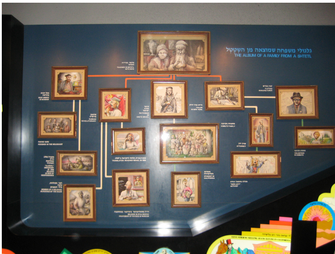
Панно: «Генеалогическое древо» еврейского народа.