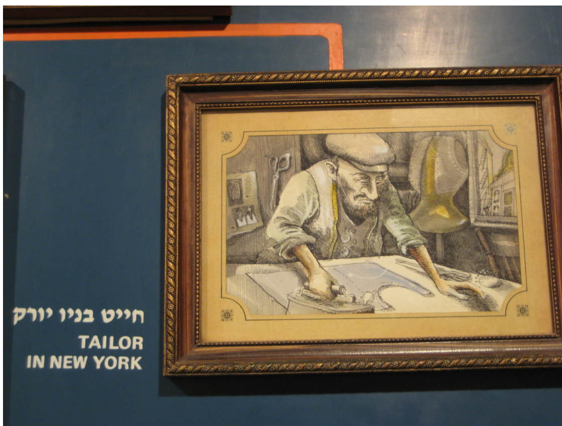
Портной в Нью-Йорке (фрагмент панно).