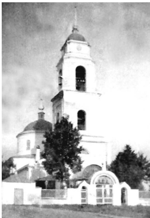
Храм Николая Чудотворца в селе Муромцево