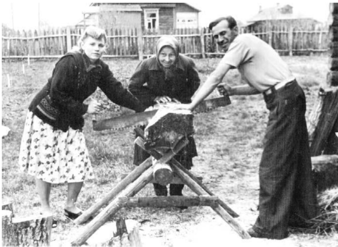
Сельская жизнь в 1950-е годы.

А по сведениям 1886 года село Муромцево относилось к Морозовской волости Дмитровского уезда, в селе было 63 двора, проживало 389 человек.