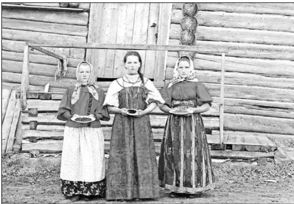
Жизнь русской деревни конца XIX века глазами фотохудожника Сергея Михайловича Прокудина-Горского (1863–1944).

В 1835 году вблизи села в излучине реки Вори возникла Вознесенская бумагопрядильная фабрика (об этом будет сказано дальше). В 1840 году в селе была построена церковь св. Николая чудотворца, каменная вместо деревянной.