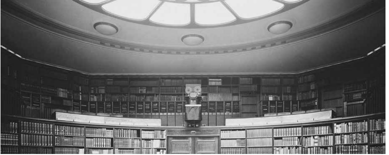
Овальный зал Культурологической библиотеки Варбурга в Гамбурге. 1926 г.