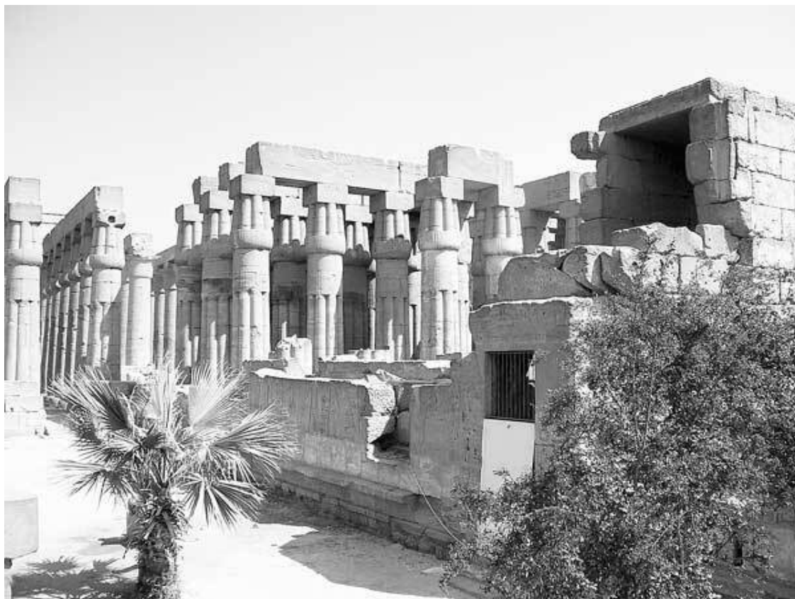
Храм Амона-Ра. Луксор. Египет

Рамсес II начал с подавления беспорядков в Ливии и в Нубии. При смене фараона волнения в провинциях были неизбежны. Но двадцатилетний новый правитель оказался сильным бойцом. Завоеванные территории – это богатство, прежде всего – золотые и серебряные рудники, драгоценные породы дерева. И фараон заботился о сохранности своей сокровищницы.