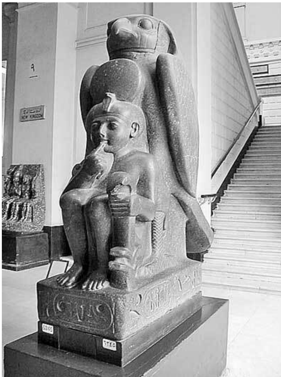
Рамсес II, изображенный и виде ребенка, охраняемого божеством. Каирский музей

Как говорится в одной из надписей, посвященных Рамсесу II, «боги вскрикнули от радости при его рождении». Это, конечно же, дань литературной традиции. Но Рамсес действительно с детства знал, что его предназначение – власть. Именно в нем отец видел преемника. У всех фараонов были гаремы, состоявшие из законных жен и наложниц, и множество детей. Но, несмотря на то, что у Рамсеса, безусловно, были братья, Сети I без колебаний избрал одного сына, который должен был прийти ему на смену.