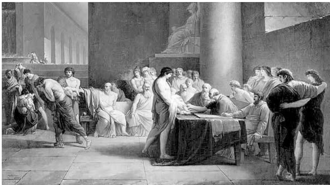
Жан-Пьер Сен-Урс. Отбор детей в Спарте. 1785

даже застонать от боли. Слабость – позор для мужчины. Любое проявление слабости в этом обществе означало, что ты уже не человек.