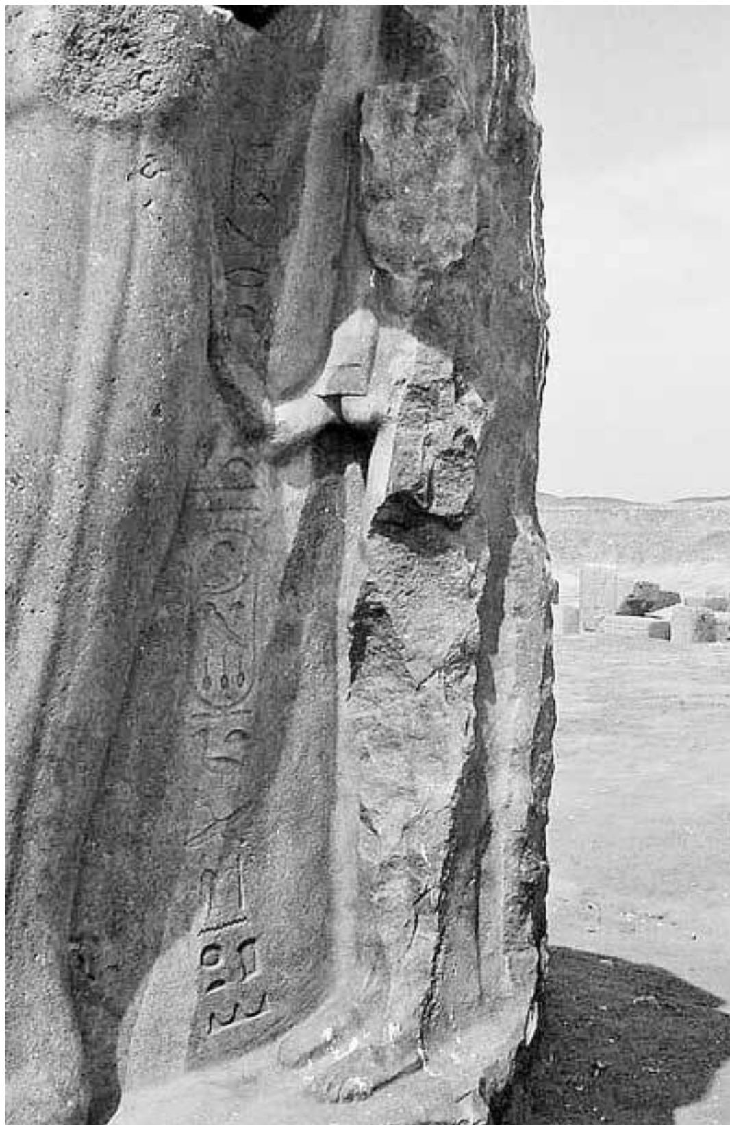
Фрагмент колосса Рамсеса II с изображением Маатхорнефрура в Танисе

Есть предположение, что на бракосочетание прибыл сам хеттский царь. Впрочем, многие египтологи в этом сомневаются. Так или иначе, церемония была торжественная и пышная. На сохранившихся изображениях видно, как огромная процессия несет приданое – золото и другие сокровища. Из Малой Азии в Египет гонят целые стада скота. Это немалая ценность –