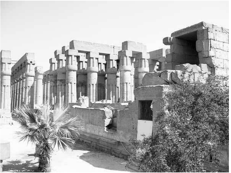
Храм Амона-Ра. Луксор. Египет

ми, как свинья и осел. Но ведь Сетха (или Сети) – еще и имя отца Рамсеса II... К тому же Сетха считался богом чужеземцев. А Египет все энергичнее покорял окружающие народы.