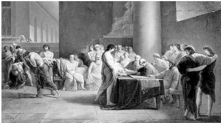
Жан-Пьер Сен-Урс. Отбор детей в Спарте. 1785

Чтобы воспитать мальчика сильным, его изгоняли за пределы города, и он должен был сам обеспечить себе пропитание, вообще – суметь выжить. По легенде, Леонид где-то раздобыл лисенка и спрятал под одеждой. Зверек прогрыз мальчику живот, но тот терпел боль, чтобы достойно пройти испытание. Итак, Леонид получил подготовку в основном физическую, образование – военное.