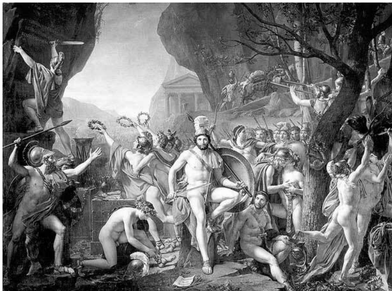
Жак Луи Давид. Леонид при Фермопилах. 1814

высокие, но там много труднопроходимых мест. С одной стороны – скала, с другой – крутой обрыв к морю. Узкая тропа – примерно в 60 метров шириной. Там может одновременно пройти одна колесница. Две разъедутся с трудом. В таком месте можно попытаться малыми силами сдержать огромное войско.