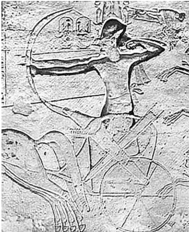
Рамсес II повергает врагов в битве при Кадеше. Рельеф храма в Абу-Симбел