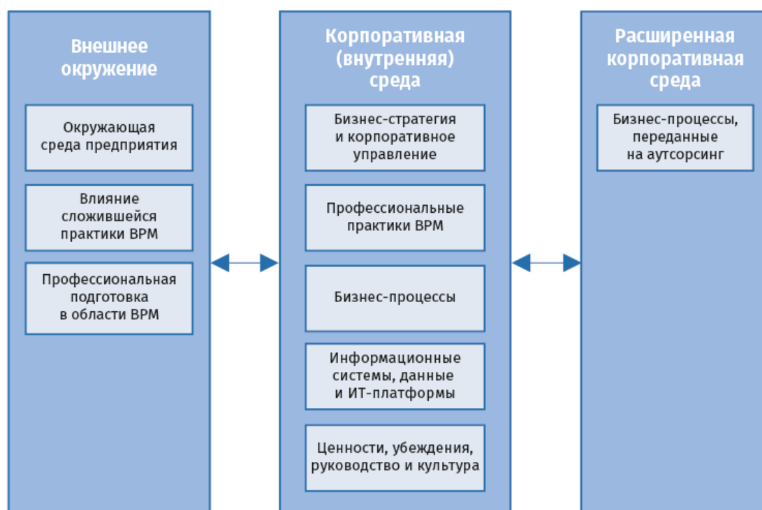
Рис. 2.2. Профессиональная сфера BPM

Профессиональная сфера BPM состоит из девяти компонент: