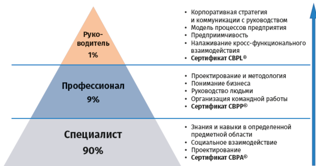
Рис. 1.1. Пирамида руководителей

Следующая диаграмма показывает путь профессиональной карьеры. На старте специалист овладевает навыками и компетенциями базового технического уровня. Со временем он приобретает управленческие навыки и компетенции и становится руководителем, который руководит техническими специалистами, реализующими более масштабные проекты или инициативы. И наконец, он приобретает навыки и компетенции для управления бизнес-единицей или подразделением организации и поднимается на уровень руководителей верхнего звена – руководителя руководителей.