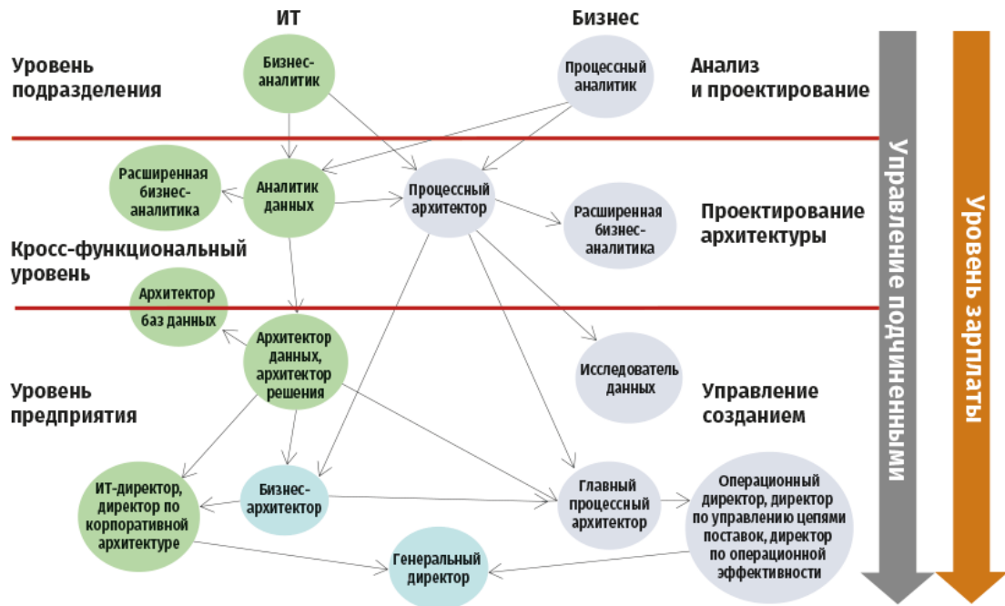
Рис. 1.2. Разнообразие траекторий карьеры

Идея здесь та же самая: с развитием навыков и компетенций вы естественным образом поднимаетесь по лестнице организационной иерархии. Параллельно с приобретением навыков и компетенций в области BPM вы приобретаете управленческие навыки и лидерские компетенции (управление людьми).