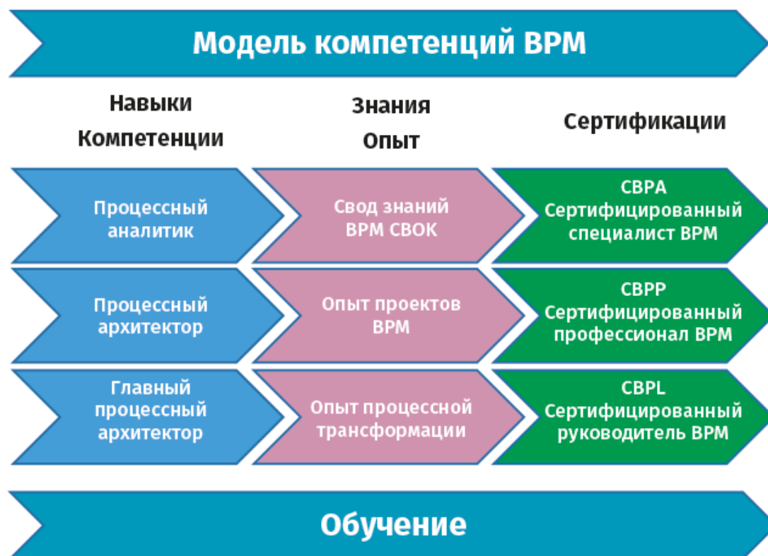
Рис. 1.3. Модель компетенций BPM

Требования к кандидатам на пути от начального уровня СВРА к руководящему СВРЛ показаны на диаграмме ниже. Предварительное условие для получения сертификата СВРА – наличие степени бакалавра или один год профессионального стажа. Уровень СВРР требует как минимум четырехлетний стаж и рассчитан на специалистов, способных продемонстрировать успешные проекты BPM. Для СВРЛ необходимы как минимум десятилетний стаж и проекты изменения бизнес-процессов уровня предприятия, включающие как минимум один масштабный кросс-функциональный процесс.