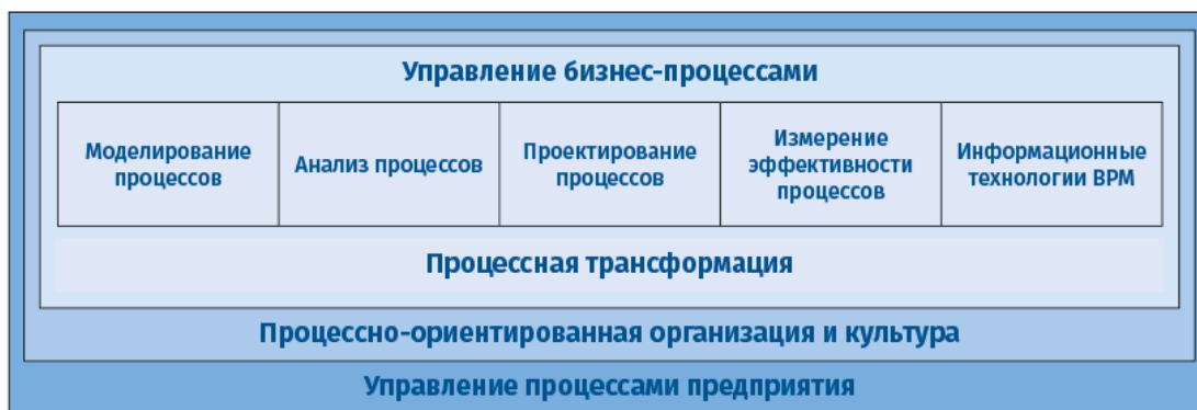
Рис. 2.1. Области знаний BPM

Области знаний – это целостные наборы понятий, терминов и видов деятельности, составляющих профессиональную область. Области знаний, относящиеся к управлению бизнес-процессами, представлены на следующем рисунке: