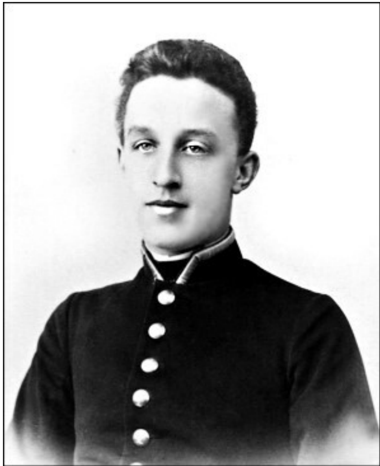
А. Блок в юности