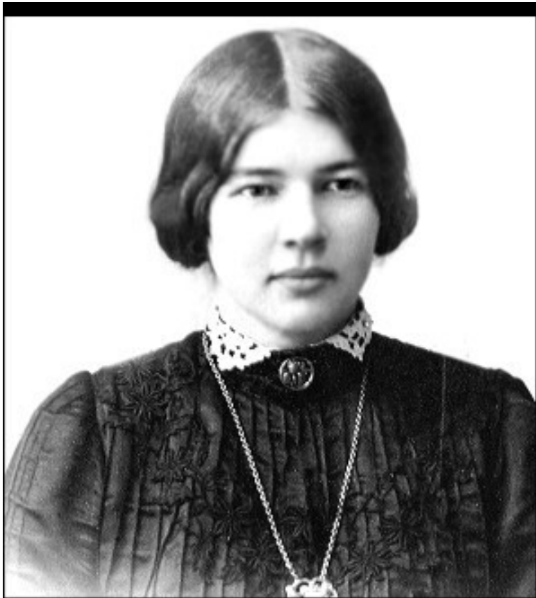
Л.Д. Менделеева в юности

Несмотря на все семейные неурядицы, Люба выросла весьма уверенной в себе: «Я люблю себя, я себе нравлюсь, я