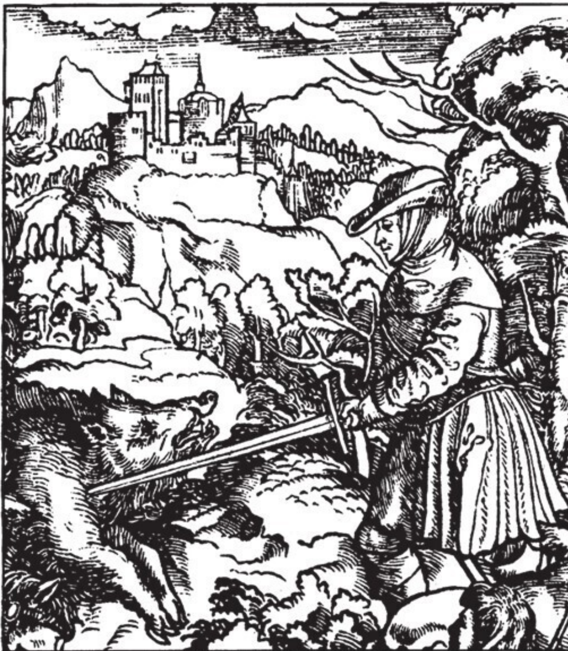
Рис. 3. Максимилиан I, убивающий кабана ударом двуручного меча. Гравюра из книги Theuerdank (1517)

надежно удержать в одной руке. Чтобы держать меч двумя руками, над эфесом прикреплялась дополнительная рукоятка (так называемый pas d'ane 4 ). Трубочатые зажимы имели головку в форме рыбьего хвоста. Типичные образцы можно найти в Коллекции Уоллеса (в Лондоне), в Дрездене и в Музее оружия в Золингене 5 .