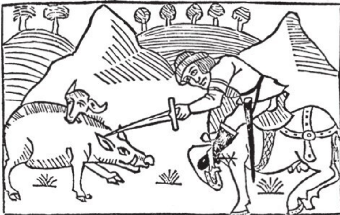
Рис. 2. Охотник с мечом в руках. Гравюра из «Книги королевских манер» (1486)

В 1381 г. М. де Турне, оружейник короля Франции, изготовил два «больших разных меча... для правителя и монсеньора де Валуа, чтобы убивать кабанов». К сожалению, сколько-нибудь подробного описания самих мечей для охоты на кабанов не сохранилось. Тем не менее к концу XV в. уже существовал тщательно разработанный тип охотничьего меча для конного охотника. Одним из самых совершенных образцов можно считать меч Максимилиана I, находящийся в Историческом музее в Вене (фото 1).