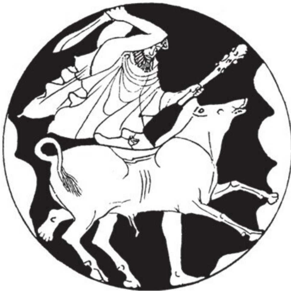
Рис. 1. Греческий охотник с махайрой, нападающий на дикого кабана. Рисунок на этрусской вазе V в. Коллекция Галлатина

Скифские воины на лошадях, вооруженные луком и стрелами, служившими в качестве основного оружия, использовали акинак – короткий меч в изысканно украшенных ножнах. На сарацинском серебряном изделии примерно 400500 гг. н. э. можно разглядеть королевских охотников, закалывающих и разделяющих львов прямыми обоюдоострыми мечами. Пожалуй, художник несколько преувеличил их деяния, поскольку практически подобные действия были трудноосуществимы. Все приведенные нами примеры касаются боевого оружия, тогда как по имеющимся изображениям видно, что специальный охотничий меч появился не ранее XV в.