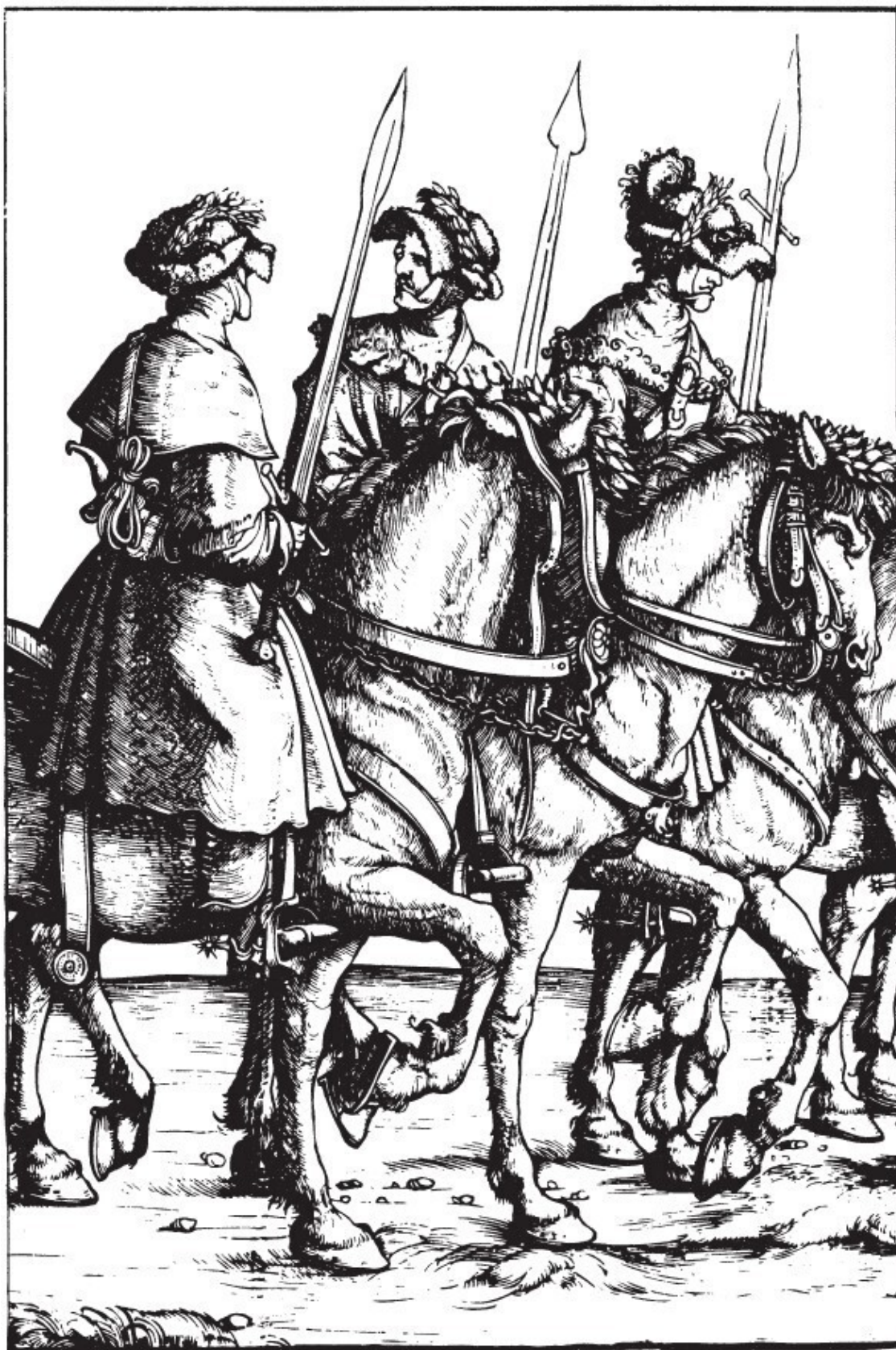
Рис. 5. Охотники с мечами для охоты на кабанов. Фрагмент гравюры из книги «Триумф императора Максимилиана» (1526) 28