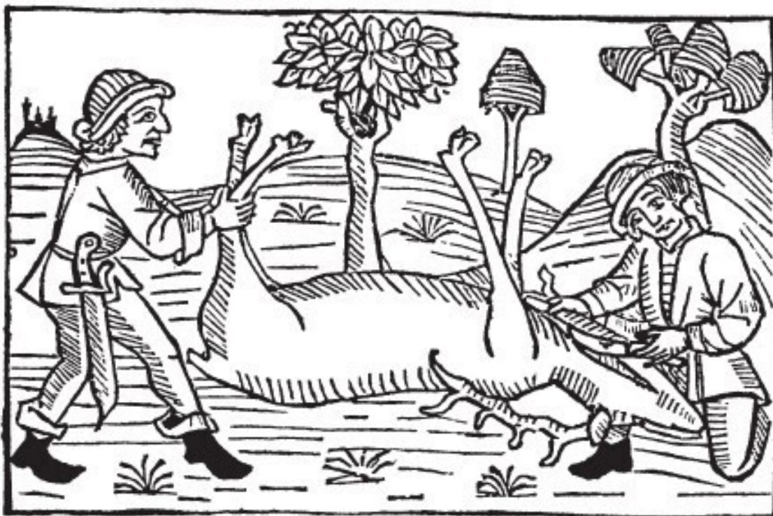
Рис. 7. Разделка туши. Гравюра из «Книги королевских манер» (1486)

Начиная примерно с 1500 г. большинство коротких охотничьих мечей получают более изысканный эфес. На фламандской серии гобеленов, известных как «Охота на единорога», датируемой примерно 1500 г. и сегодня хранящейся в Метрополитен-музее в Нью-Йорке, один из охотников носит короткий прямой меч, в ножнах которого находится небольшой нож. У рукоятки имеется щиток для костяшек пальцев, наклонная гарда и асимметричный эфес.