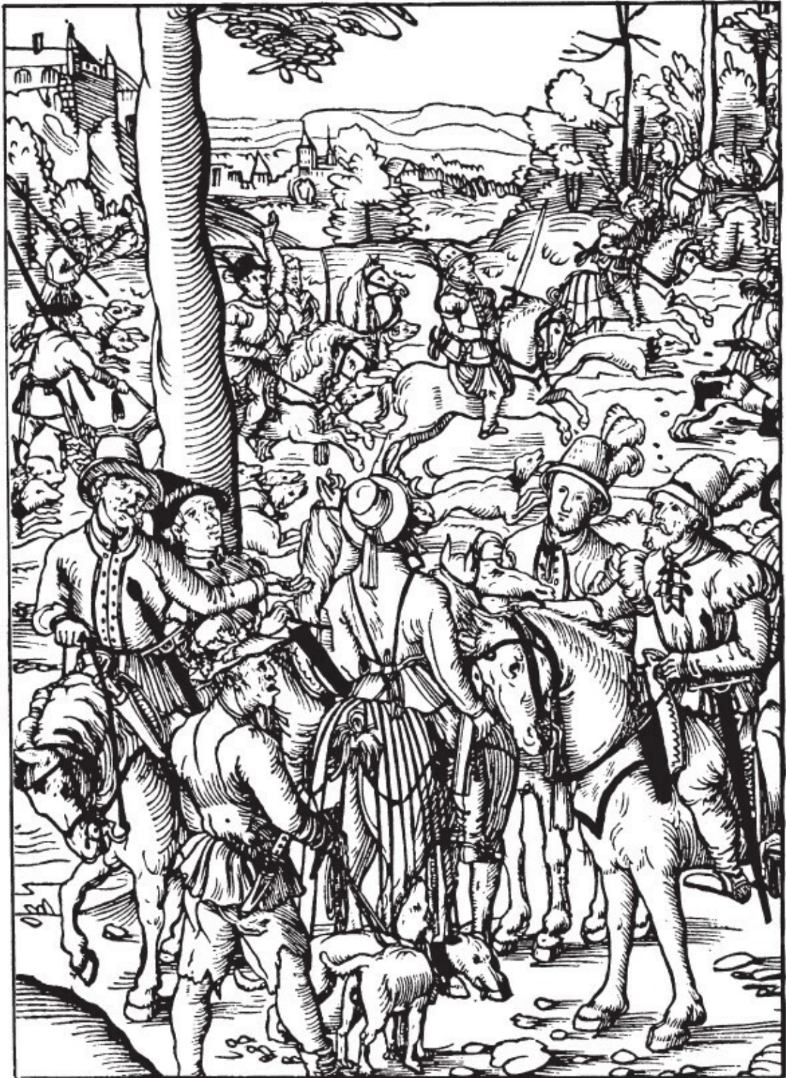
Рис. 4. Охотники с полтораручными мечами. Фрагмент гравюры неизвестного немецкого художника

красный образец с изящно отделанными ножнами находится в Арсенале в Берлине. Более простые мечи имеют две пластинки из оленьего рога, приклепанные с каждой стороны лезвия, которые выполняют роль зажимов (фото 2).