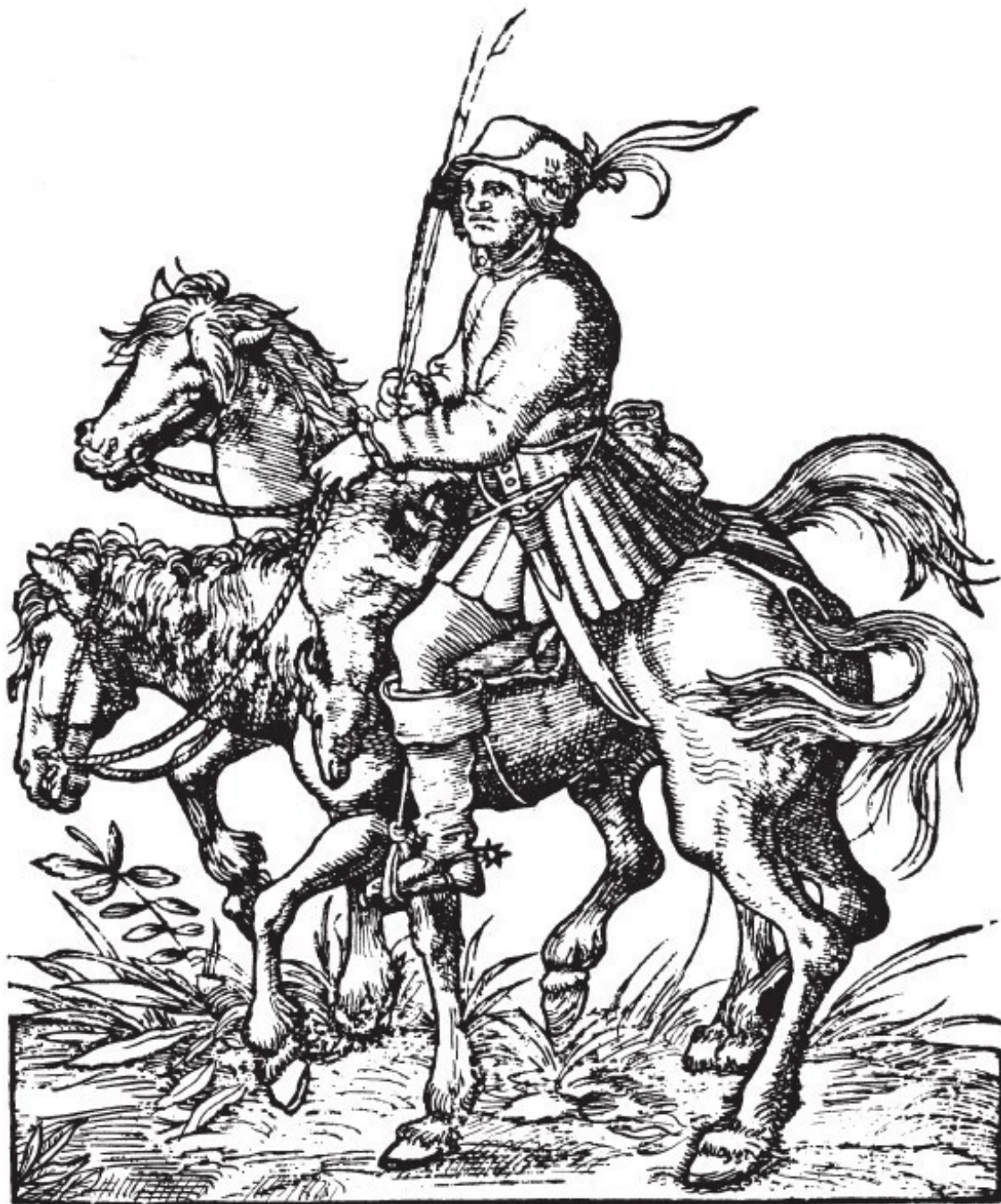
Рис. 8. Возвращение с охоты. Изображен охотник с коротким охотничьим мечом. Из книги Ander Theil des neuen Kunstbuchs (1580)