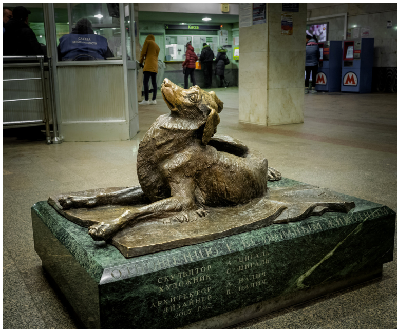
Фото 2. «Памятник дворняжке»