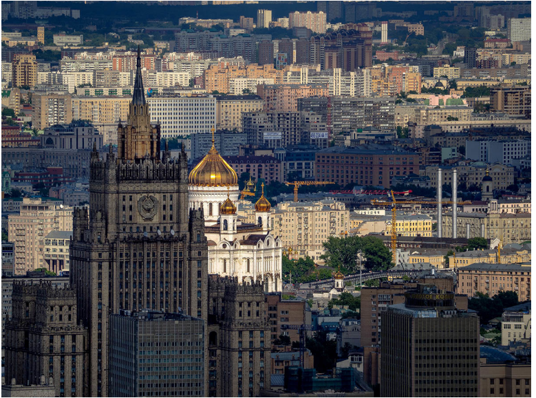
Фото 3. «Вид на центр Москвы с башни Эволюция. Москва-Сити»

полноформатных никонов и кэнонов. А объектив 300 мм на олимпусе работает так же, как супертелевик 600 мм на фул-фрейме (см. фото 3).