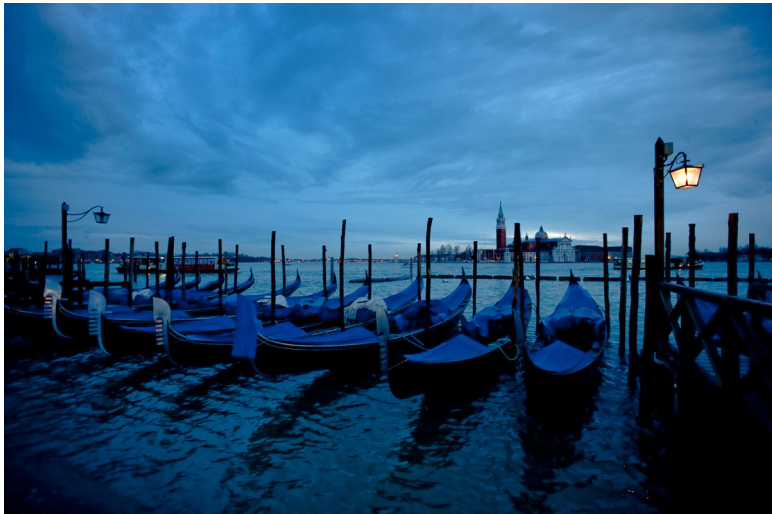
Фото 1. «Венеция. Вечер на набережной» Камера Apple iPhone 3S

Однажды, возвращаясь домой после деловой поездки, я спустился в метро и увидел обронзевшую бездомную псину, о гибели которой какое-то время назад скорбела вся прогрессивная общественность нашего города. Об этой скульптуре я ничего не знал и, поскольку никона с собой не было, сделал пробные кадры новеньким в тот момент смартфоном Sony Xperia Z3. Позже я повторил примерно такой же кадр и никроном. При сравнении еще раз убедился, что телефонный файл с его 17 мегапикселями на крошечной матрице не то же самое, что 16 на фулфрейме, но для сетки выше