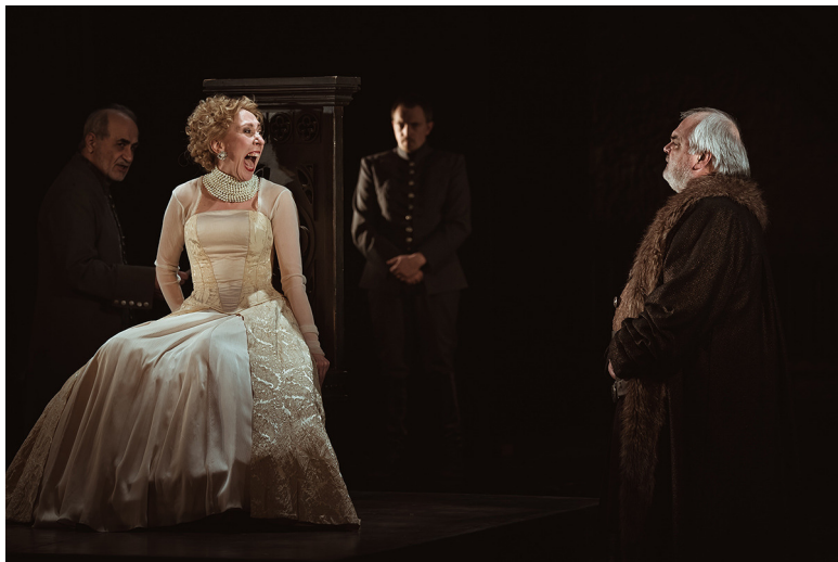
«Спектакль „Баиня смерти“. Театр Армена Джигарханяна»

что скоро появятся новые модификации фотоаппаратов, которые смогут работать без сбоев.