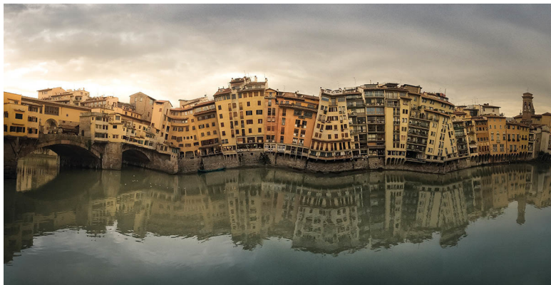
«Флоренция, набережная около Золотого моста»

смартфоны так не могут – они возмущаются и требуют не пить пива перед съемкой.