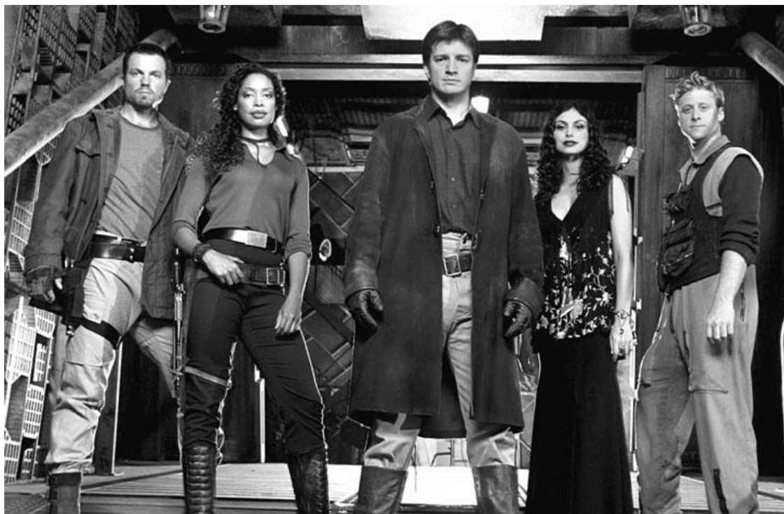
Афиша телесериала «Светлячок»

ужастике «Слизняк» (Slither, 2006), мистическом триллере «Белый шум 2: Сияние» (White Noise 2: The Light, 2006), романтической комедии «Официантка» (Waitress, 2007). Из-за того, что сериалы, куда Филлиона приглашали на роль, вскоре закрывались (так было, например, с сериалом Drive, закрытом на шестом эпизоде) в среде фанатов телешоу за ним закрепилась репутация «убийцы сериалов». Казалось, на этом карьера талантливого актера бесславно завершится, однако в 2008 году режиссер Джонатан Фрейкс, известный своей любовью к фантастике, помня игру Филлиона в «Светлячке», пригласил его попробовать на роль писателя Ричарда Касла.