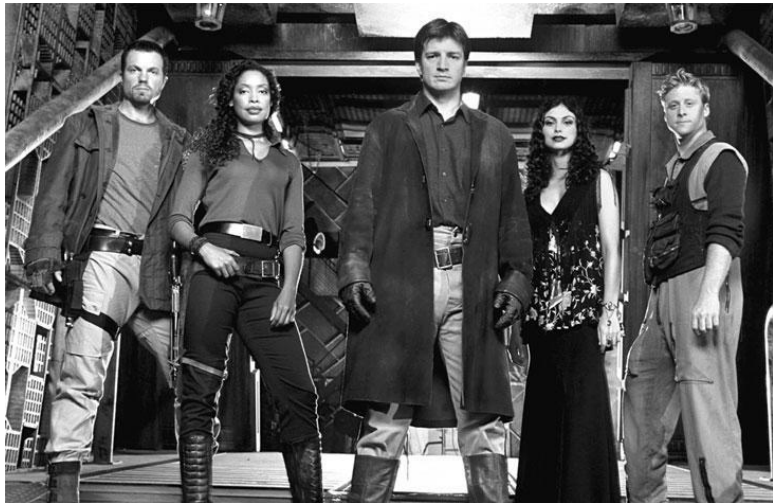
Афиша телесериала «Светлячок»