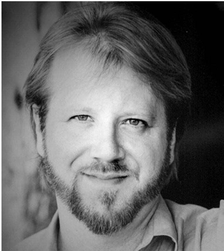
Эндрю У. Марлоу – американский сценарист, создатель сериала «Касл»