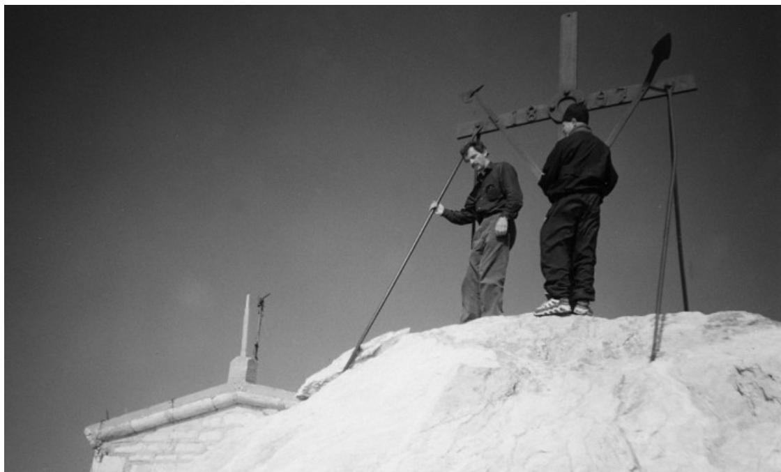
Паломники у креста на вершине Афонской Горы

Один паломник XIX столетия, пришедший в ветхий «доиоакимовский» храм, увидел его в разоренном состоянии: нижняя часть купола отвалилась, и камни в беспорядке валялись на полу. Иконостас был исковеркан так, что иконы не стояли на своих местах, половые плиты и доски были выворочены. Иконы иконостаса, сделанные ввиду здешней сырости из меди, казались как бы простреленными. И воображение уже рисовало зверства турок. Но в действительности это совершили обыкновенные молнии, которые часто находили себе не лучшую цель в