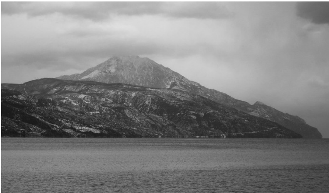
Вершина Святой Горы Афон почти всегда скрыта облаками

отвели в самую лучшую гостевую келью, где было только жесткое ложе да гвоздь, на который можно было повесить подрясник. Не было ни душа, ни электричества. Словом, батюшка попал в живую старину. И после службы он на следующий же день поспешил покинуть столь тяжелую для проживания Афонскую Гору. Надо сказать, что если бы он посетил Пантелеимонов монастырь сегодня, то был бы принят гораздо лучше.