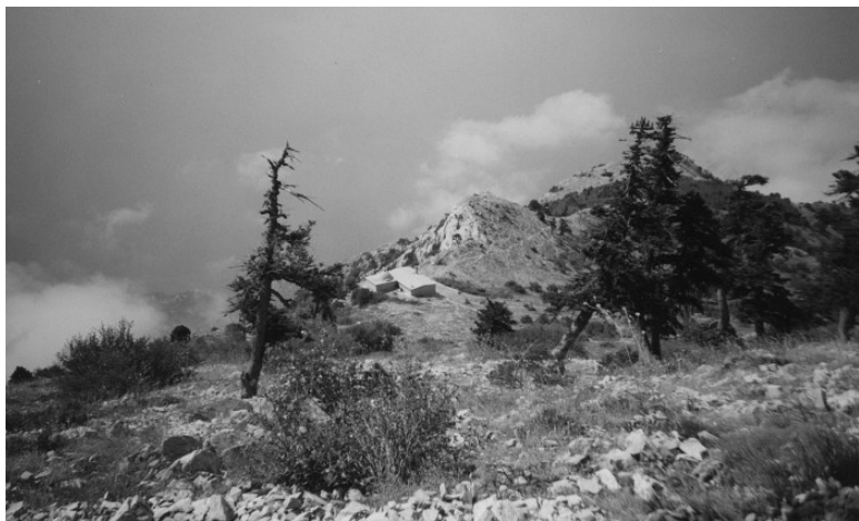
Келья Панагия. На пути к вершине