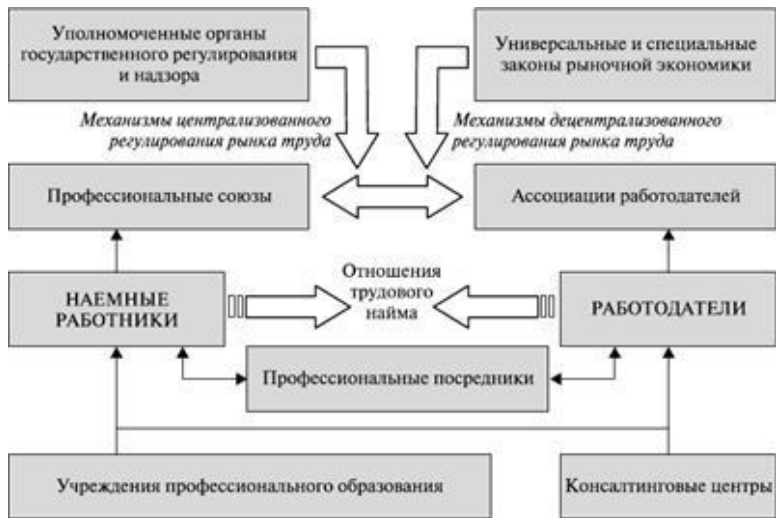
Рис. 2. Общая инфраструктура рынка труда

Представленный на этом рисунке рынок может сегментироваться по различным признакам. В настоящий момент используется несколько подходов к такой сегментации (табл. 8).