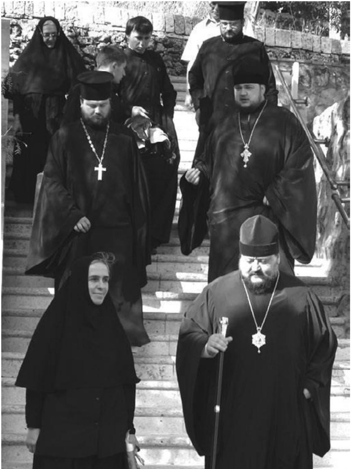
Русские паломники в Горненском женском монастыре

И в самом деле: там, где действует благодать, все переплавляется! Я, когда взошел на Голгофу, упал там и рыдал. При соприкосновении с Благодатным Огнем у всех возникает состояние потрясенности. В этом Божественном свете человек преображается, происходит полное обновление. Даже ни сказать, ни объяснить ничего не можешь; надо, чтобы прошло время, чтобы осмыслить все.