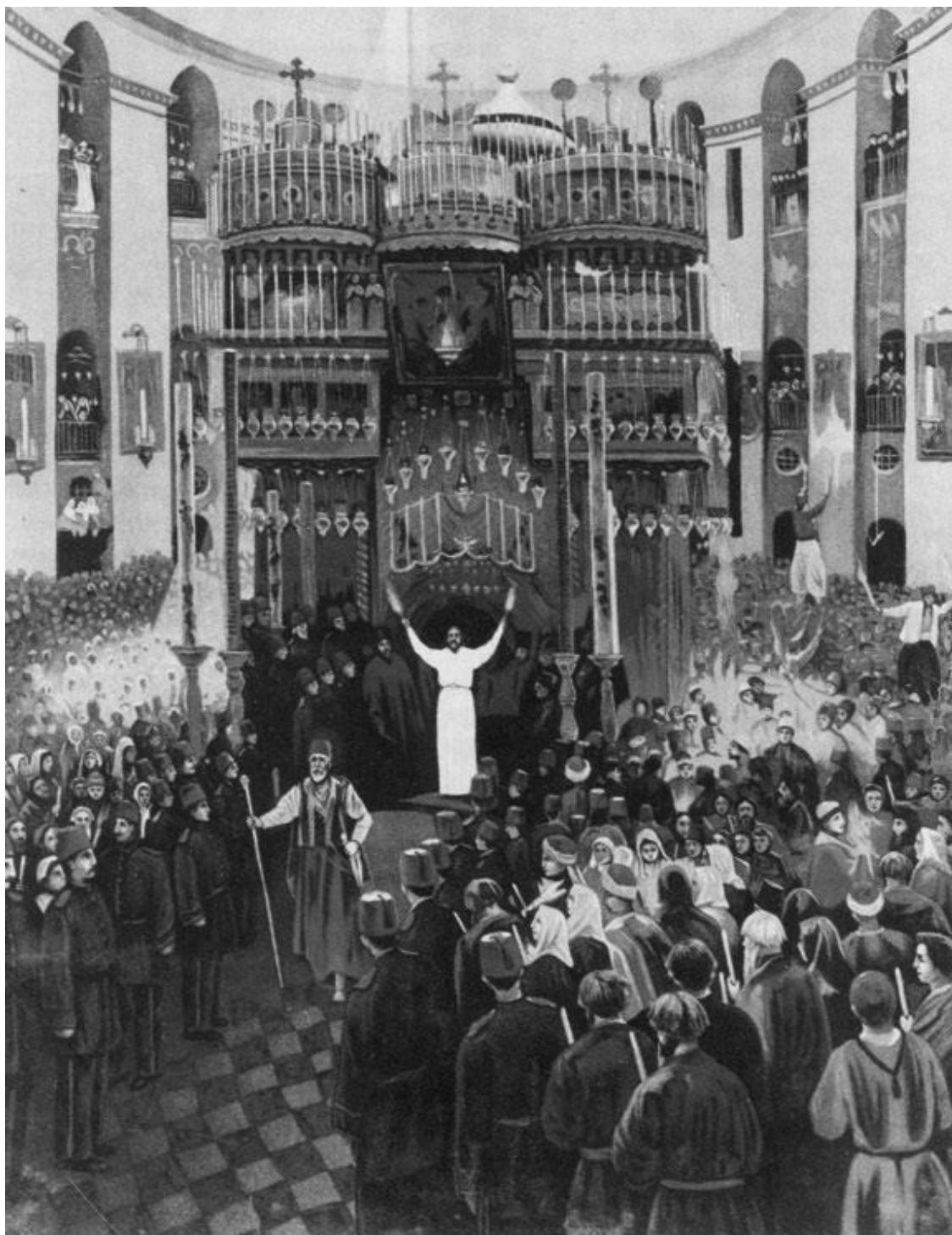
Паломники встречают Благодатный Огонь (старинный рисунок)

Только появился Огонь, смотришь – он уже и там, и здесь.