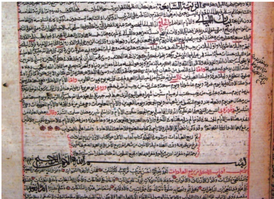
Сел. Корода. «Ихйа улум ад-дин» ал-Газали. Рукопись XV в.