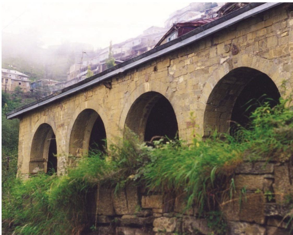
Кубани. Мечеть XV в.

В Дагестане также первое медресе связано с именем Низам ал-Мулка, т. е. возникло одно из ранних в мусульманском мире Низамийя. Еще при жизни Низам ал-Мулка (ум. в 1092 г.) в верховьях Самура, в селении Цахур, возникло медресе шафиитского мазхаба. Здесь работали кади, проповедники, преподаватели мусульманского права. В этом медресе была организована переводческая работа, здесь перевели на «лакзанский язык» трактаты двух знаменитых шафиитских ученых.