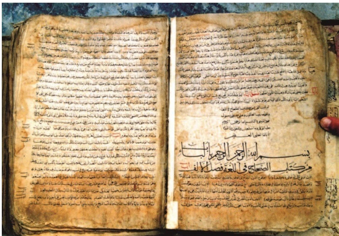
Сел. Корода. Мечеть «Ас-Сихах» – толковый словарь арабского языка. Список XV в.

Однако в настоящее время мы располагаем большим числом арабских рукописей, переписанных в указанных и в других дагестанских медресе в XVII–XIX вв. Исследования послед-