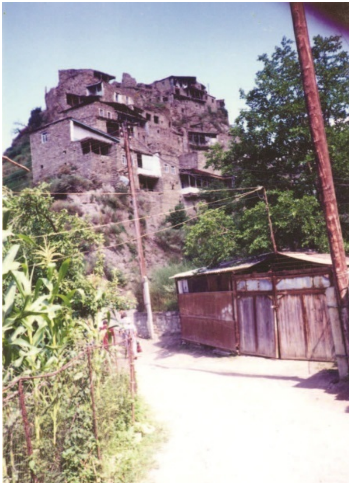
Сел. Кудутль, родина Мухаммеда Кудутлинского (1652–1717 гг.)

нет систематического обзора деятельности хотя бы одного из многочисленных дагестанских медресе.