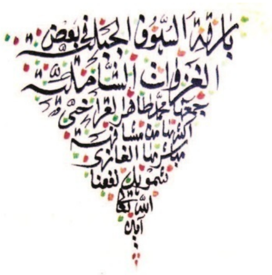
Титульный лист сочинения Мухаммед-Тахира ал-Карахи (1809–1880) «Блеск дагестанских сабель в некоторых шамилевских битвах».

Разумеется, исторические сочинения не были единственной жанровой категорией литературной и научной деятельности в Дагестане в X–XV вв. А.К. Аликберов показал, что к началу XII в. в Дербенте уже существовали устойчивые традиции хадисоведения и составления суфийских трактатов (прежде всего здесь речь идет о выдающемся памятнике дагестанской историографии – суфийском трактате Абу Бакра Мухаммада ад-Дербенди под названием «Базилик истин и сад тонкостей»). До нас дошел также этико-догматический трактат «Вафк ал-мурад» («Соответствие предмету желаний» Ахмада ал-Йамани (ум. в 1450 г.), написанный в Кумухе. Однако жанр исторических сочинений был наиболее значимым числом сочинений, созданных в процессе формирования общедагестанской литературной традиции.