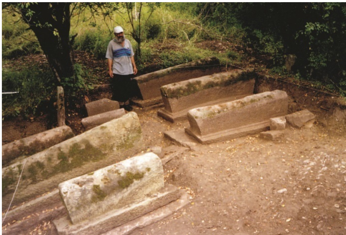
Калакорейи. «Арабское кладбище». X–XI вв.

Мы дали описание только трех мечетей. К их числу можно добавить еще ряд древних культовых сооружений Дагестана. Это «дворовая мечеть» XII в. с 17 сохранившимися каменными базами – фигурными опорными столбами; мечеть в сел. Фите Агульского района с куфическими текстами XI в. на деревянных конструкциях; знаменитая мечеть XI–XII вв. в сел. Рича с надписями о героическом сопротивлении монгольским отрядам в 1239 г. Вплоть до XV–XVI вв. продолжалось строительство мечетей, и к концу этого времени культовые сооружения обслуживали почти все население Дагестана.