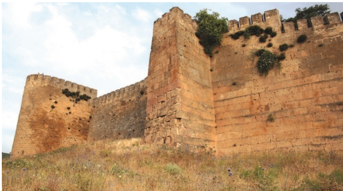
Древние стены Дербента

банд («Плотина ворот», «Узел ворот»), тюрк. Темир-капы («Железные ворота»), рус. Железные врата, Дербень и др.