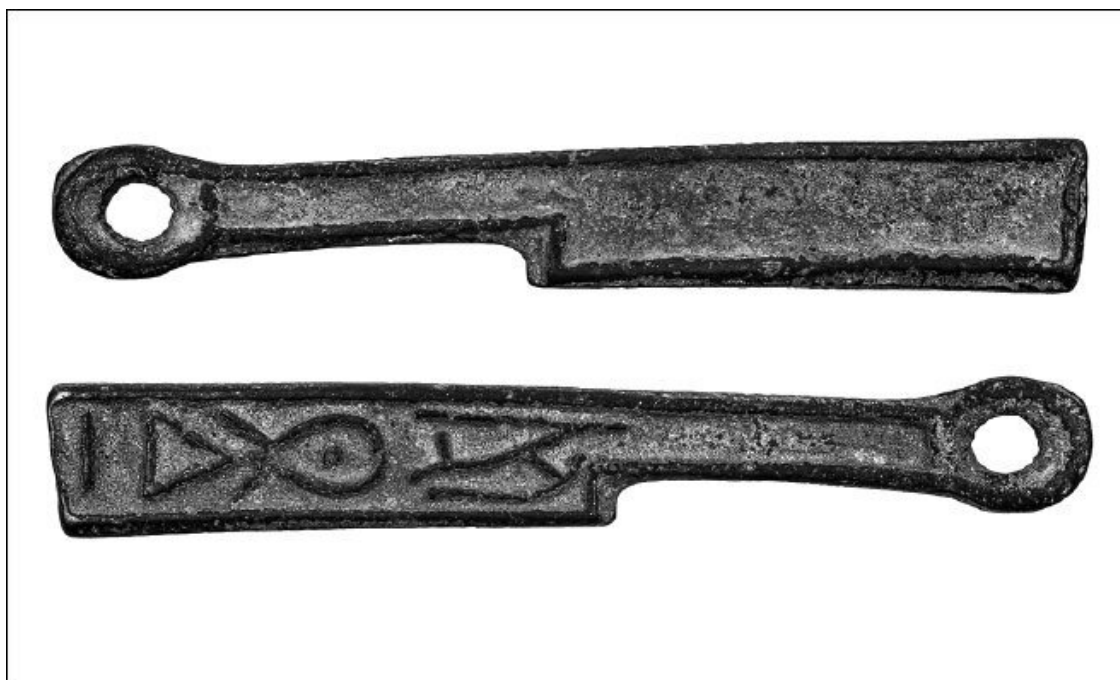
Ножи как тип древней валюты появился в Китае еще до наступления новой эры

Но когда частые войны опустошили империю, была предпринята попытка выпуска в качестве денежных эквивалентов государственных билетов из шкур белого оленя (они были квадратного размера и напоминали современные бумажные деньги), но олени вскоре закончились и от данной идеи отказались.