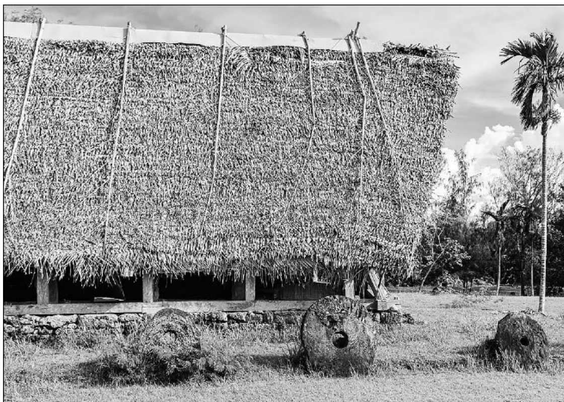
На островах Тихого океана деньгами служили камни раи – огромные диски из известняка с отверстием посередине

За каждым раи было закреплено устное предание о происхождении и владельцах. Если при изготовлении или транспортировке кто-то погибал, ценность каменной монеты возрастала.