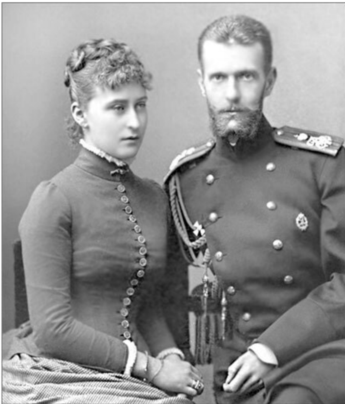
Сергей Александрович и великая княгиня Елизавета Федоровна