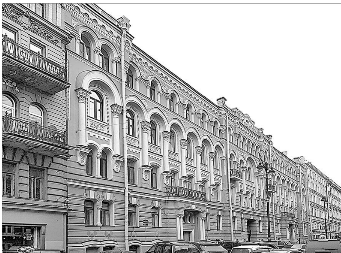
Дом № 3. Фото авторов, 2021 г.

Следующий на нашем пути дом под № 3, бывший доходный дом подворья Троице-Сергиевой лавры. Четырехэтажный песочного цвета с длинным протяженным фасадом дом сохранил богатую декоративную отделку. Если его первый этаж, традиционно рустованный с замковыми камнями над окнами, – характерен для рядовой петербургской застройки второй половины XIX в., то оформление фасада со второго этажа по четвертый решено архитектором в стиле неоренессанса.