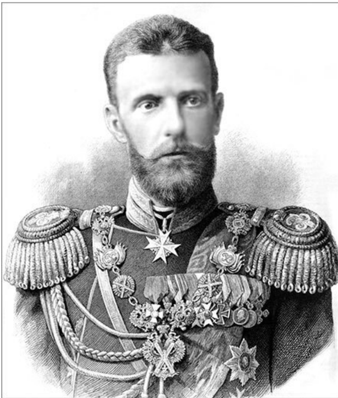
Великий князь Сергей Александрович