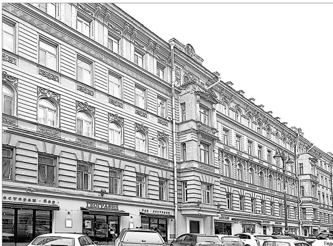
Дом № 5. Фото авторов, 2021 г.

Первым владельцем участка на левом берегу Фонтанки за Невской перспективой возле Троицкого подворья в 1730-е гг. стал гофинтендант императрицы Анны Иоанновны Антон Кормедон. Авантюрист, бывший парикмахер, поставлен Минихом на эту должность, а позже возглавил и Канцелярию от строений. Именно он построил на этом участке двухэтажный деревянный дом на каменном фундаменте с цокольным этажом. Однако вскоре усадьба Кормедона, «взятая в казну по начету», т. е. попросту отобранная за долги, «выпрошена» Густавом Бироном, братом всесильного тогда временщика герцога Эрнеста Иоганна Бирона. После смерти Анны Иоанновны в 1740 г. и дворцового переворота братьев арестовали, усадьбу конфисковали, а уже через год, в результате очередного переворота, на российский престол взошла Елизавета Петровна. Она одарила многих своих сторонников, а эту усадьбу пожаловала своему духовнику Федору Яковлевичу Дубянскому 185 .