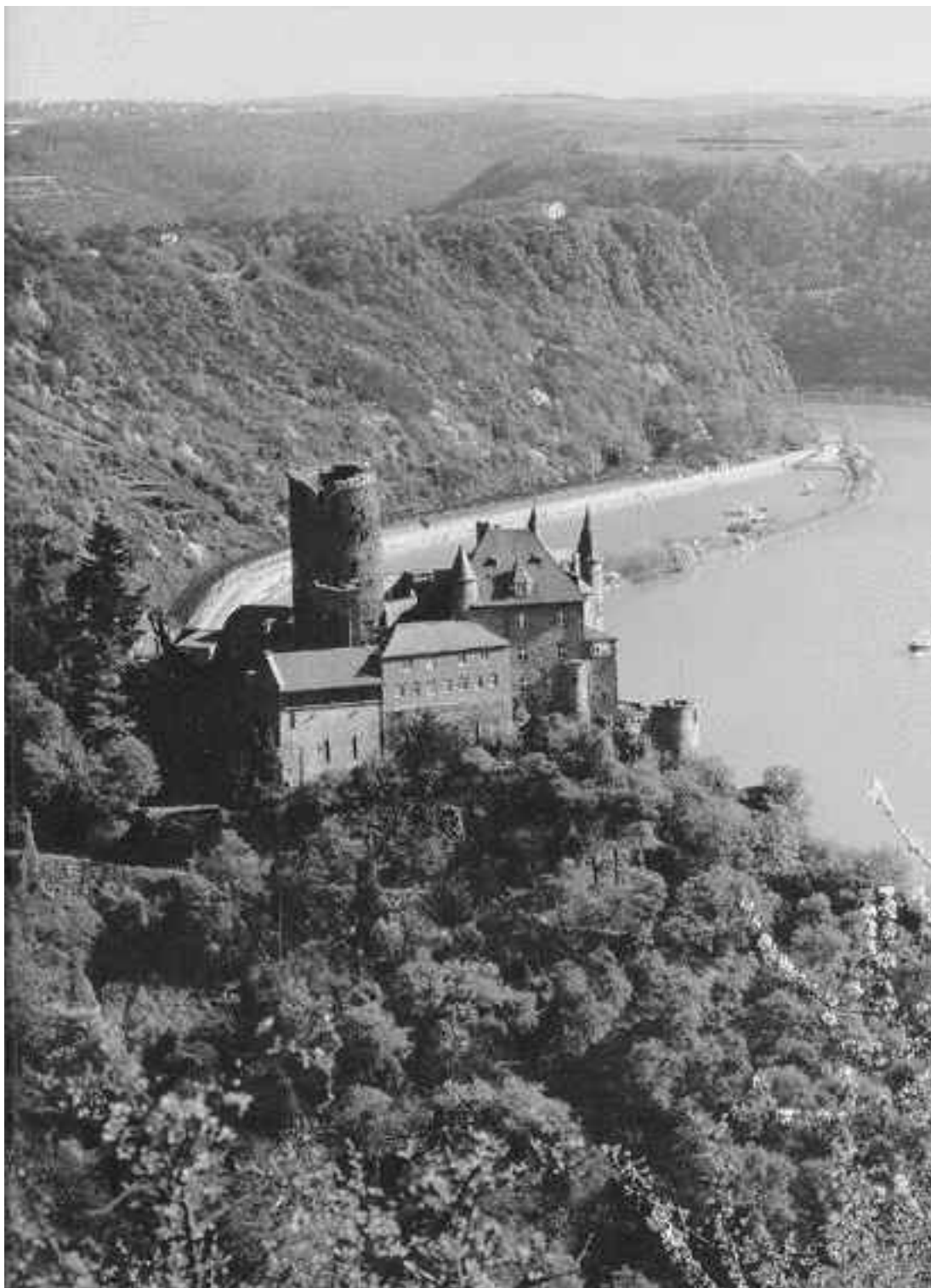
Рейн у Сланцевых гор

Путешествие по спокойным водам Рейна приятно и познавательно. Погружение в историю начинается уже с посадки, ведь пассажирские лайнеры носят звучные имена коронованных особ, композиторов, писателей, а также знаменитых мест и архитектурных памятников. К последним относятся и замки, которыми Германия богата больше, чем любая другая европейская страна. Вздвываясь на вершинах гор или скрываясь в зелени на пологих склонах, средневековые крепости нисколько не противоречат урбанистическим видам. Чаще полуразрушен-