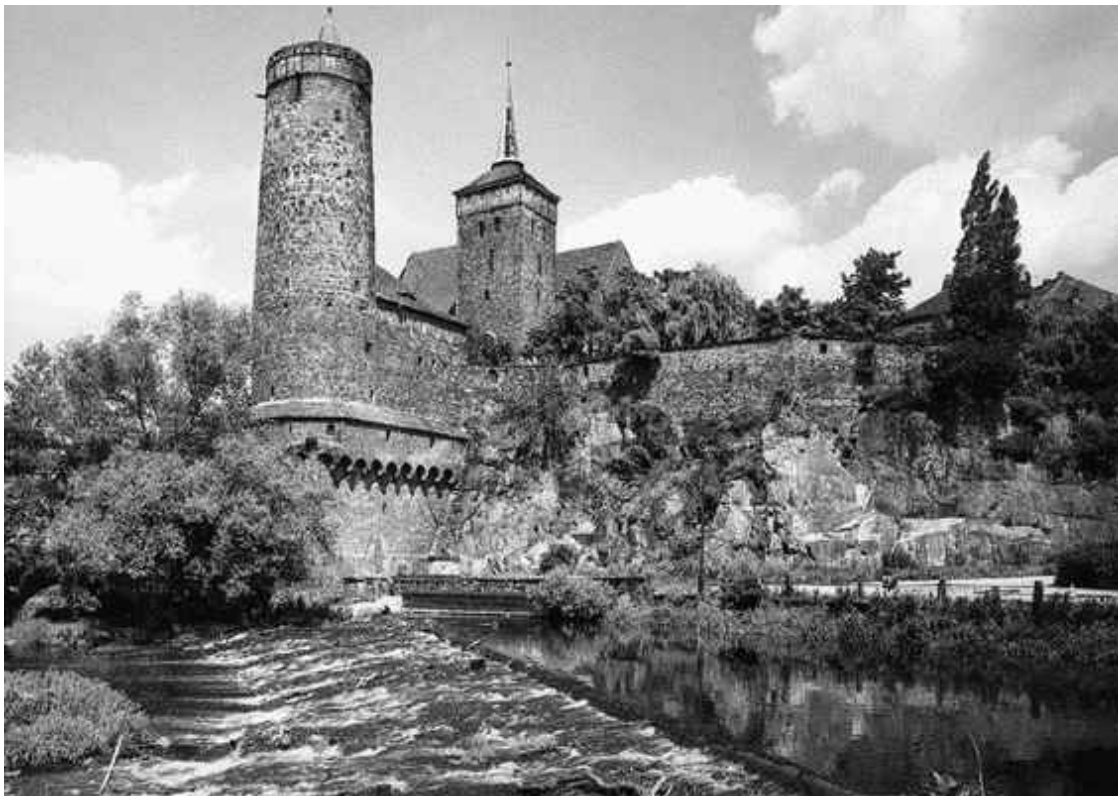
Замок с круглой оборонительной и квадратной жилой башнями

положении, а не в качестве и боевом оснащении построек. В XI–XII веках молодое, непримечательное и ранее штатское явление под названием «замок» претерпело существенные изменения. Обогатившись новыми элементами, неуклонно развиваясь, замок обрел эффектный вид, став полноценным оборонительным сооружением. Помимо прочих удобств, новая резиденция позволяла аристократу не только отделиться от черни, но и давала чувство превосходства высшего сословия над низшим.