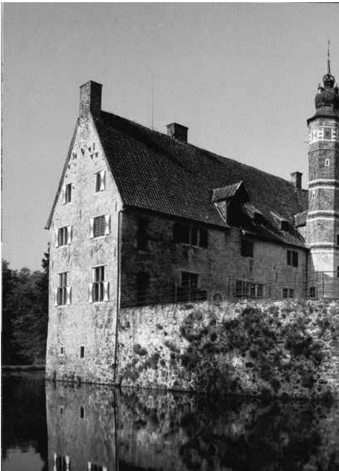
Крепость с укрепленным домом посреди рукотворного озера

Пример иного отношения к родовому гнезду, возможно, подали рейнские графы Ангулемы, чье жилище окружала овальная в плане стена, укрепленная 7 примыкающими к ней каменными домами, среди которых находилась и кузня. Просуществовав около трех столетий, этот замок был покинут владельцами, построившими себе новую резиденцию. Сегодня ни один историк не может сказать, в какой момент благородные германцы стали строить более надежное и обороноспособное жилье. Во всяком случае уже во времена Оттона Великого рейнская знать не полагалась на ров с палисадом и не хотела совершать утомительные перебежки из