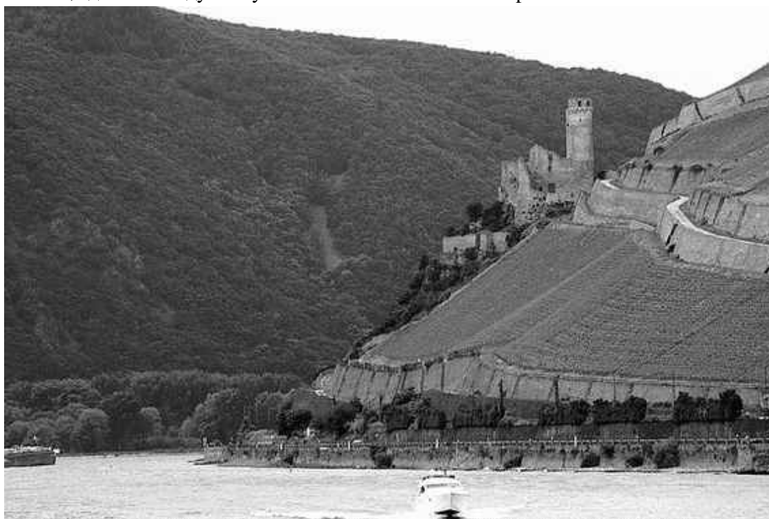
Эренфельс – один из самых старых высотных замков на Рейне

Большинство ранних германских замков оставляет впечатление перенесенных на гору господских дворов. Их фортификация ограничивалась постройками, затруднявшими приближение врага, то есть глубокими рвами, валами, мощным кольцом стен в виде палисада или каменной стены. Простые деревянные или фахверковые дома на фундаменте из валунов и даже массивные каменные дома из-за низко расположенного входа трудно назвать оборонительными сооружениями. В ту эпоху все высотные постройки возводились графскими родами. Очевидно, что стремление знати наглядно выразить свое могущество находило выход в возвышенном