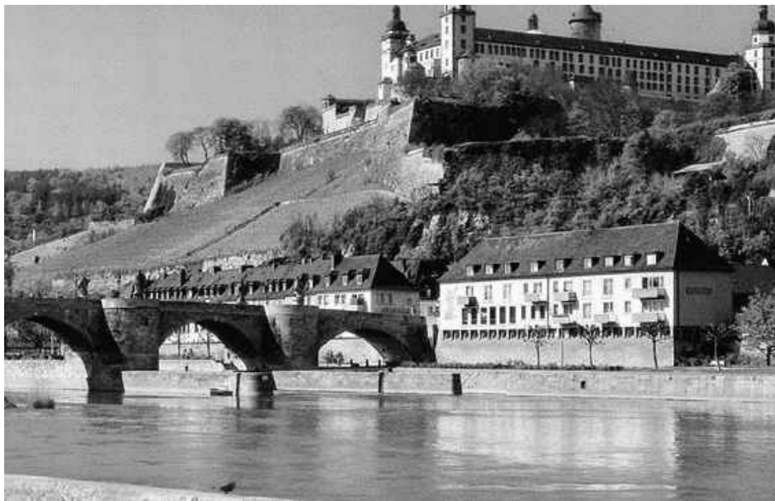
Неприступная крепость Мариенберг в верхнем течении Рейна