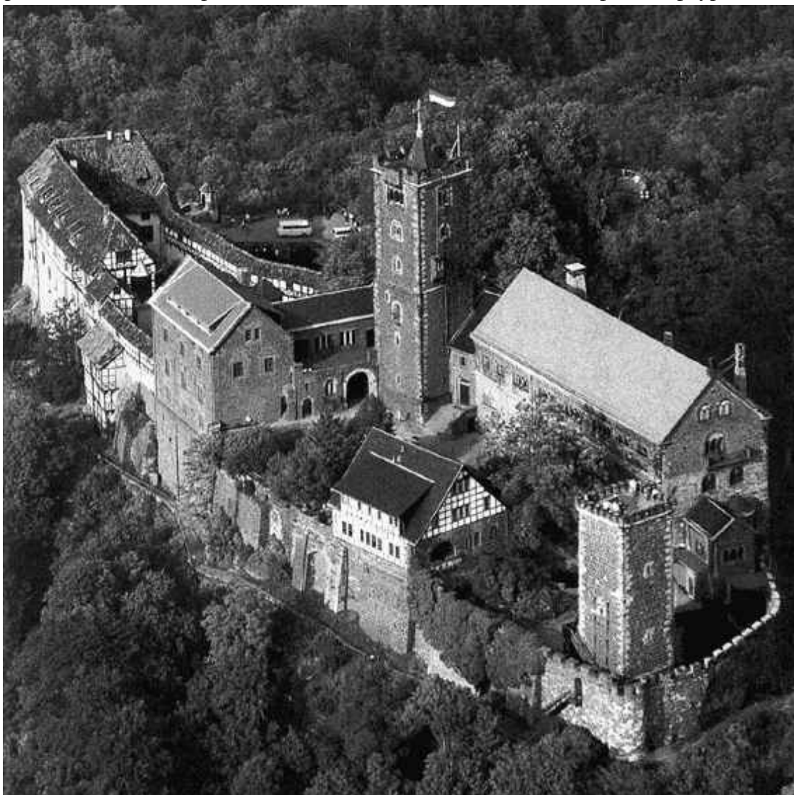
Вартбург – замок, возведенный на мотте и позже дополненный фахверковыми постройками

тельную роль. Упадок наступил с пресечением династии основателей, некогда могущественной, располагавшей обширными владениями вблизи и вдалеке от города Марбург.