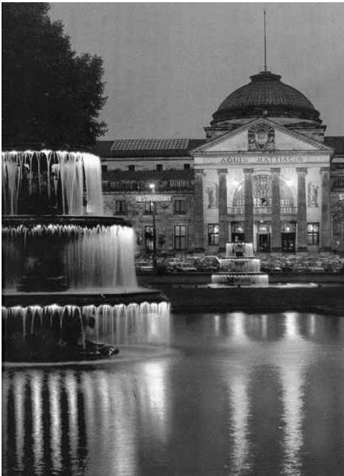
Сегодняшний Висбаден: фонтаны, помпезный павильон с источником минеральных вод

Городской замок Висбадена сотни лет оставался без хозяев и все же не узнал полного запустения. К середине XIX века значительная его часть превратилась в руины, зато в единственной сохранившейся башне скрывалась настоящая сокровищница. Устроенная в ней библиотека хранила около 60 тысяч томов, включая манускрипты, образцы литературы Северного Ренессанса, исторические документы, описывающие времена присутствия римлян. Сотрудники музея предлагали посетителям взглянуть на резной деревянный алтарь, выполненный мастерами Высокого Средневековья, посетить кабинет естественных наук с богатыми коллек-