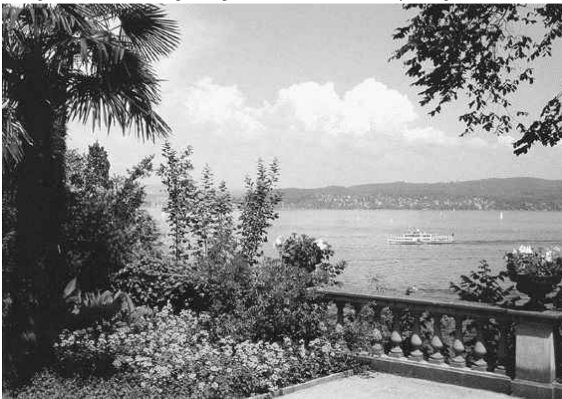
Боденское озеро – место, где начинается Рейн

Несмотря на близость к арктической зоне, Рейн никогда не замерзает, что делает его транспортной магистралью, важной как для Германии, так и для всей Европы. Широкое и глубокое русло реки заключает в себе сложные участки с отмелями и подводными скалами. Со временем хорошо изученное, оно уже не препятствует судоходству, особенно оживленному в среднем течении, на участке от Майнца до Кёльна, который часто именуется Романтическим Рейном. Путешествуя по средневековым замкам, не стоит отказываться от посещения ближайших городов, ведь каждый из них напрямую связан с дворянскими поместьями, а некоторые представляют самостоятельную культурную ценность, поскольку являются памятниками античной эпохи. Глядя на Майнц с высоты птичьего полета, трудно поверить, что этот типично европейский населенный пункт основали римляне. Бывший епископский город, некогда составлявший собственность герцога Гессен-Дармштадтского, с недавних пор признан столицей молодой земли Рейнланд-Пфальц. Его никогда не громили вражеские войска, и в отсутствие иных крупных потрясений здесь сохранились следы основателей: остатки стен античной крепости и водопровод, когда-то стоявший на 500 столбах, из которых уцелело лишь 60. К наследию римлян относится и раннехристианская базилика с двумя хорами.