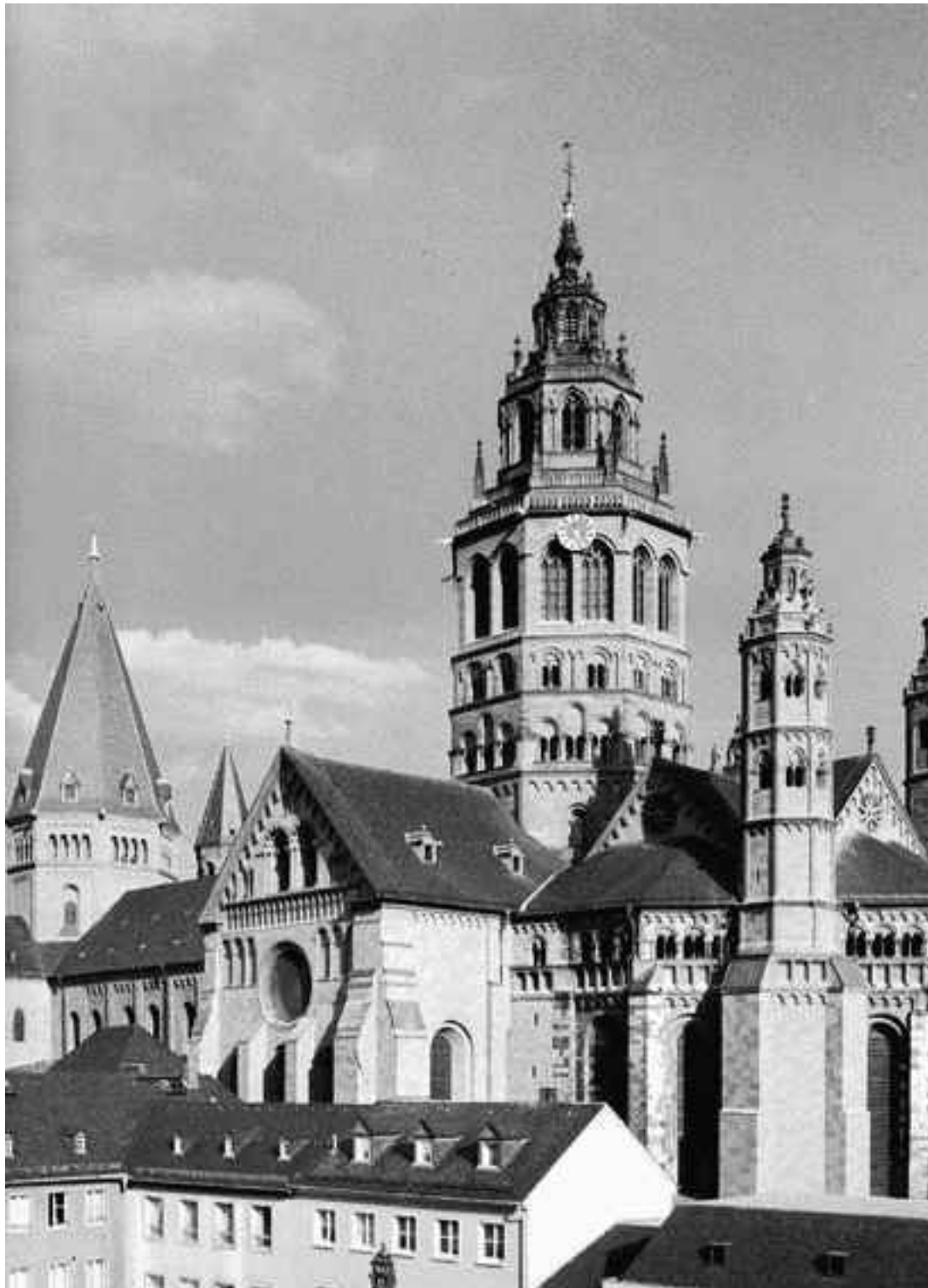
Собор Святого Мартина в Майнце

Из Майнца по германским землям распространилось такое полезное явление, как книгопечатание, и совсем не полезные идеи контрреформации, которые, к счастью, не ушли слишком далеко. Подробности относительно первого можно узнать в музее, который располагается в бывшем дворце герцога, там, где в 1450-х годах основал типографию самый знаменитый гражданин Майнца, великий просветитель Иоганн Гутенберг. В музее выставлены созданные им печатные книги, в том числе знаменитая Библия – одна из немногих церковных книг, названная именем создателя, в данном случае не бога, а человека, то есть самого Гутенберга. Главный