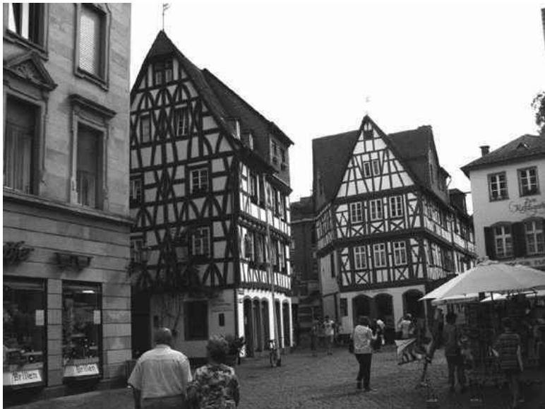
Фахверковые дома в историческом квартале Майнца