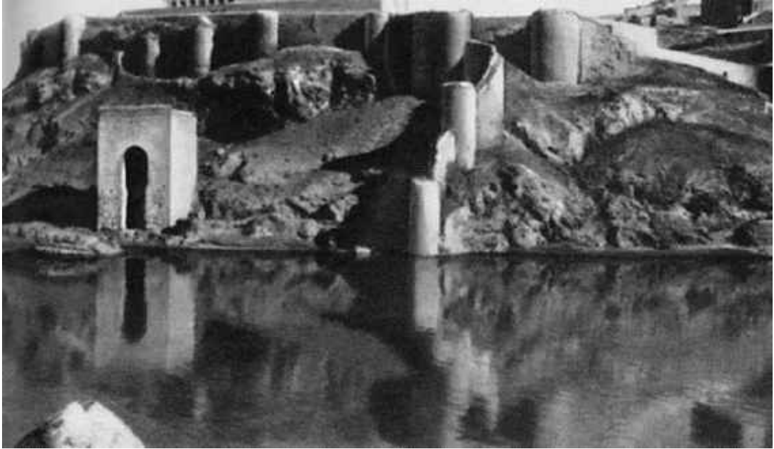
Баньо де ла Кава

По достоверным источникам, вскоре после вступления на престол Родериха в Испанию явились арабы, на самом деле призванные каким-то обиженным аристократом. Ослабленное внутренней борьбой государство вестготов не имело сил противостоять внешним врагам. Победа мавров при Херес де ла Фронтера в 711 году навсегда уничтожила королевство, а сам правитель бесследно исчез, причем неизвестно, сбежал ли он или был убит в сражении. За короткий срок мусульмане заняли почти весь полуостров, и с того времени вестготы перестали существовать как народность. Последние их представители смешались с романским населением; небольшая группа знати сумела отстоять независимость и поселилась в горах Астурии. Так на окраине бывшего королевства появилось новое государство, но уже не готское, а испанское. Первый его герой носил имя Пелайо, был внуком вестготского короля Киндасвинга и, проявив храбрость, стал родоначальником королей Кастилии. Силу варварских традиций доказывает то, что множество испанских имен собственных, например Родриго или Альфонсо, имеют готское происхождение.