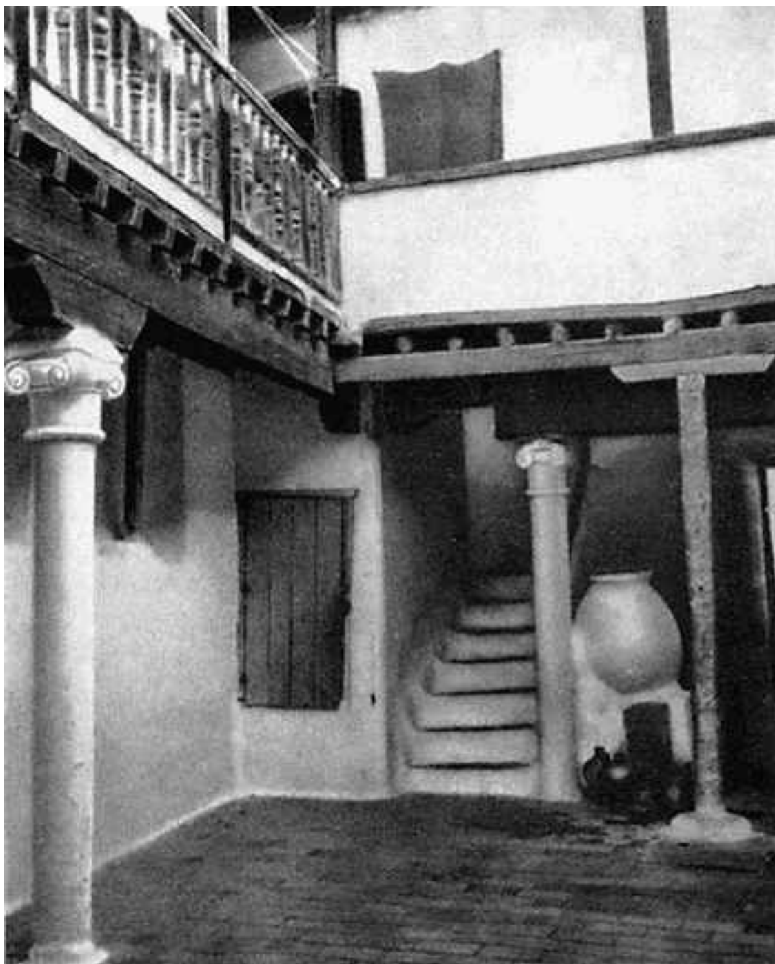
Внутренний двор старинного испанского дома

Судьба большинства мавританских построек подобна истории знаменитой в свое время мечети Алхама.