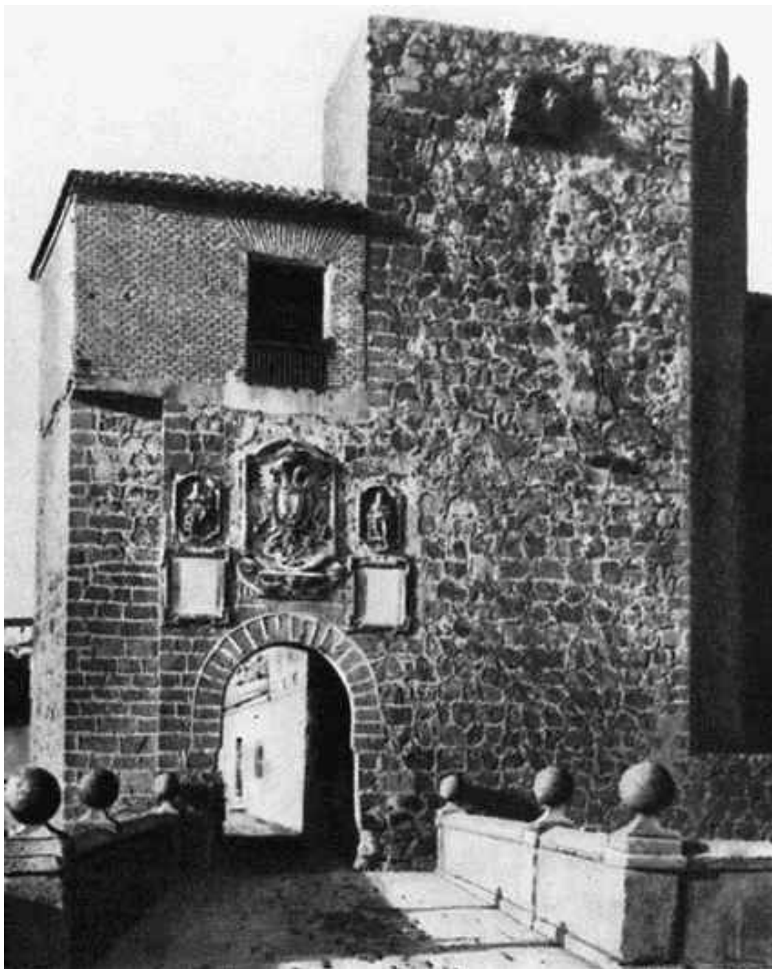
Вход на мост Сан-Мартин

В трудах арабских историков часто встречаются описания тогдашнего Толедо, походившего, по словам Абульфида, на райский сад, где «цветок граната так же велик, как сам плод». Его коллегу Идриси особенно удивили коровы, «красивые, толстые, дающие лучшее в мире молоко». Путешественники XIX века напрасно искали в бывшей Толайтале великолепные парки и необычную породу скота: чудеса исчезли вместе с захватчиками, как остался в прошлом сам город, некогда замечательный размерами, богатством и числом жителей. Завладев Толедо, мавры действительно приобрели «изобилие продовольствия и неисчислимые богатства. Жемчуга и драгоценные камни свободно продавались на рынке. Там же можно было найти украшенные изумрудами скрижали Соломона. Позже каменные доски с 10 заповедями, врученные Моисею Богом на горе Синай, были перевезены в Рим».