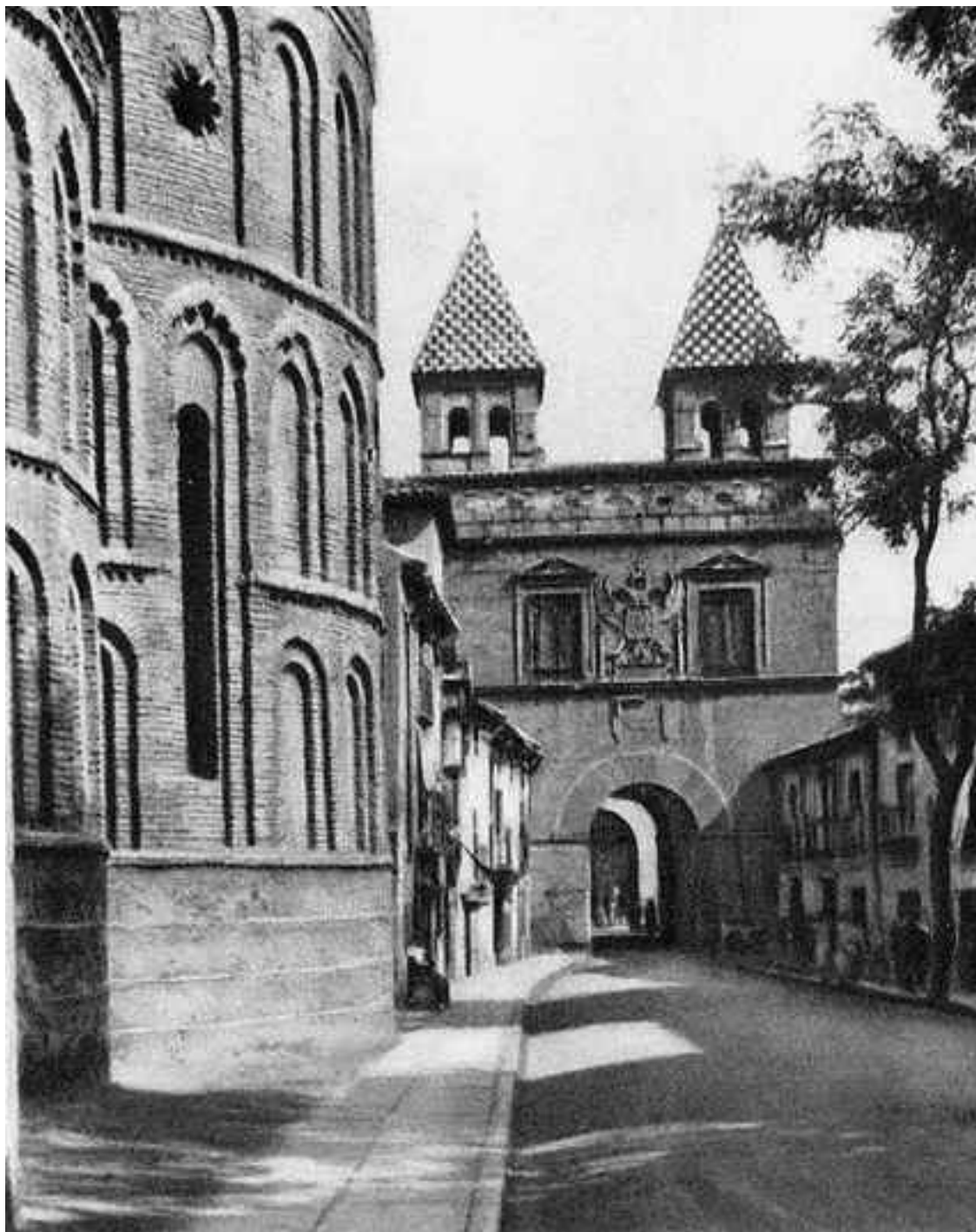
Новые ворота Бисагра