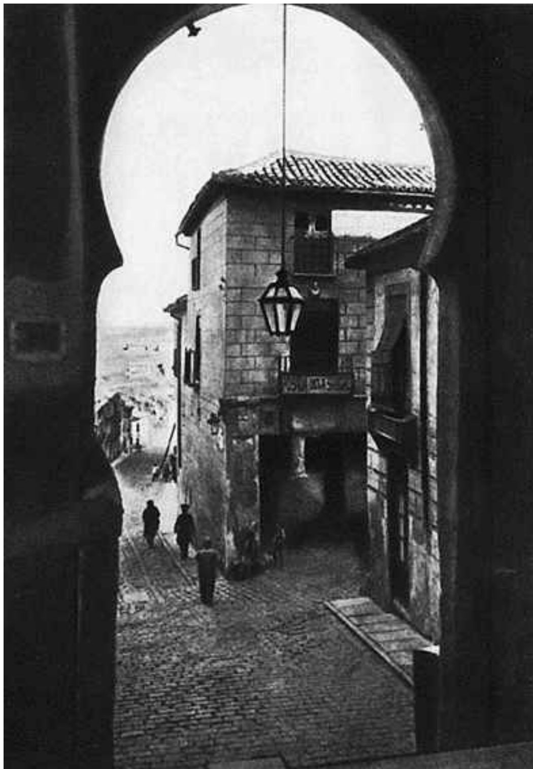
Мавританская арка близ гостиницы де ла Сангре

Казнив последних защитников, арабы причислили город к владениям халифа и объявили народу его новое название – Толайтала. Завоеватели пришли сюда не грабить, а жить, поэтому вскоре после описанных событий внутри и за стенами крепости начали появляться дома, рынки, дворцы, мечети, возведенные и украшенные в соответствии с традициями восточного искусства. Особенно бурное строительство наблюдалось в мирные годы, когда заканчивался очередной этап восьмивековой освободительной борьбы, вошедшей в историю под названием Реконкиста.