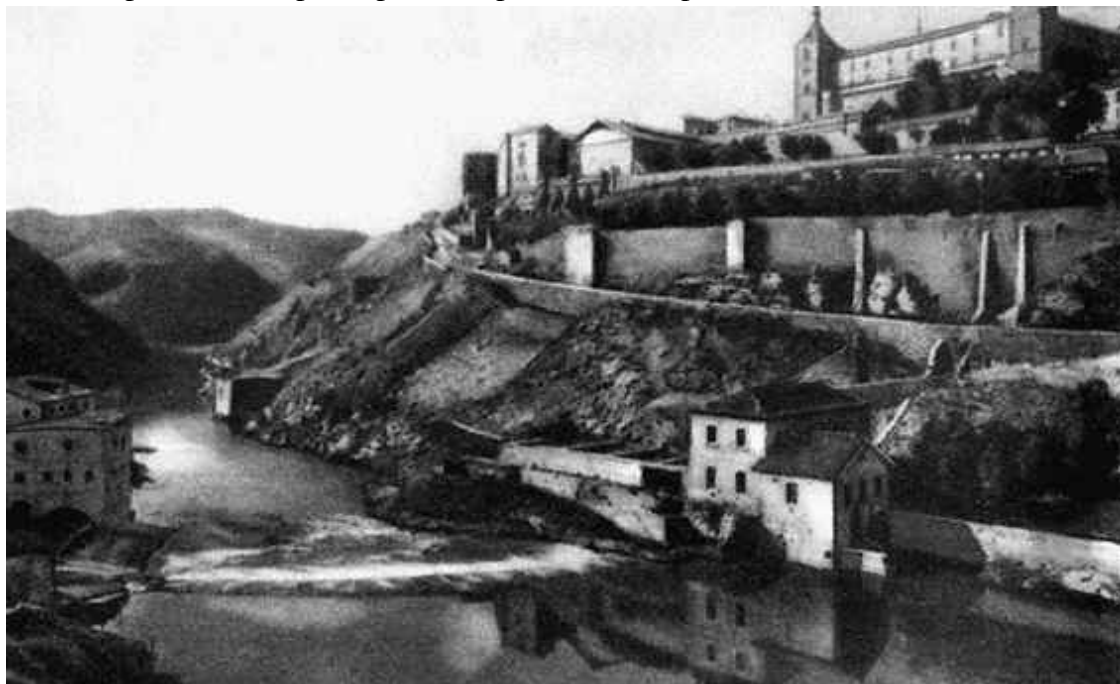
Река Тахо вблизи Толедо

В одной из новелл Хосе Сорилья описание провинциального Толедо заканчивается словами: «Потемневший, разрушенный, одинокий, он лежит в песках, всеми забытый». Скорбя об утрате городом былого величия, поэт несколько сгустил краски. Покинутая королями крепость не испытала сильного упадка, продолжая существовать так же благополучно, как и около двух тысячелетий назад. Если верить легендам, поселение на берегу реки Тахо основали кельты, смешавшиеся с племенами иберов, пришедших сюда на несколько веков раньше. К приходу римлян в 193 году оно представляло собой небольшой, хорошо укрепленный город Толетум, как называли его римские историки. Защищенная крутыми обрывами, высокими стенами и глубиной реки, крепость была неприступной, но длительной осады выдержать не могла. Горожане сопротивлялись легионерам до тех пор, пока не закончились вода и продовольствие, а затем сами открыли ворота, сдавшись на милость консула Маркуса Фульвиуса Нобилиуса. Войдя в состав огромной империи под названием Толедо, город испытал свой первый расцвет. Далекому от цивилизации народу были предложены театры, цирк, бани, храмы. Впрочем, культовыми зданиями пользовались только пришельцы, поскольку местные продолжали поклоняться собственным богам. Римляне часто связывали основание своих городов с подвигами Геракла. Легендарный герой не обошел вниманием и Толедо, избрав местом жительства безлюдные берега Тахо, вернее грот, который до сих пор называется его именем.