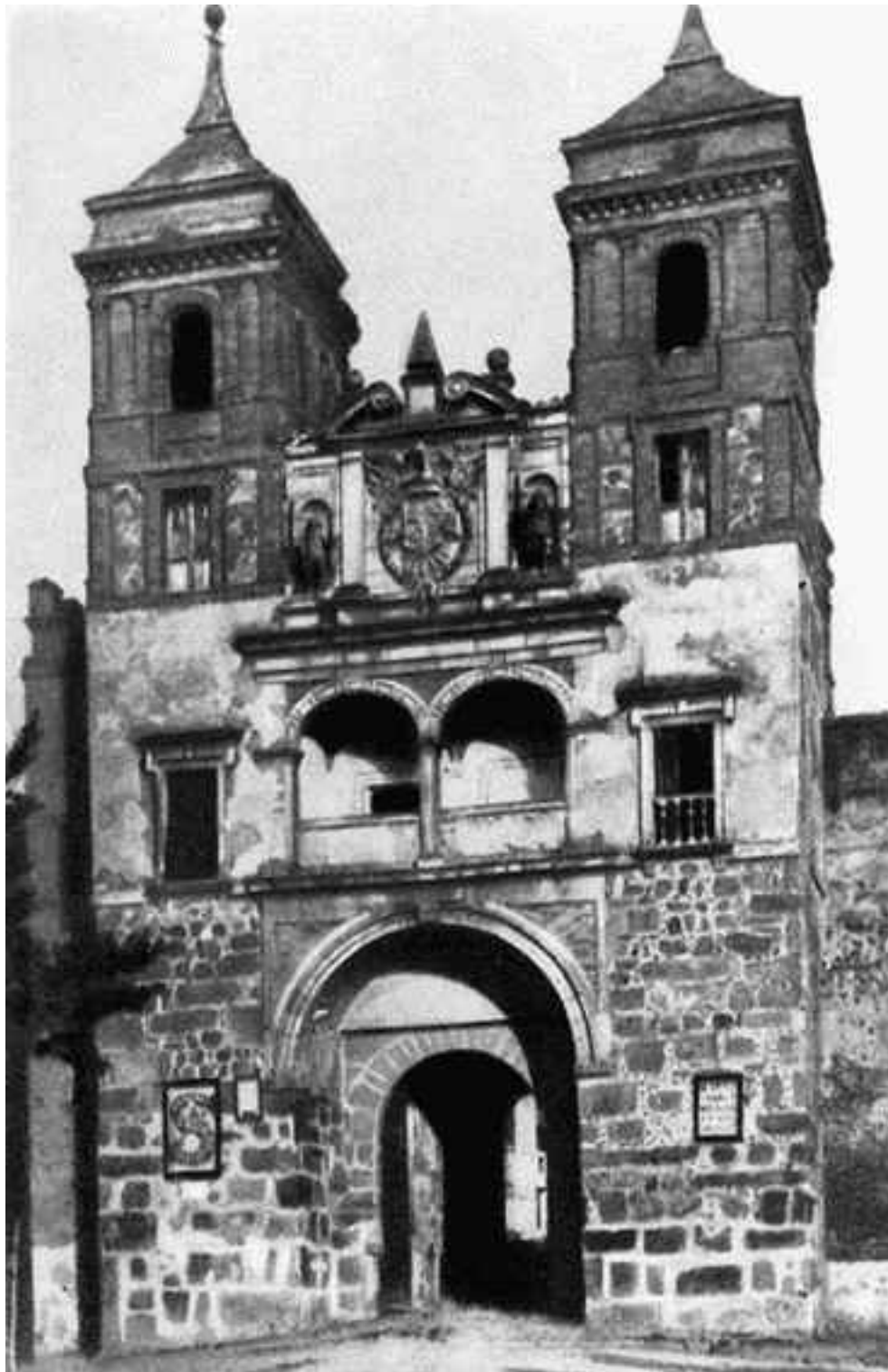
Портал дель Камброн

При неизменном интерьере внешний вид сооружения полностью изменился через 500 лет, когда за его реконструкцию взялись местные зодчие. С того времени здание стало двухэтажным, с вытянутыми окнами и массивными башнями по углам, оно воплощало в себе средневековую мощь, арабскую логику и гармоничную красоту Ренессанса.