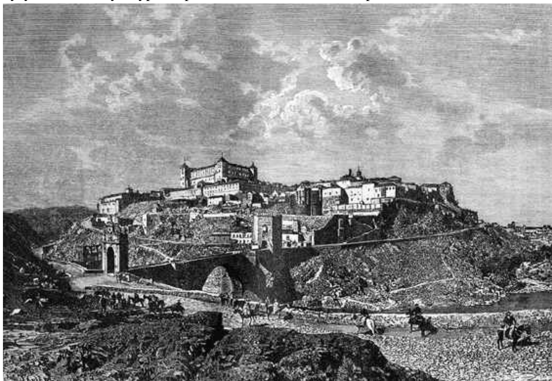
Вид на Толедо. Гравюра, 1876

Средневековую Испанию населяли представители самых разных национальностей. Кроме исконной народности, на полуострове жили арабы, евреи, итальянцы, голубоглазые потомки вестготов. Считается, что захватившие страну дикие племена по культурному уровню находились гораздо ниже местного населения. Побежденные арабами, некоторые из варваров приняли ислам, отчасти сохранив свой романский язык; многие разговаривали на арабском, будучи ревностными христианами. Умные и практичные восточные захватчики вначале соблюдали полную веротерпимость, но уже в середине IX века стал наблюдаться религиозный фанатизм, приводивший к протестам и восстаниям коренного населения. Однако именно в пору усиления тирании, когда испанцы добровольно или по принуждению воспринимали достижения мусульманской культуры, страна испытала невиданный расцвет.