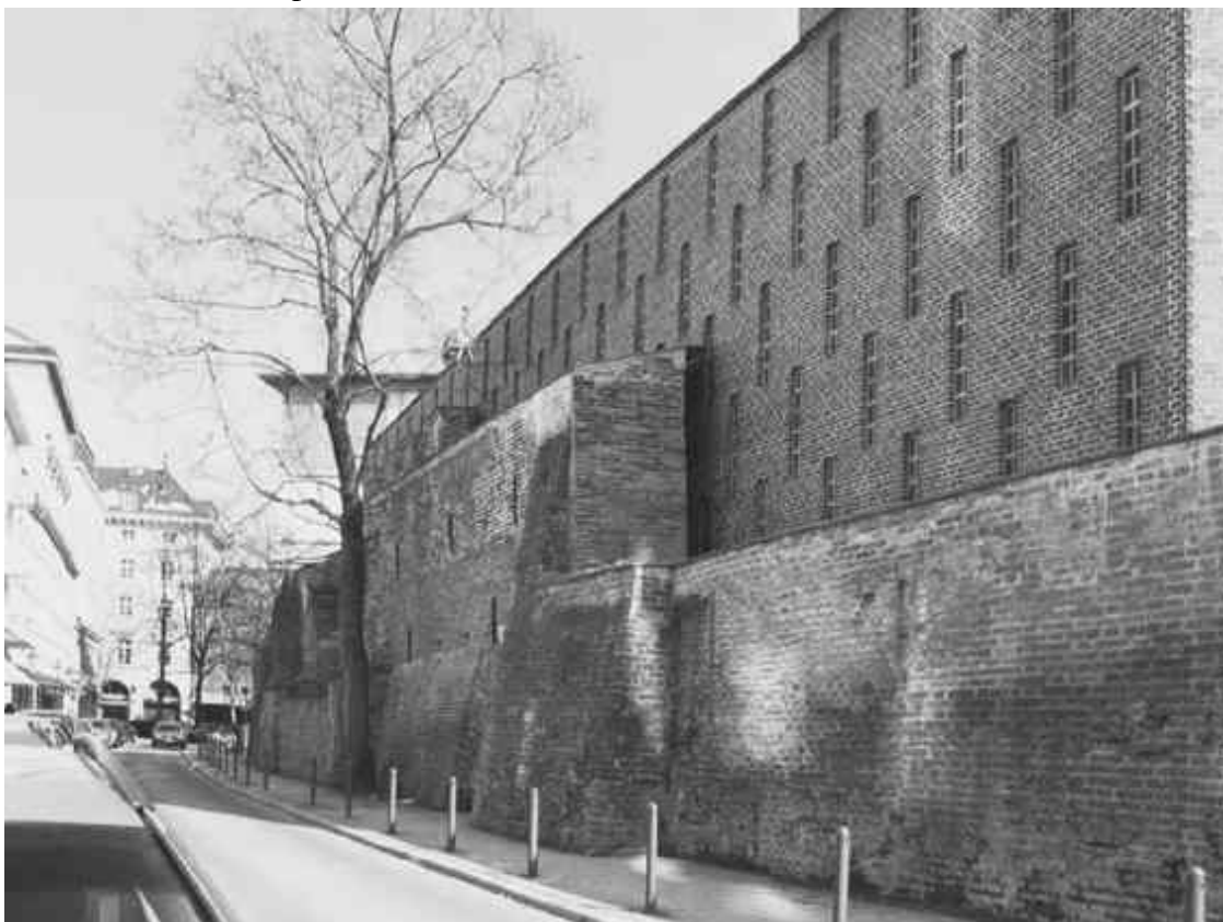
Остатки средневековой крепостной стены

Империей правили три представителя дома Виттельсбахов: Людвиг IV, Рупрехт Пфальцский и Карл VII. Остальные были германскими князьями, герцогами, шведскими королями, претендентами на испанскую корону. Неисчислимы богатства славной фамилии не истощали войны, и если состояние изменялось в размерах, то чаще в большую сторону. С прекращением рода баварских Виттельсбахов в 1777 году в борьбу за наследство включились их пфальцские родичи, сумевшие объединить оба государства в одно – могущественную Баварию, которая по воле Наполеона стала королевством.