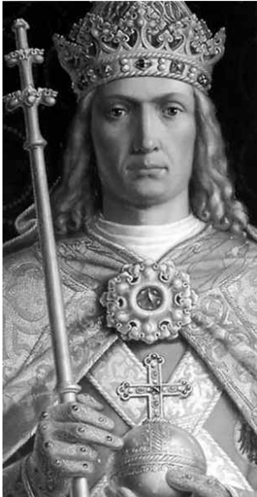
Император Священной Римской империи Людвиг IV Баварский

хов – Людвиг IV Баварский – был избран императором Священной Римской империи, после чего Мюнхен, будучи столицей рейха, получил статус города с определенными привилегиями. Высокое положение не гарантировало безопасности ни горожанам, ни правителям, поэтому последние поспешили защитить свою резиденцию второй крепостной стеной.