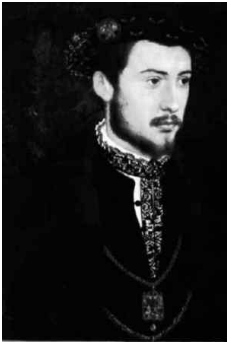
Герцог Баварский Альбрехт V Виттельсбах

Следующий царствующий Виттельсбах тоже носил имя Альбрехт и, подобно предшественнику, отличался склонностью к мирной дипломатии. Он не развязывал войн и активно поддерживал Контрреформацию. Указ о протестантском приходе, о праве на гражданство и свободе книжной торговли вышел только в XIX веке вместе с принятием первой Конституции Баварии, а князь, предвосхитив события, давал приют сторонникам Лютера, разрешал публиковать запрещенные Ватиканом книги и строить лютеранские церкви.