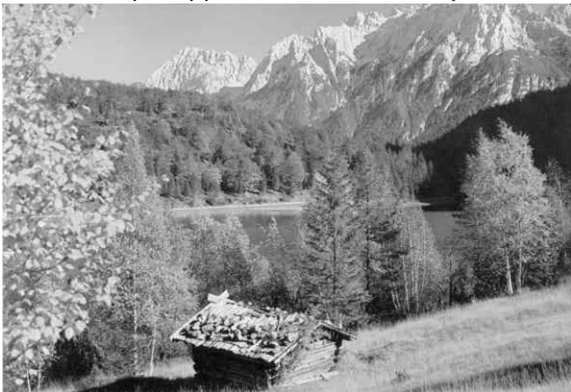
Баварские Альпы: первозданная красота природы вблизи мегаполиса

При упоминании о Баварии даже тот, кому не посчастливилось побывать в этом благодатном крае, сразу нарисует в воображении густые леса, горы, сияющие изумрудной свежестью поля и, возможно, самих баварцев, которых природа наградила не менее щедро, чем их землю, кстати, самую крупную в Германии. Трудолюбивые жители сделали ее важным аграрным районом, а всемирную славу обеспечили короли, немало постаравшиеся, чтобы привнести в свое государство мир, сделав его средоточием культуры. Гордость сегодняшней Баварии, наряду с памятниками прошлого, составляют передовые технологии. Вместе с тем в Европе найдется немного мест, столь привлекательных для туристов. Пока ценители архитектуры заворуженно бродят по улицам баварских городов, в то время как лыжники и альпинисты штурмуют склоны Баварских Альп, любители фольклора исследуют долины. Довольно обширные, по европейским меркам, равнины близ Мюнхена дают возможность добыть материал для серьезного труда и просто погрузиться в германскую старину, благо здесь она не театральная, а вполне естественная, ведь немцы, думая о будущем, постоянно оглядываются на прошлое.