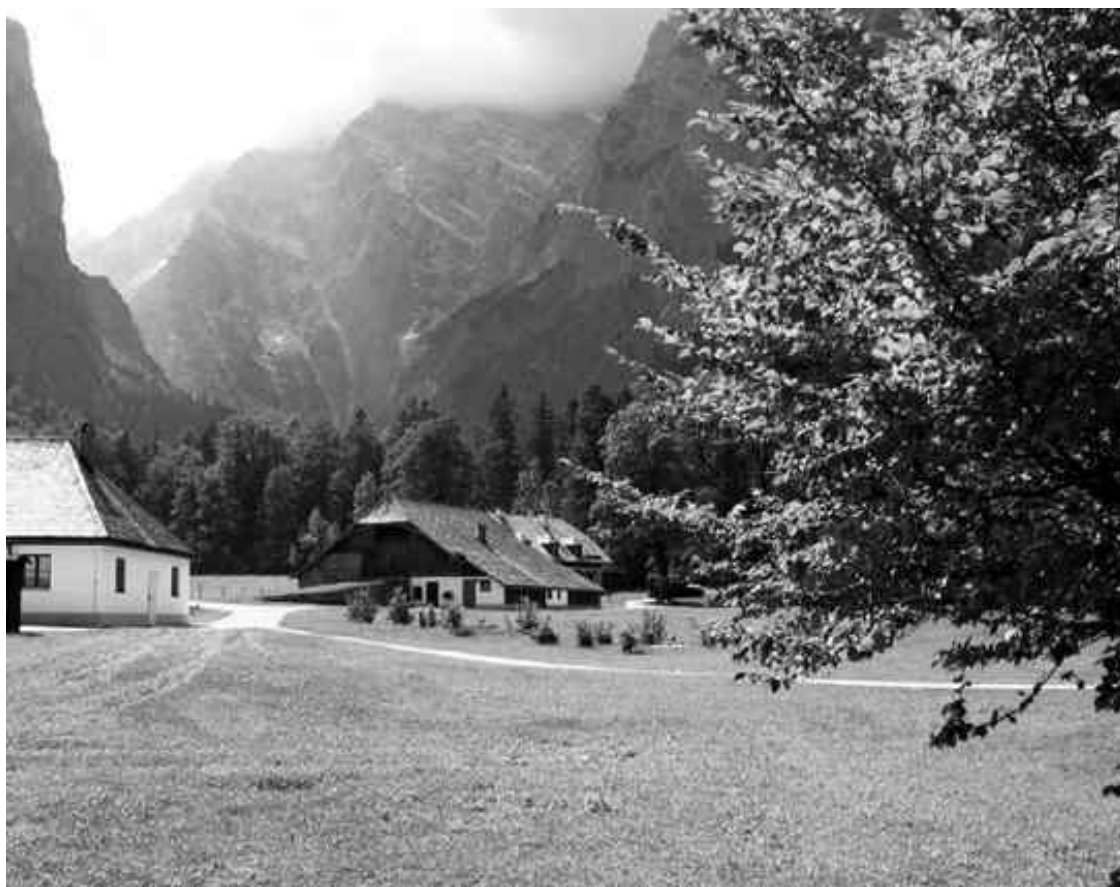
Пейзаж горной Баварии

Путешественник, приближающийся к Мюнхену с севера, получает возможность насладиться прекрасным видом на долину реки Изар. Он видит бескрайнюю равнину, мрачно-серую зимой и очаровательно зеленеющую летом, любуется возвышающимися посреди нее холмами, замечает на горизонте исполинские горы, обычно прикрытые дымкой тумана. Более впечатляющие картины открываются из баварской столицы, где горные ледники средних Альп проглядывают из промежутков между известковыми скалами. Настоящие горы начинаются уже на окраинах города, хотя с центральных улиц их можно ясно различить только перед дождем. Из-за причудливой формы облаков и разного освещения зрелище становится просто фантастическим.