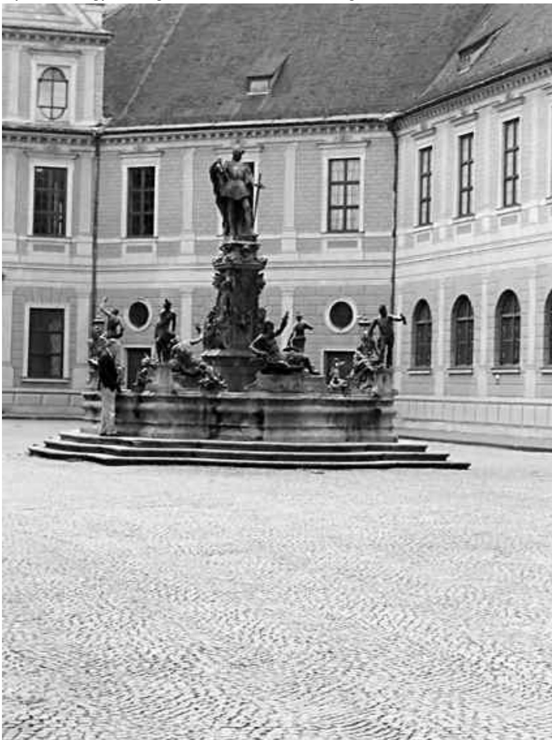
Фонтанный двор в Резиденции

обозначенные по названиям соответствующих дворов: Кайзергоф (Императорский), Кюхенгоф (Кухонный), Брунненгоф (Фонтанный) и Капелленгоф (Часовенный).