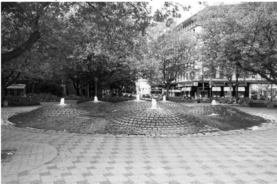
Фонтан в виде булыжных холмиков на площади Зендлингер

Сами ворота являются единственными из всех сооружений XIV века, в которых уцелели старые башни. В одной из них – южной – расположен Музей Валентина, посвященный жизни и творчеству народных певцов Карла Валентина и Лиспе Карлштадта, ублажавших слух жителей Мюнхена в первой половине XX века. Много из того, что касается этой выставки, удивляет своей курьезностью. Например, странный для упорядоченной Германии режим работы: экспозиция открывается в 11.01, а закрывается в 17.29, причем билеты имеют столь же комичную цену. В северной башне с недавнего времени находятся городской архив и дополнительные музейные залы, где представлен Мюнхен начала прошлого века.